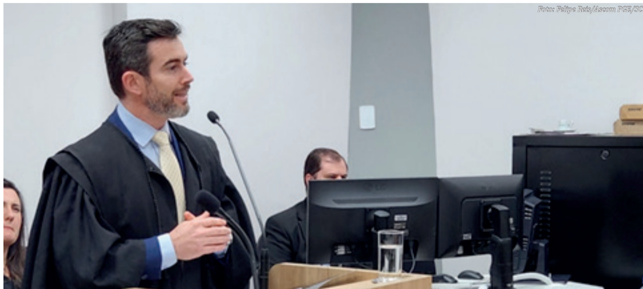
Procurador-geral do Estado faz sustentação oral na última sessão do Órgão Especial do TJSC do ano de 2025

A Procuradoria-Geral do Estado de Santa Catarina (PGE/SC) encerrou 2025 com resultados históricos. A atuação estratégica do órgão garantiu um impacto financeiro positivo estimado em mais de R$ 60 bilhões, somando recuperação de recursos, economia direta de dinheiro público e redução de valores cobrados do Estado em ações judiciais.