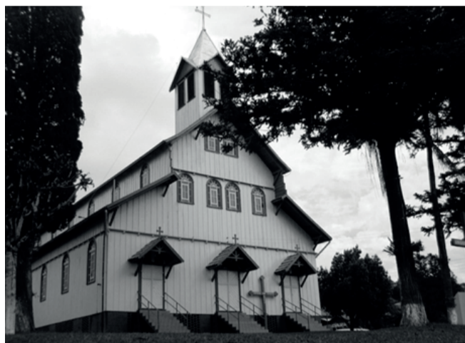
A primeira capela de São João do Oeste foi construída no local onde hoje está instalada a Casa Canônica