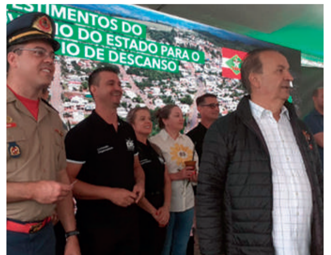
Governador Jorginho Mello esteve em Descanso, onde além de entregar obras, visitou o Parque de Exposições.