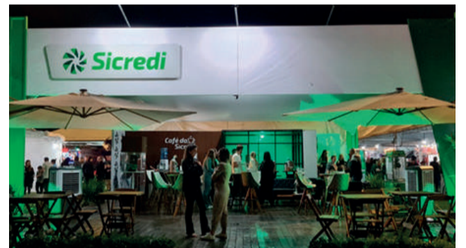
Os estandes das empresas foram muito prestigiados