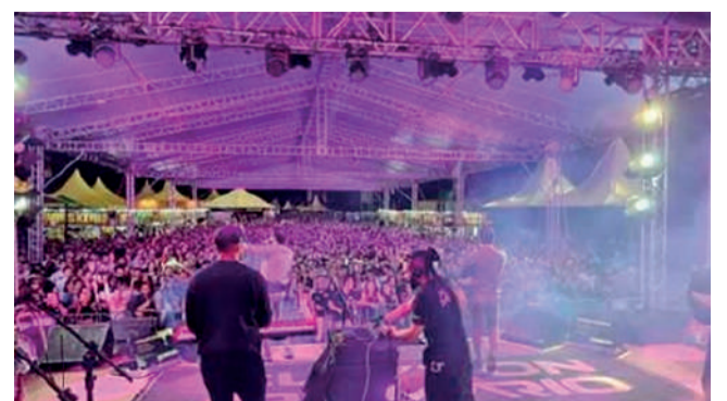
Os shows também foram sucesso da Expo Descanso.