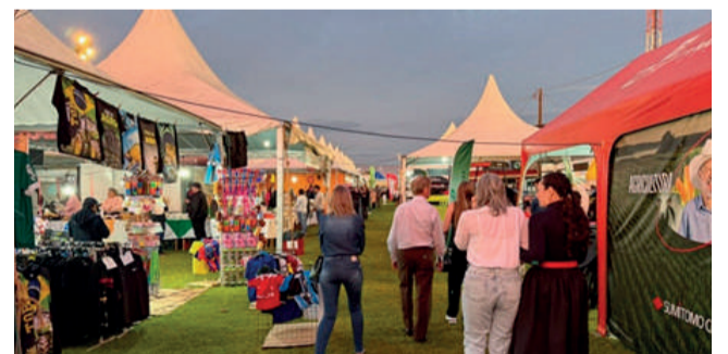
Parque de Exposições parecia uma cidade mágica.