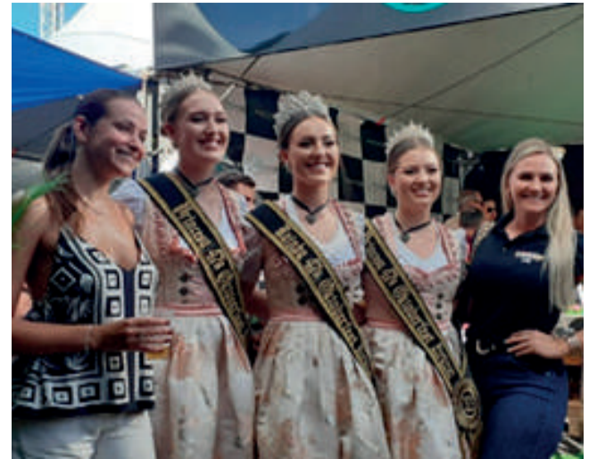
Soberanas da Oktoberfest de Itapiranga prestigiam Descanso