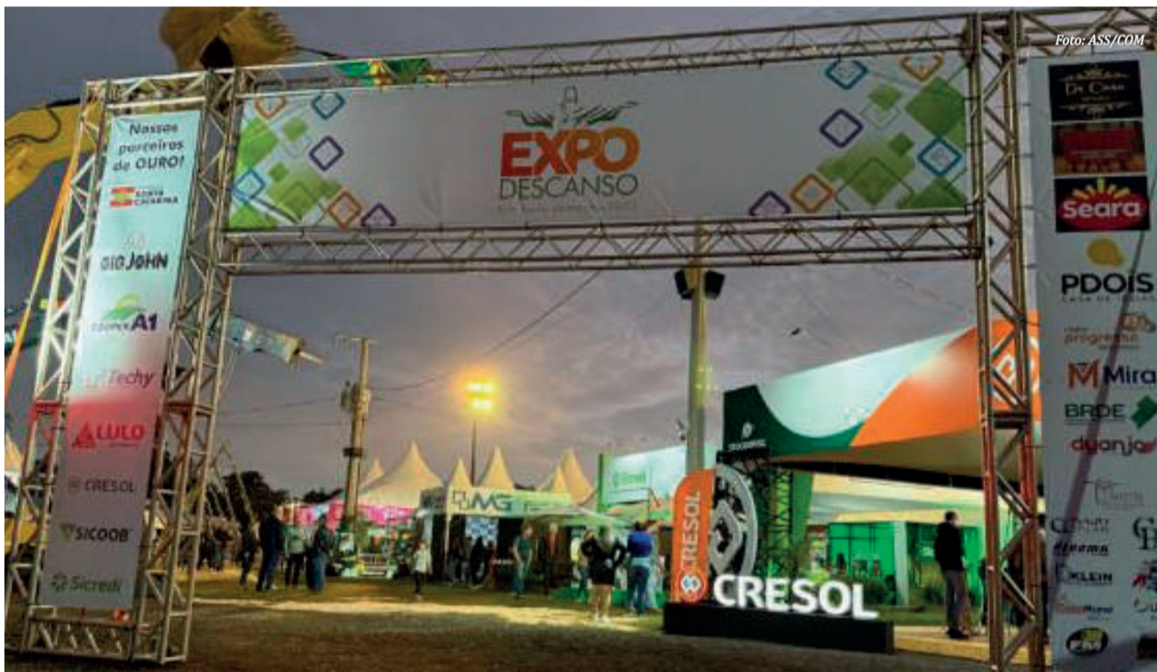
A imponência do Portal de Acesso já indicava a bela estrutura da Feira.