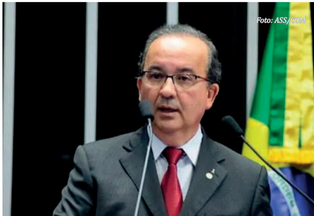
Jorginho Mello - governador de SC

Governador está na região e amanhã inaugura obras e participa da abertura da Expo Descanso