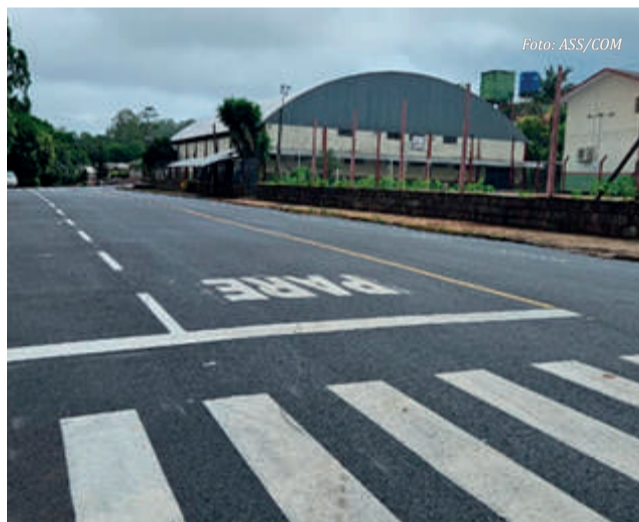
As ruas em torno da EEB Everardo Backheuser foram todas asfaltadas

Já pela parte da manhã, às 11 horas, o governador, nas proximidades da Escola Estadual Everardo Backheuser, ele participará do ato de entrega oficial das obras de pavimentação asfáltica realizadas no entorno do educandário.