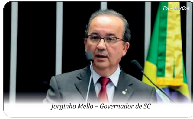
Jorginho Mello - Governador de SC

Prefeito de Descanso confirma a presença do governador de Santa Catarina, Jorginho Mello, na Expo Descanso 2025