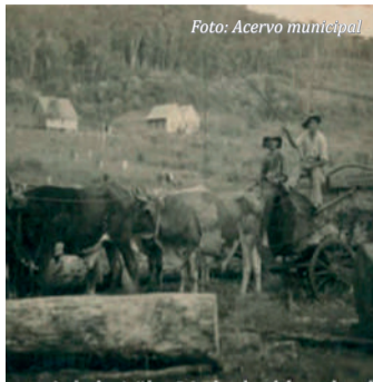
Vista parcial da vila pinhal, década de 1950

Em termos culturais, o município conta com o Instituto Desportivo, Assistencial e Cultural (Indaci), entidade privada fundada em 2003, mas que é responsável por todas as promoções culturais e esportivas da cidade, através de convênio com a prefeitura. O principal evento regional de Iporã do Oeste é a Feira Agropecuária, Industrial e Comercial (Faic), realizada a cada dois anos e promovida pela Associação Comercial e Industrial, em parceria com a prefeitura e demais entidades.