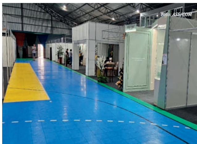
Estruturas dos estandes estão sendo finalizadas.

A Administração considera de grande significado a estada do governador em Descanso, pois, além da inauguração, o mandatário irá visitar e conhecer a estrutura montada no Parque de Exposições para receber a feira.