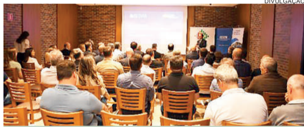
SCGÁS tenciona ampliar presença no estado"

A agenda incluiu reuniões em São Lourenço d'Oeste, onde foram discutidas alternativas para uma rede local baseada em biometano ou GNC; e em Lages, com foco no