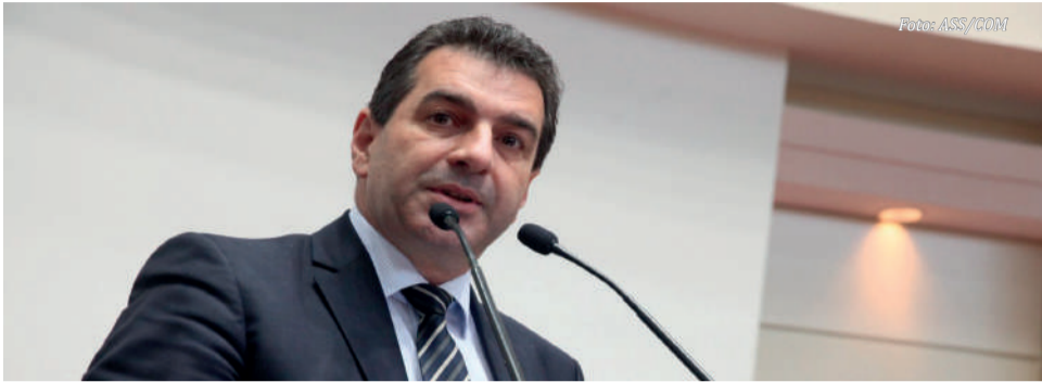
Deputado Valdir Cobalchini

Durante a abertura da Faismo 2025, nesta quarta-feira (19), em São Miguel do Oeste, o deputado Valdir Cobalchini anunciou a publicação do edital de licitação para obra de concretagem da BR-163. O projeto contempla cerca de 9 quilômetros, entre o município e o posto da Polícia Rodoviária Federal (PRF), em Guaraciaba.