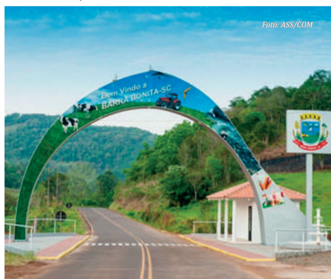
Em 2009, Barra Bonita foi interligada à malha asfáltica do Estado, um antigo sonho da população