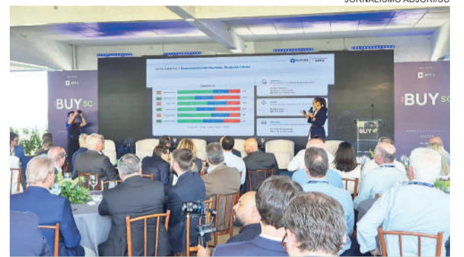
O BUYSC também apresentou cases de empresas catarinenses com atuação relevante no mercado nacional e internacional