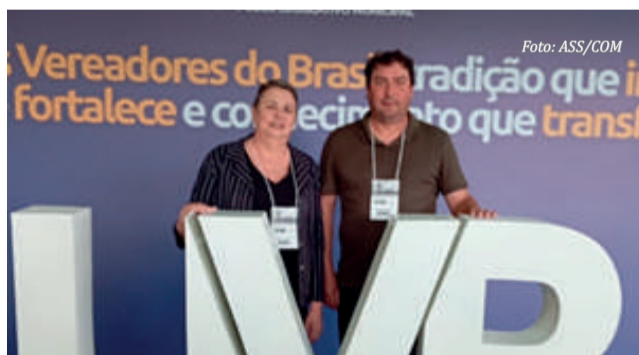
Agenda contemplou ainda a UVB.