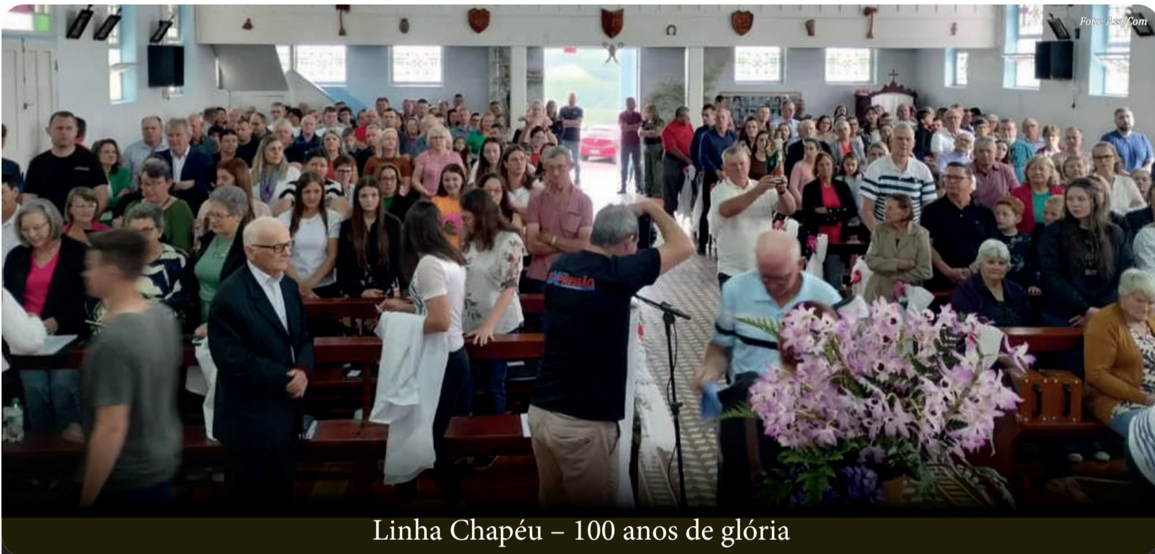
Linha Chapéu – 100 anos de glória

Missa marca início das comemorações pelos 100 anos da comunidade de Linha Chapéu – Itapiranga – SC. Celebração religiosa reuniu fiéis, autoridades e descendentes dos primeiros colonizadores no interior de Itapiranga