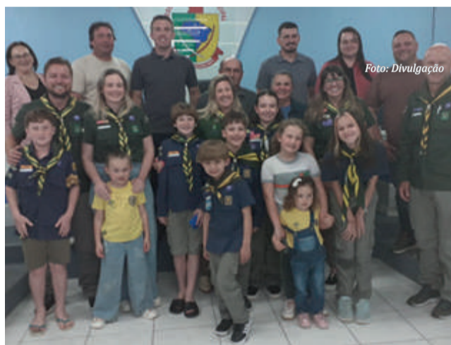
Foto que comemora a conquista histórica

O grupo de escotismo se fez representar na Câmara de Vereadores com a presença da direção, chefes e escoteiros trajados com seus uniformes característicos. Todos os vereadores teceram elogios à organização da entidade e os relevantes serviços que prestam às famílias descansenses.