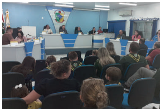
Escoteiros acompanharam a sessão legislativa

O projeto foi aprovado em primeira votação e trata da sessão de uso de um terreno que será fundamental para o Grupo Escoteiro Macaco Branco. Nele, será instalado uma edificação utilizando um container para guardar os materiais usados nas atividades e, futuramente, construir a sede principal.