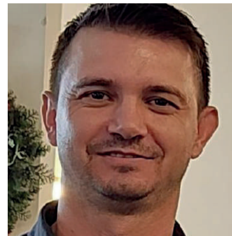
Prefeito Juca: OURO VERDE: A FORÇA QUE REPRESENTA NOSSA TERRA