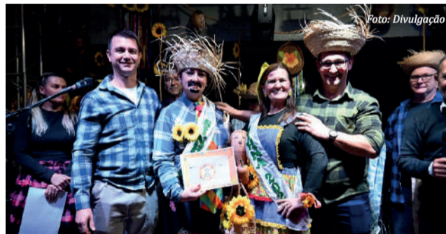
Premiação ao casal caipira

As barracas temáticas, decoradas com capricho e criatividade, ofereceram uma variedade de comidas típicas, bebidas tradicionais e brincadeiras que fizeram a alegria de crianças e adultos. O evento também contou com apresentações de danças folclóricas do CTG Cadeiro do Oeste, do Clube de Mães e Amigas Nossa Senhora Aparecida, do Grupo Escoteiro Macaco Branco, do Ensino Integral Getúlio Vargas, da escola Unicampo e do Grupo Italiano Bella América. Cada equipe recebeu uma música tradicional desta época do ano e pautou sua apresentação na canção. Para manter o espírito colaborativo e harmonioso, todas as equipes foram reconhecidas e premiadas de igual para igual pela sua coragem, esforço, participação e receberam R$ 1.500,00 cada.