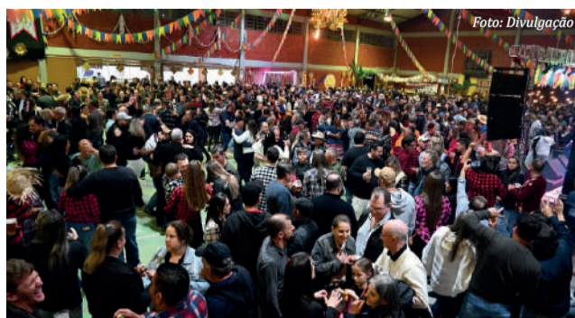
Público lotou o Ginásio Jaroséski