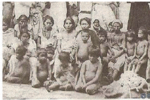
Detalle de una fotografia en la que se observa a mujeres y niños paraguayos en un hospital hacia finales de la Guerra.

• Tudo isso para suceder D. Pedro. Porém, os generais frustraram o intento do Conde, mandando a Família Real para o exílio na França em novembro de 1889.