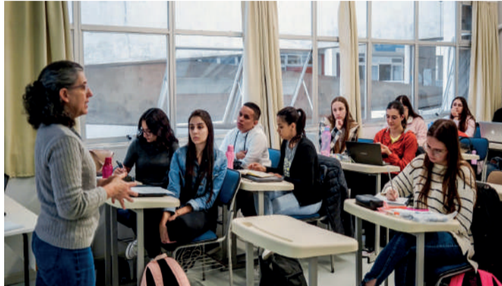
Segundo o TCE, a apuração das denúncias visa garantir que o programa mantenha seu foco original: ampliar o acesso ao ensino superior para estudantes em situação de vulnerabilidade.

dos estão divergências de renda, patrimônio incompatível com o perfil de carência exigido pelos programas e vínculos empregatícios não comprovados. Há ainda registros de beneficiários que não nasceram nem residem em Santa Catarina, descumprindo uma das regras básicas para adesão aos programas.