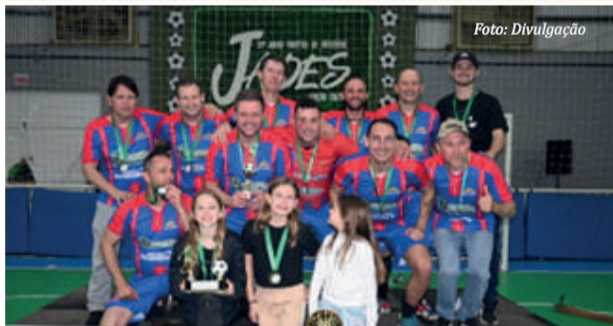
E.C. Alvorada, no Veteranos