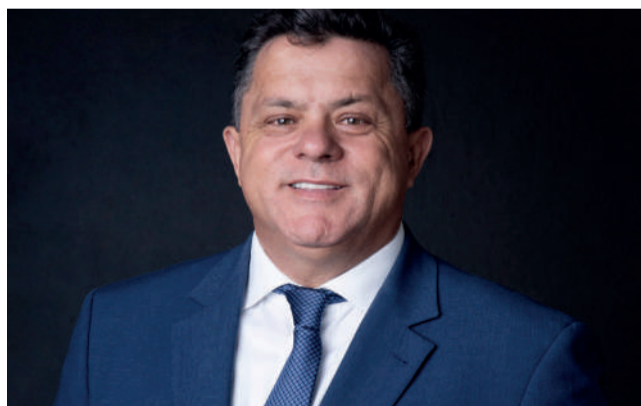
Ivan Naatz, advogado e deputado estadual

No contexto geral, são contribuições em parceria para que aconteça uma valorização, integração e uma paridade cada vez maior entre a categoria que milita nos grandes centros metropolitanos com os profissionais das mais diversas regiões catarinenses em torno da construção de soluções concretas para os desafios permanentes da advocacia e de sua boa interlocação com o Judiciário e a sociedade em geral. Afinal, os advogados são os profissionais que sustentam a presença do direito em todos os recantos onde ele é mais necessário – e, muitas vezes, mais negligenciado.