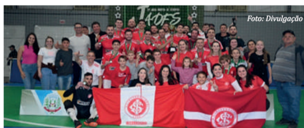
EC. Internacional de São Valentim, no Adulto