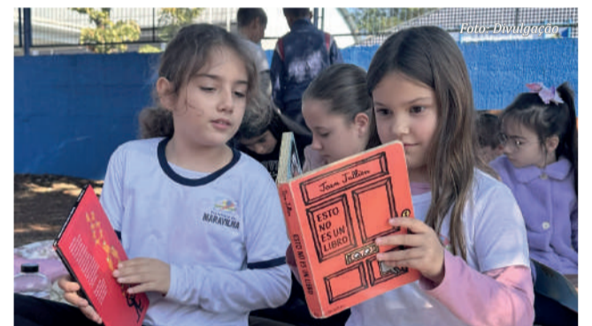
O objetivo da BiblioBike é a promoção do acesso à literatura infantil por meio de ações lúdicas e inclusivas