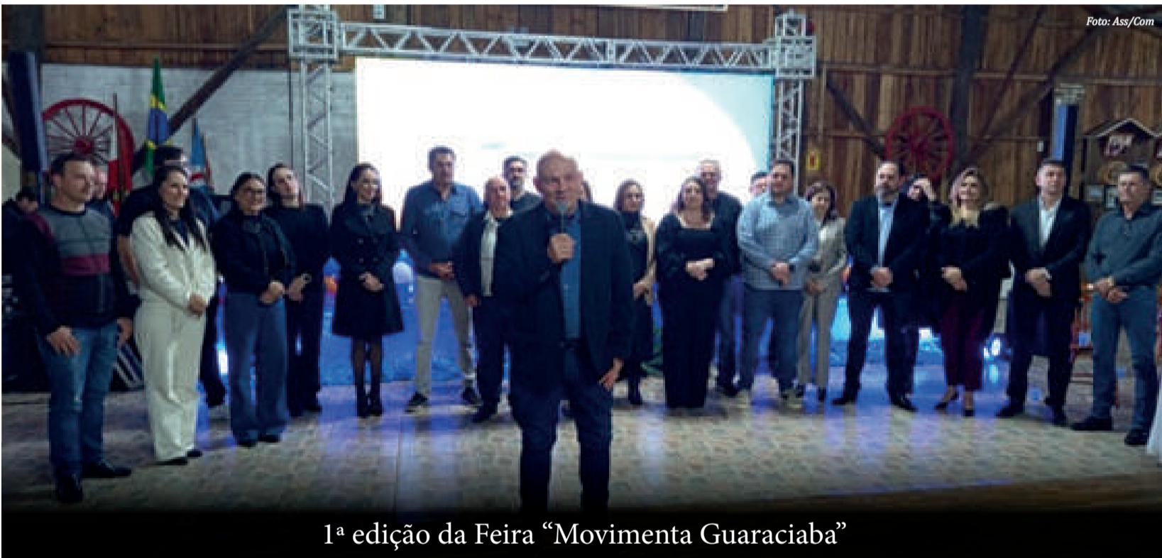
1ª edição da Feira "Movimenta Guaraciaba"

A Administração Municipal de Guaraciaba, em parceria com a Comissão Central Organizadora (CCO), lançou oficialmente na noite desta quinta-feira (24) a 1ª edição da Feira Movimenta Guaraciaba