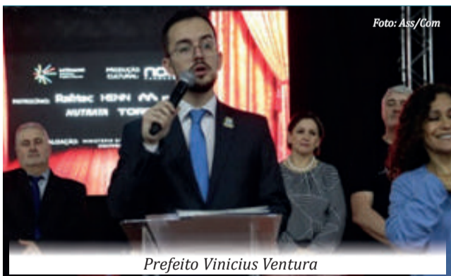
Prefeito Vinicius Ventura

Homenagens e apresentações culturais marcam os 67 anos de Maravilha