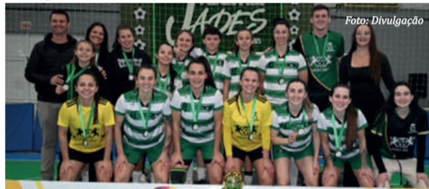
King's Ball, no feminino

A tarde fria e chuvosa de sábado, dia 26 de outubro, não tirou o brilho e as emoções, nem tampouco o calor das disputas das finais dos JADES-2025, na modalidade de futsal. Os jogos foram realizados no Ginásio Municipal de Esportes. Confira, a seguir, as equipes campeãs da edição deste ano: