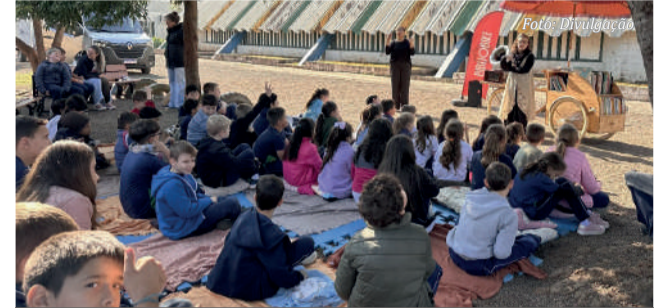
Projeto contemplou quatro apresentações gratuitas, voltadas para crianças de 7 a 10 anos da rede municipal de ensino

Você pode acompanhar as ações e projetos pelo Instagram @bibliobike e no Canal Youtube.com/BiblioBike.