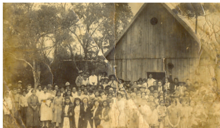
Festa do padroeiro São João em Separação, em meados do século passado