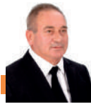
Por: Euclides Staub

A partir de 2024, o fórum dos Brics será composto por onze países emergentes. O nome Brics é um acrônimo formado pela primeira letra do nome (em inglês) de cada um dos países que integram o grupo. São eles: Brasi, Rússia, Índia, China e África do Sul. Além dos cinco membros originais, seis novos países emergentes foram aprovados para fazer parte dos Brics a partir de 2024: Argentina, Arábia Saudita, Egito, Emirados Árabes Unidos, Etiópia e Irã.