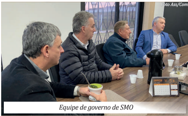
Equipe de governo de SMO

São Miguel do Oeste será contemplada com 12 km de asfalto no interior pelo programa Estrada Boa Rural do Governo do Estado