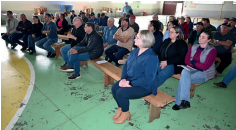
Público participou atentamente do PPA

A Administração Municipal de Descanso iniciou, nesta semana, um ciclo de reuniões visando a elaboração do Plano Plurianual (PPA), o Fala Descanso.