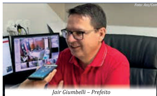
Jair Giumbelli - Prefeito

Administração Municipal de Belmonte realizou o primeiro encontro do Programa "Comunidades em Pauta"