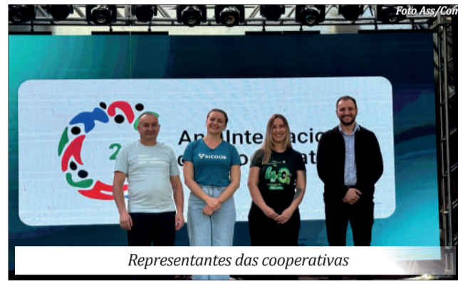
Representantes das cooperativas

Cooperativas celebram o Dia Internacional do Cooperativismo com evento em São Miguel do Oeste