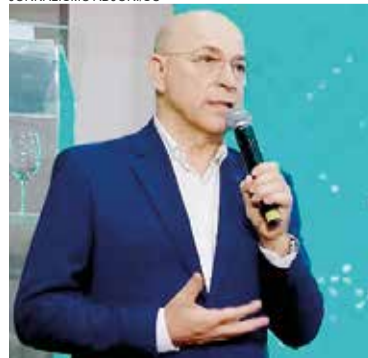
Presidente Vanir Zanatta, presidente da OCESC

vou Vanir Zanatta, presidente da OCESC, durante balanço anual do cooperativismo em SC, apresentado recentemente em Florianópolis. “A expectativa é de alcançar 5,2 milhões de associados em 2025, 5,7 milhões em 2026 e 6,3 milhões em 2027”.