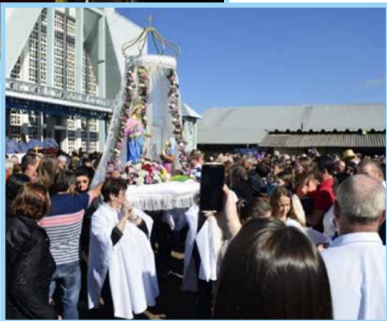
Santuário de N. S. do Caravaggio. BR - 163 - Guaraciaba.

Também, o Santuário de Nossa Senhora de Caravaggio, atrai milhares de fiéis durante a romaria realizada em maio.