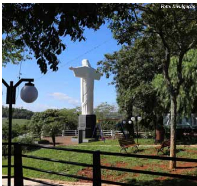
O grande propósito é potencializar o principal cartão postal da cidade