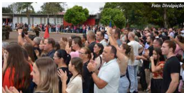
Regimento recebe os aplausos da platéia

Ao final, Coradini agradeceu aos pais pela visita e reforçou a importância da responsabilidade dos soldados na manutenção e conservação dos equipamentos militares, que representam a confiança da população. A cerimônia foi encerrada sob aplausos do público, em reconhecimento às ações do 14º RCMec.