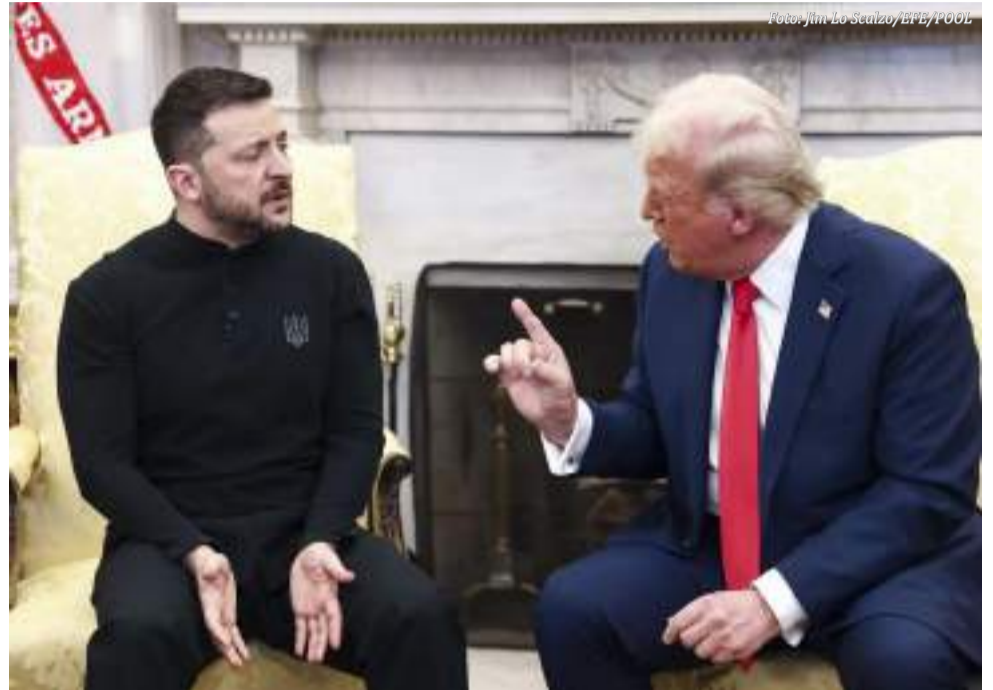
O bate-boca entre Trump e Zelensky, na Casa Branca, sinaliza crise entre EUA e Europa, colocando em risco a parceria transatlântica e a OTAN

Os líderes europeus imediatamente manifestaram apoio a Zelensky. Praticamente todos — com a única exceção da Hungria — reafirmaram seu respaldo incondicional