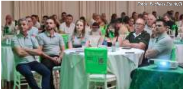
Participantes do evento

rativa demonstra transparência, com clareza e objetividade, permitindo que os associados compreendam a real situação da agência, da cooperativa e do sistema em nível nacional. Nessas ocasiões, é possível fortalecer o relacionamento com os associados, criando afinidade e gerando ainda mais confiança. A explanação sobre a participação nos resultados e o impacto dos programas sociais em cada município também são fundamentais. Além disso, este é um espaço para esclarecer dúvidas, exercer o papel de dono da cooperativa e influenciar nas decisões futuras", explicou Júlio Fernando Zambiasi.