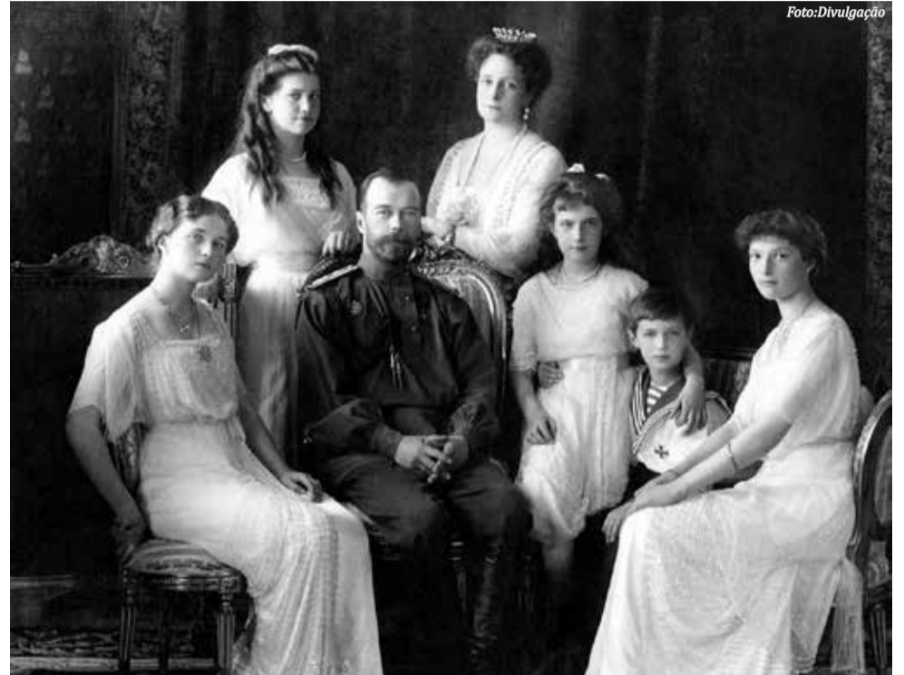
Olga, Maria, Nicolau II, Alexandra, Anastásia, Alexei, e Tatiana. Todos executados pelos comunistas russos.

De acordo com Andrii Yermak, já chega a quase 20 mil o número de crianças e adolescentes sequestradas pelo regime de Vladimir Putin. O processo é conhecido internacionalmente como russificação de territórios. A estratégia utilizada por Moscou consiste em