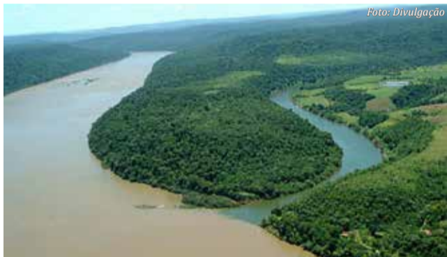
Rio Peperly Guaçú, afluente da margem direita do Rio Uruguai, faz a divisa entre Brasil e Argentina