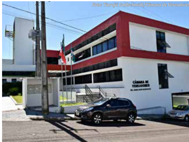
Sessões extraordinárias serão realizadas nessa semana

Também na quarta-feira, às 20h, está marcada a sessão extraordinária para a primeira votação do Projeto de Lei Complementar 01/2025, que promove a revisão geral anual da remuneração dos servidores da Administração Direta e dos servidores do Poder Legislativo do Município de São Miguel do Oeste, e dá outras providências. A segunda votação do projeto está marcada para as 8h30min de quinta-feira (16).