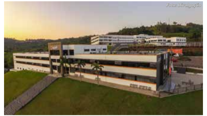
Com uma metodologia robusta, a UCEFF Colégio, vem para trazer autonomia e liderança para a formação dos adolescentes e jovens.