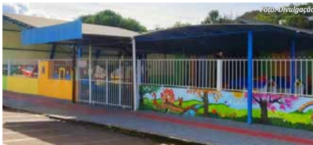
Creche municipal Professora Gracinha

A medida favorece as famílias cujas mães precisam trabalhar fora de casa