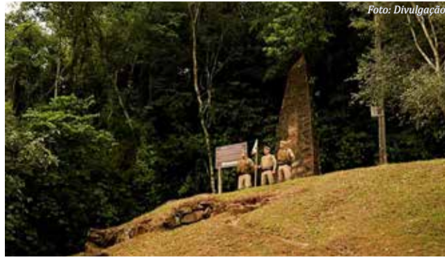
Na sequência a flâmula foi levada até o marco das Três Fronteiras

Além da entrega simbólica da flâmula, a primeira solenidade realizada na segunda-feira (13), em Dionísio Cerqueira, contou com a entrega de novos veículos para a corporação, reforçando a estrutura operacional da unidade: uma Chevrolet Trailblazer com blindagem tipo es-