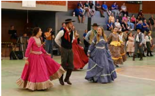
CTG Candeeiros do Oeste -- dança