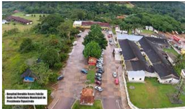
Cidade de Presidente Figueiredo - Am

Estatual chinesa compra empresa que controla mina de estanho na Amazônia.