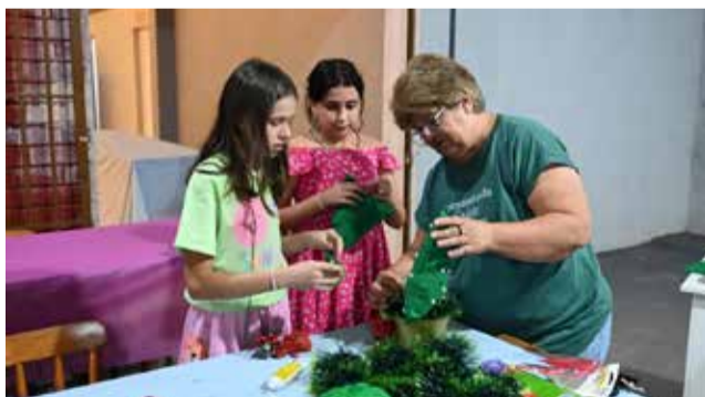
Oficina de artesanato