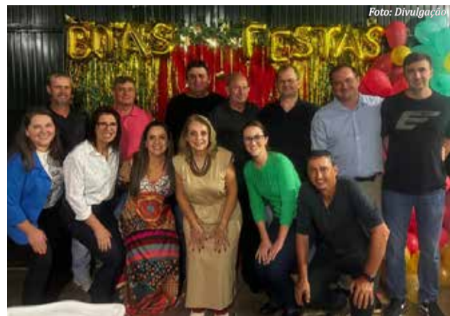
Direção do Hospital

Na noite de sábado, dia 05, a diretoria e os funcionários do Hospital da Fundação Médica de Descanso se reuniram para uma divertida comemoração de final de ano. O objetivo foi comemorar e agradecer os feitos da instituição em 2024.