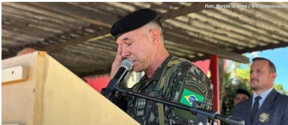
Coronel Albuquerque – Se despede dos Lanceiros

Na manhã de quarta-feira (11), o 14º Regimento de Cavalaria Mecanizado (14º RCMec), em São Miguel do Oeste, realizou a solenidade de passagem de comando. O Coronel André Gustavo Albuquerque da Cunha transmitiu o cargo ao Tenente-Coronel Luiz Fernando Coradini.