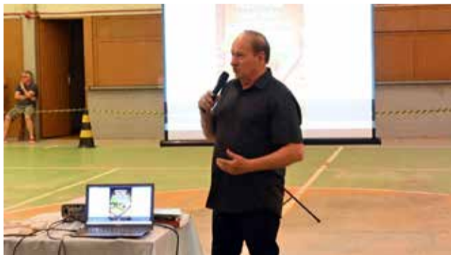
Lotário Staub -- Literatura