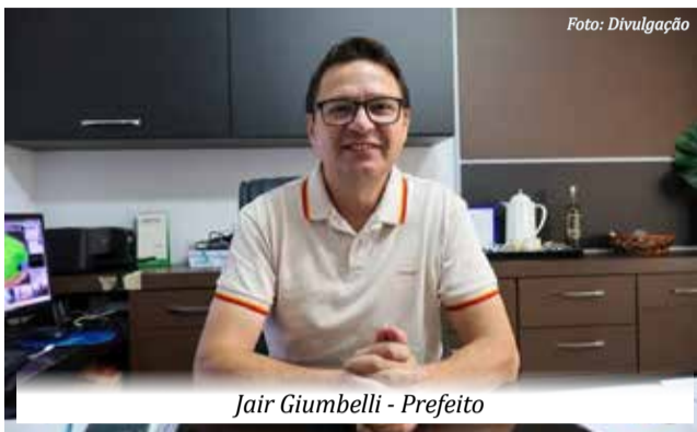
Jair Giumbelli - Prefeito