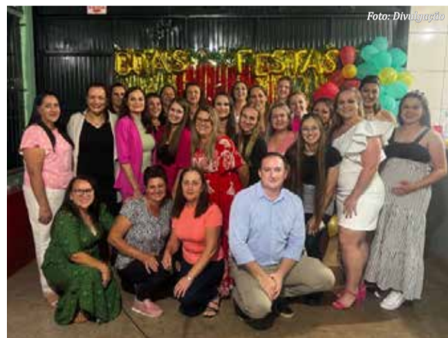
Funcionários do hospital