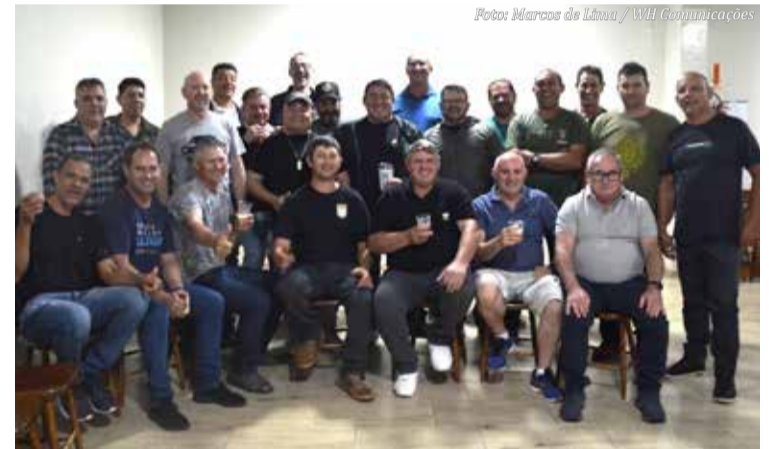
Veteranos do EB realizaram encontro no dia 07 de dezembro de 2024

A troca de comando reflete a continuidade das ações estratégicas do regimento e reafirma seu compromisso com a proteção e desenvolvimento da região.