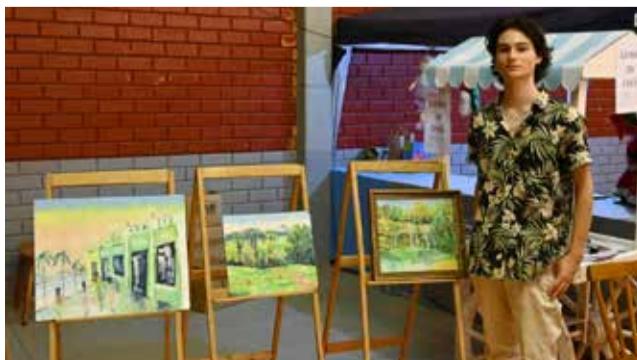
Trabalhos de pintura