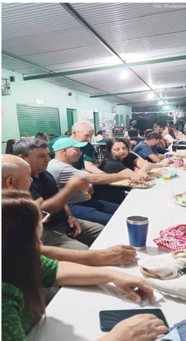
Momento da confraternização