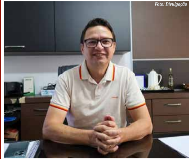
Jair Giumbelli - Prefeito de Belmonte