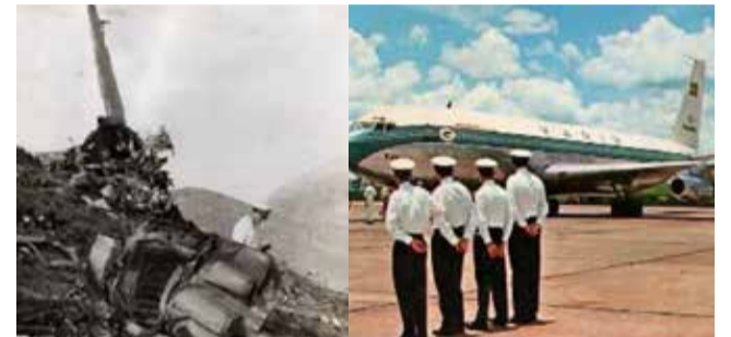
Queda do Boeing 707-441 (prefixo PP-VJB) -, a direita o similar

revolução comunista, via campesina. O coronel do Exército desconfiou das geladeiras, não havia luz elétrica, e ordenou a revista, apreendeu o material e informou ao presidente João Goulart. Goulart devolveu o cargueiro com a carga. Mas o avião caiu no Peru e a preciosa carga cai nas mãos da CIA dos EUA. Resultado: a frota naval americana ancorou no Rio de Janeiro e o emissário Norte Americano avisou ao paraibano, General Humberto Castelo Branco, que não iriam tolerar mais uma república comunista na América.