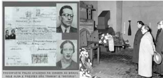
Luís Carlos Prestes (com o chapéu nas mãos) visita memorial de Ravensbrück em 1959, onde Olga ficou presa e foi executada na fofalha

Em 1922, cantaram a internacional comunista no Brasil. Em 1935, Luís Carlos Prestes e Olga Benário vieram para o Brasil para fazer a revolução comunista. Resultado: Prestes preso e a Olga grávida, extraditada para a Alemanha. Onde, após o nascimento da Leocádia, foi executada na fofalha do Adolfo.