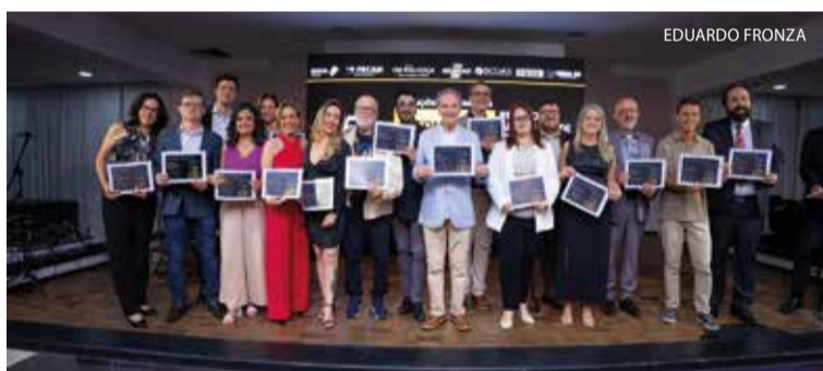
Membros da Comissão Julgadora presentes na cerimônia receberam Menções Honrosas pela valiosa colaboração