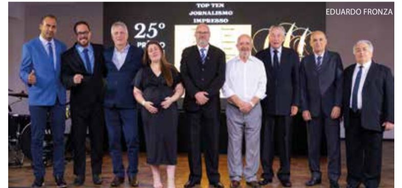
TOP TEN do Jornalismo Impresso: Testo Notícias, de Pomerode (Ouro); Folha Sete, de Seara (Prata); A Semana, de Curitibanos (Bronze); Jornal Metas, de Gaspar; A Gazeta, de São Bento do Sul; Folha Desbravador, de Chapecó; Correio Otaciliense, Otacílio Costa; Folha do Oeste, de São Miguel do Oeste; Parole, de Apiúna e Correio do Norte, de Canoinhas