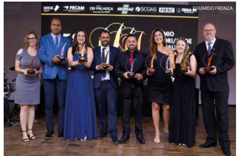
Ganhadores de Penas de Ouro, Prata e Bronze nas categorias Jornalismo Impresso, Jornalismo On-line e Publicidade