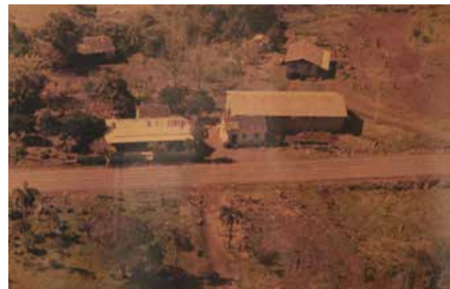
Cenário atual do Hotel Floresta no antigo Km 40, em São Valentim, hoje SC 163, local de muitos desaparecimentos misteriosos