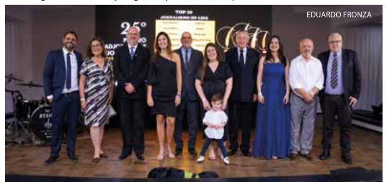
TOP TEN do Jornalismo On-line: Visor Notícias, de Itapema (Ouro); Jornal Metas, de Gaspar (Prata); Testo Notícias, de Pomerode (Bronze); Folha do Oeste, de São Miguel do Oeste; Folha Regional, de Tubarão; Folha Desbravador, de Chapecó; Imagem da Ilha, de Florianópolis; Correio do Norte, de Canoinhas; A Semana, de Curitibanos; Jornal dos Condomínios, de Florianópolis; Destaque Regional, de São Lourenço do Oeste e; Correio Otaciliense, de Otacílio Costa