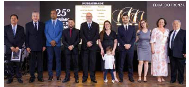
TOP TEN da Publicidade: Testo Notícias, de Pomerode (Ouro); Jornal Rota Notícias, de Otacílio Costa (Prata); Jornal Metas, de Gaspar (Bronze); Correio do Norte, de Canoinhas; A Semana, de Curitibanos; Volta Grande, de Jacinto Machado; Correio Otaciliense, de Otacílio Costa; Folha Sete, de Seara; Folha do Oeste, de São Miguel do Oeste; Cabeço Negro, de Apiúna; Parole, de Apiúna