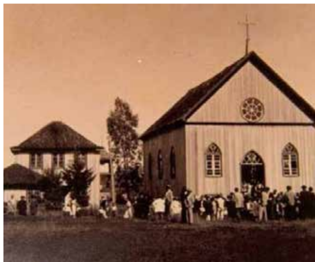
Primeira igreja Católica.