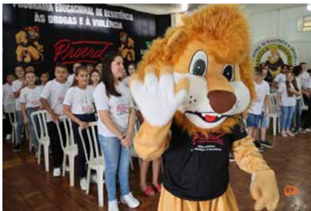
Mascote do PROERD animou a formatura

A solenidade, promovida pela Polícia Militar, ocorreu no Clube SAD