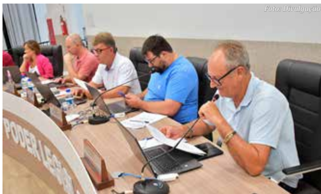
Vereadores aprovaram projetos de lei na sessão desta terça-feira