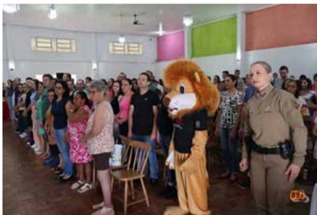
Muita concentração para o Hino do PROERD

Autoridades do Poder Executivo, diretores de escolas, professores e familiares participaram, na manhã de ontem, quarta-feira, de mais uma formatura do PROERD. Esta já é a sexta turma e formou 98 estudantes neste ano. O Proerd é realizado há 23 anos, em Descanso e ao longo de duas décadas, já formou 3.073 estudantes das redes municipal, estadual e particular de ensino.