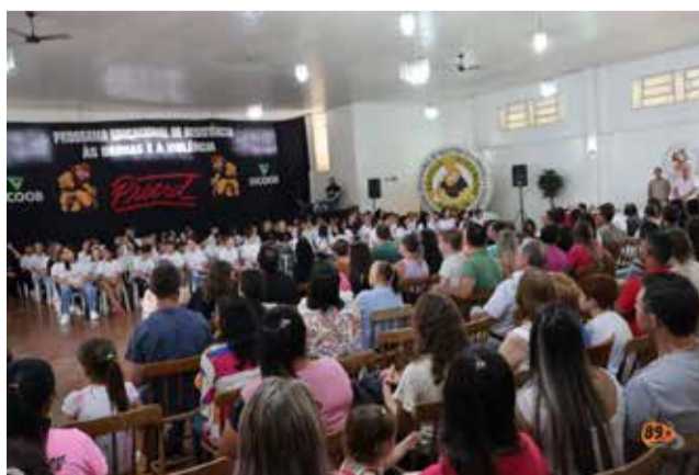
Alunos, pais e autoridades lotaram o clube SAD

O sargento salienta que para isso, a consciência é fundamental: "O trabalho inicial vem da própria família, que é a responsável pela educação das crianças, mas a escola tem um papel fundamental na conscientização dos alunos para que eles conheçam os males que as drogas e a violência representam para suas vidas". (Fonte Rádio Progresso).