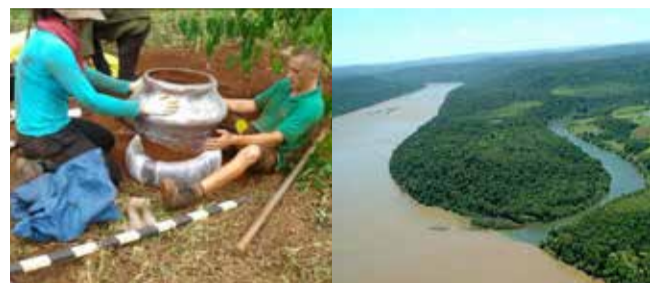
Urna foi encontrada próximo a tríplice fronteira: Santa Catarina, Rio Grande do Sul e República da Argentina