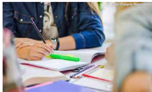
Estudantes têm nova oportunidade para se inscrever no Programa Universidade Gratuita

Por fim, do dia 19 de outubro até 31 de dezembro, o sistema estará aberto para consultas, assinaturas de