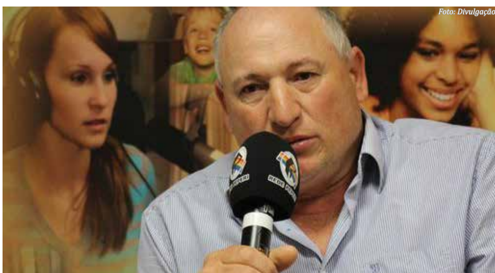
Gilberto Belegante vence eleição e é o novo prefeito de Paraíso