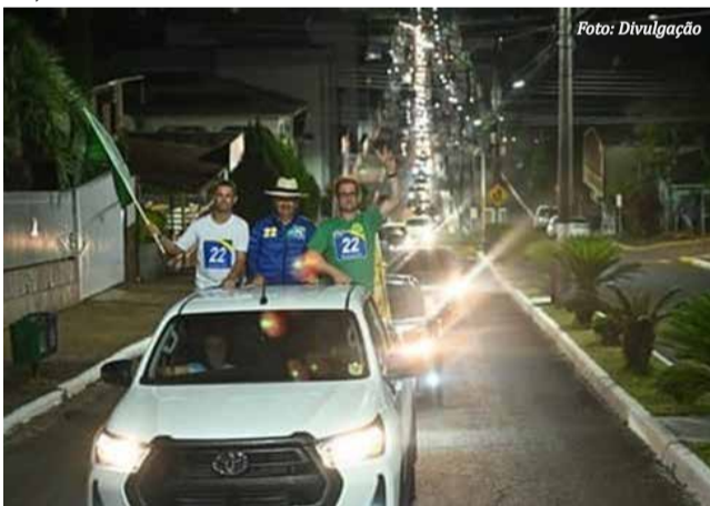
A gigantesca "carreata" com a presença do governador do estado deu os primeiros indícios claros da vitória nas urnas

Juca e Baldo derrotaram nas urnas, os candidatos Nei e Frigo, da Coligação "Continuar e Avançar" - PP / PT / PC do B e PV, que obtiveram 2.708 votos, equivalentes a 45,03% dos votos válidos.