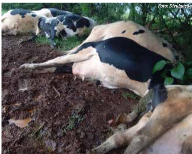
Texto: Diógenes Di Domenico

A família estima um prejuízo de R$ 70 mil com a morte das sete vacas holandesas que produziam cerca de quatro mil litros mês.