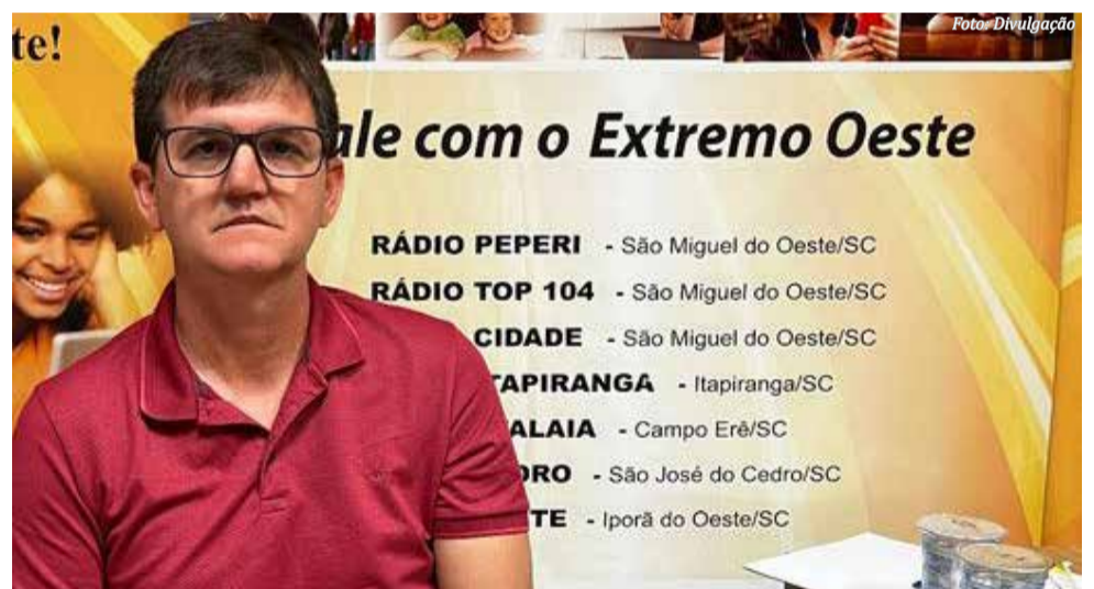
Eder Marcon é eleito prefeito de Bandeirante