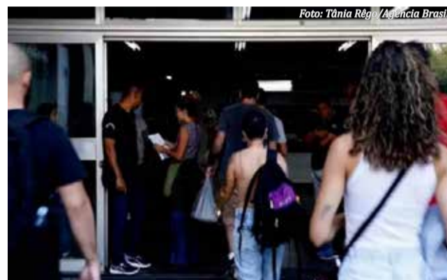
Provas aconteceram em agosto

O Ministério da Gestão confirmou a ocorrência na época, mas informou que "a situação foi corrigida imediatamente" e "não afetou a aplicação nem o sigilo das informações". À Justiça, a União também negou vazamento de conteúdo, dizendo que os cadernos teriam sido recolhidos antes da autorização para o início das provas.