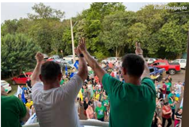
Momento em que a apreensão deu lugar ao início das comemorações.