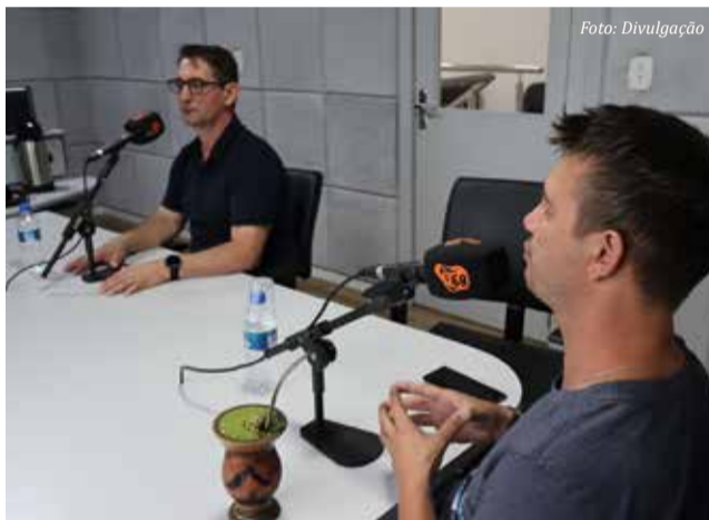
A primeira ação dos eleitos, no dia seguinte à eleição, foi avaliar o sucesso nas urnas na Rádio Progresso