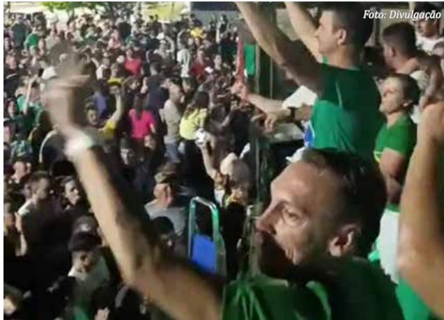
Multidão se reuniu para as comemorações da vitória.