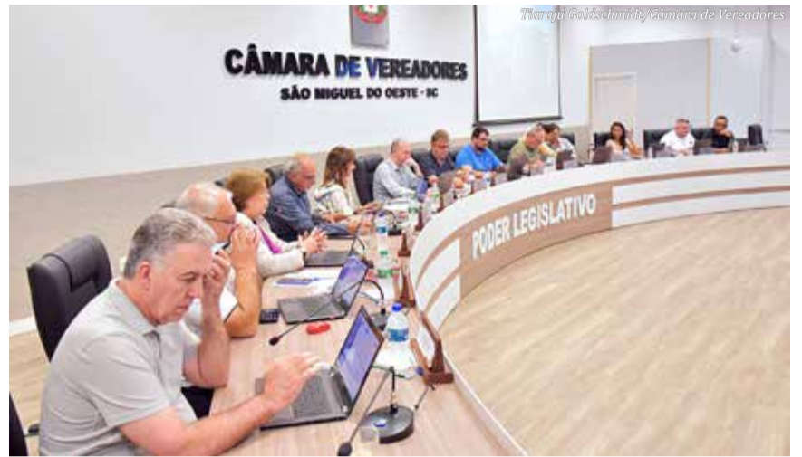
Vereadores aprovaram projetos em primeiro turno, em votação única.

As dotações orçamentárias a serem reforçadas são o Fundo Municipal de Habitação, Divisão de Contabilidade e Urbanismo. Já os recursos serão reduzidos parcialmente dos se-