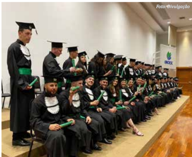
Grupo de formandos do CEDUP-GV

O Centro de Educação Profissional Getúlio Vargas – CEDUP-GV realizou na noite de sábado, dia 31, a formatura de 54 alunos do curso Técnico em Agropecuária. A solenidade aconteceu no Auditório da UNOESC com a colação de grau dos formandos.