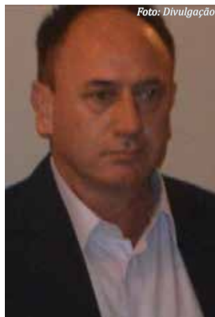
Por José Raul Staub - Professor e Escritor

Em celebração ao bicentenário da imigração alemã no Brasil