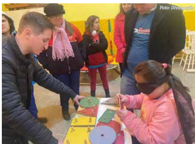
Atividades lúdicas ilustraram a programação

A intensa comemoração foi encerrada no dia 28, quando foram entregues balões laranjas com mensagens de inclusão no centro da cidade nos comércios e órgãos públicos para chamar a atenção da população.