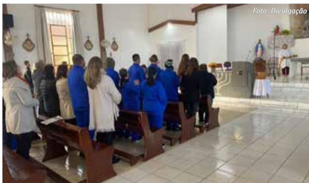
Missa especial coroou a programação

Por outro lado, um dos momentos mais marcantes durante o mês foi a realização da missa no domingo dia 25, na igreja matriz de Descanso, com a participação das famílias, alunos, profissionais e comunidade em geral que se emocionaram com a celebração.