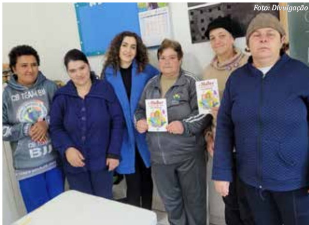
Atividades em alusão ao Agosto Laranja, também foram realizadas

Deu-se continuidade na gincana interna com os alunos, profissionais e a participação dos parceiros da insti-