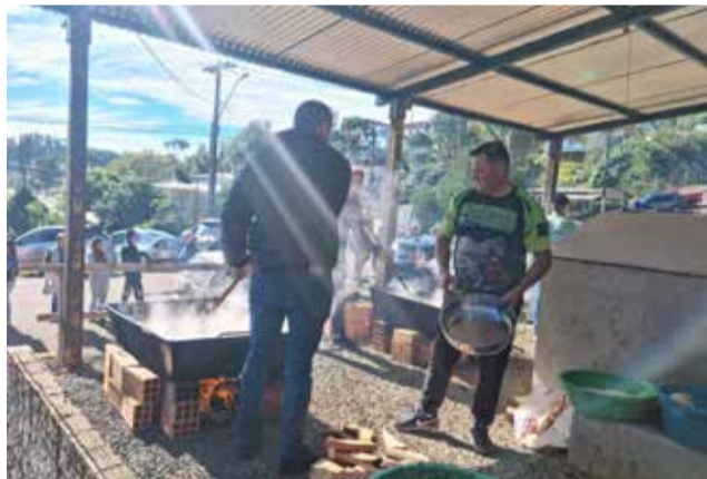
Risoto no tacho iniciou cedo pela manhã.