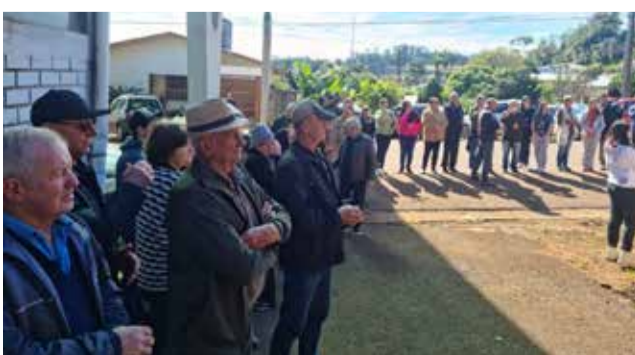
Oração marcou o início da distribuição.