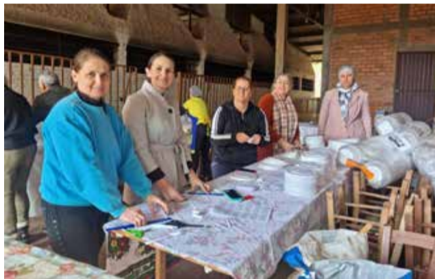
Preparo das marmitas

Foram comercializadas aproximadamente 500 porções, com uma arrecadação de cerca de R$ 10.000,00 que serão transformados em doações para o RS. Confira alguns registros da promoção: