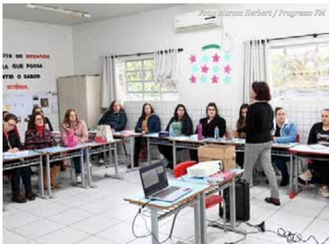
O curso aconteceu na Escola Paulo Henrique Pissaia