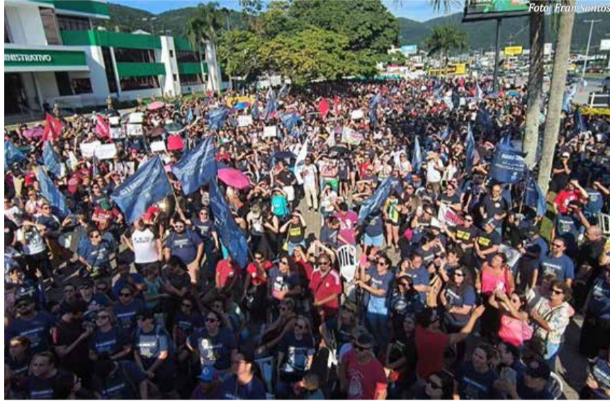
Ato de professores em Santa Catarina

Os R$ 230 milhões serão distribuídos proporcionalmente em todos os níveis de carreira, com a previsão de iniciar o novo sistema de valori-