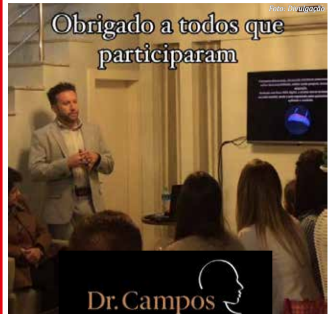
São Miguel do Oeste

Na última sexta-feira (28), a Clínica Dr Campos promoveu o 1º WorkShop em reabilitações com Zircônias.