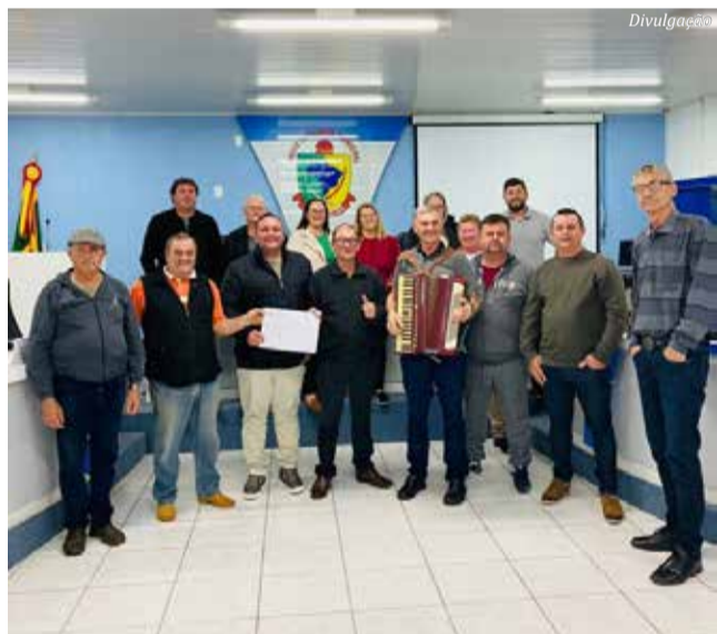
Pose solene da entrega da Homenagem