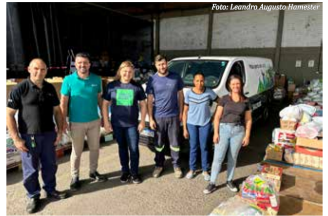
Voluntários recebem os materiais e organizam todas as doações em kits, os quais são direcionados às famílias conforme suas necessidades específicas.