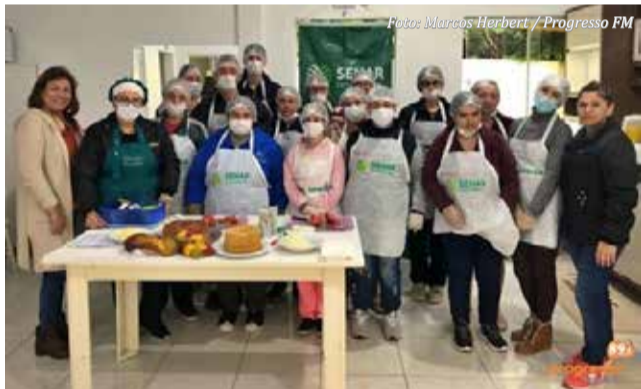
Direção e alunos da APAE que participaram do curso

A APAE de Descanso realizou nesta segunda, 24, e terça-feira, 25, uma atividade especial em parceria com o Serviço Nacional de Aprendizagem Rural (Senar) e com o Sindicato dos Trabalhadores Rurais de São Miguel do Oeste.