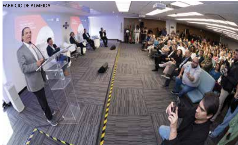
Marcelo Freixo, da Embratur, no evento em Blumenau (20/6), e Décio Lima, do Sebrae, no encontro em Florianópolis (21/6)

Blumenau e Florianópolis foram palco de encontros de lideranças nacionais com o setor turístico de Santa Catarina, nos dias 20 e 21 deste mês. Os eventos foram promovidos pelo Sebrae, Embratur e Ministério do Turismo com o objetivo de potencializar o desenvolvimento desse segmento no Estado e no país, especialmente os formados por pequenos empreendimentos.