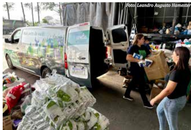
Donativos estão sendo repassados ao Sistema Ocergs, que conta com centro de distribuição na cidade de Canoas, na região metropolitana

"Agradecemos a todos os envolvidos e todos que têm doado, multiplicando a solidariedade. Aqui no centro de distribuição recebemos os donativos, separamos, organizamos e levamos até as pessoas que fizeram suas solicitações. Tudo isso só é possível graças ao voluntariado da comunidade que está doando. Precisamos continuar com essa corrente do bem, que faz toda a diferença para que a gente multiplique esta rede de cooperação, impactando muitas vidas", agradece, visivelmente emocionada, a coordenadora de Ensino