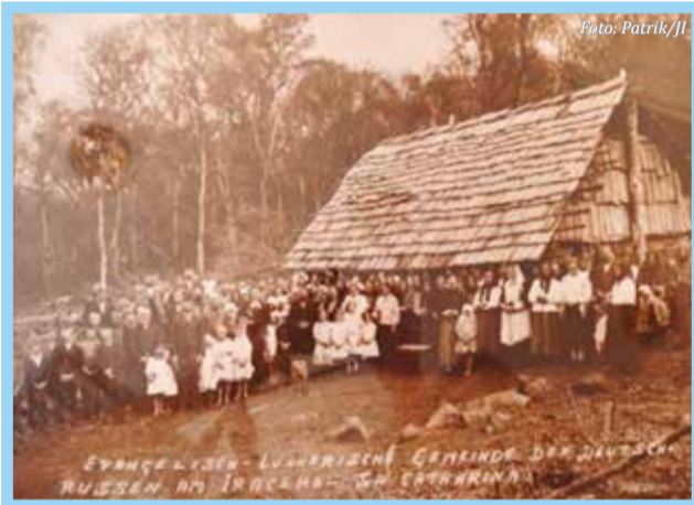
Russos que conseguiram fugir das malvadezas do comunismo, encontraram a paz duradoura em Santa Catarina

Terra do canto e da música, da saúde e da educação, da crença religiosa e da diversidade étnico-racial, do futebol e do kerbfest. Terra de riquezas para todos.