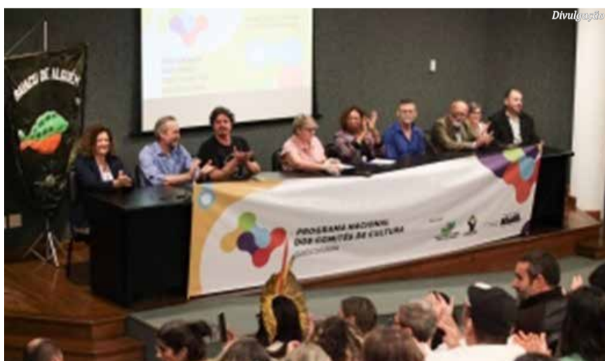
Evento foi realizado no Plenarinho Deputado Paulo Stuart Wright, na noite desta segunda (10)