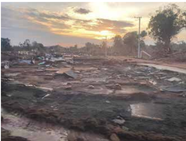
A bela paisagem dos céus contrasta com a devastação na terra.

Segundo ela, muitas pessoas do município perderam suas vidas devido aos desastres. As enchentes e deslizamentos pegaram muitas famílias de surpresa, resultando em mortes e desaparecimentos.