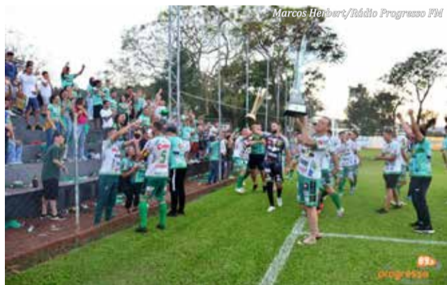
Jogadores comemoraram junto a torcida