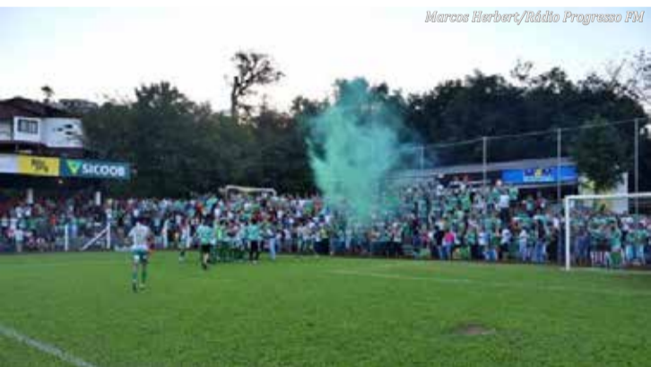
Público lotou o estádio da Montanha.