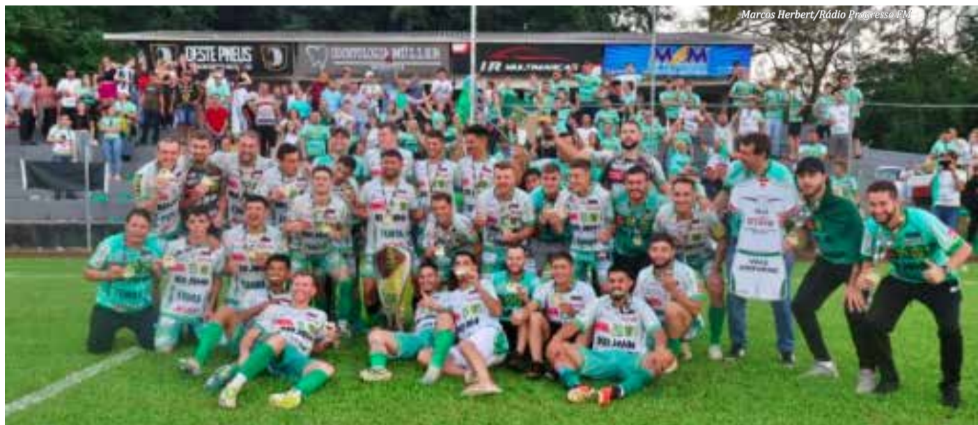
Pose para a História