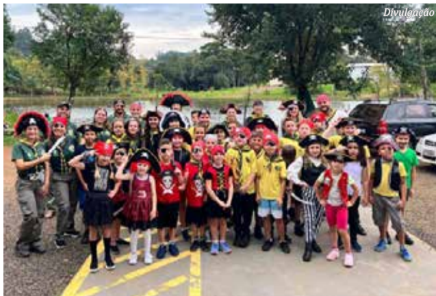
A turma participou caracterizada