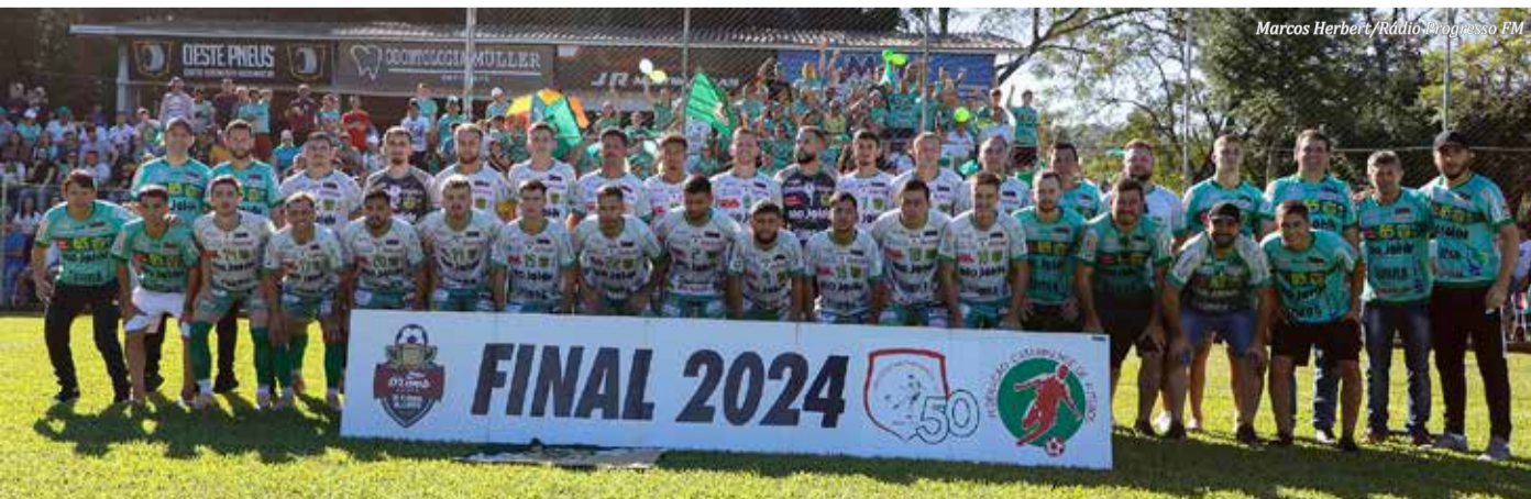
Público lotou o estádio da Montanha.