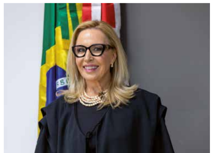
A desembargadora é primeira mulher a presidir o TRE/SC

O governador Jorginho Mello e outras destacadas autoridades dos três Poderes prestigiaram a solenidade.