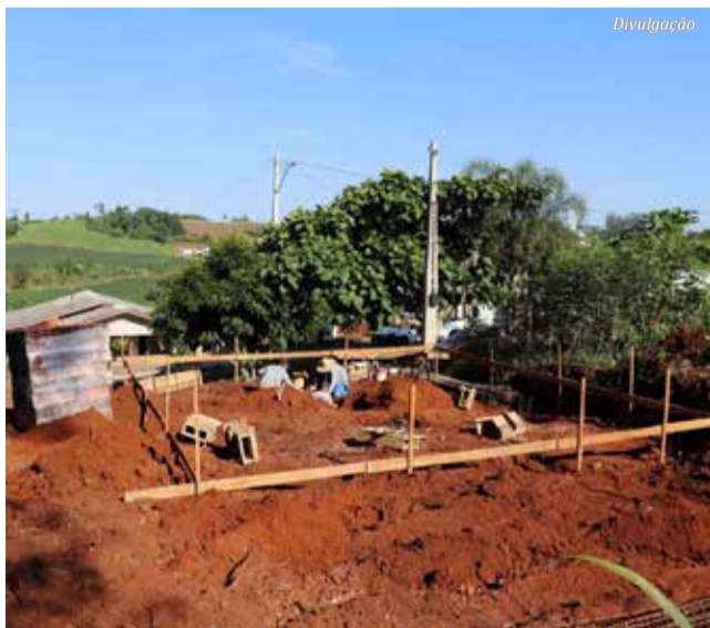
Casas estão em fase inicial de construção

As casas estão sendo construídas em terrenos públicos no bairro Antônio Rech e na Área Industrial, com previsão de conclusão e entrega até novembro deste ano, conforme o contrato estabelecido com a empresa vencedora da licitação.