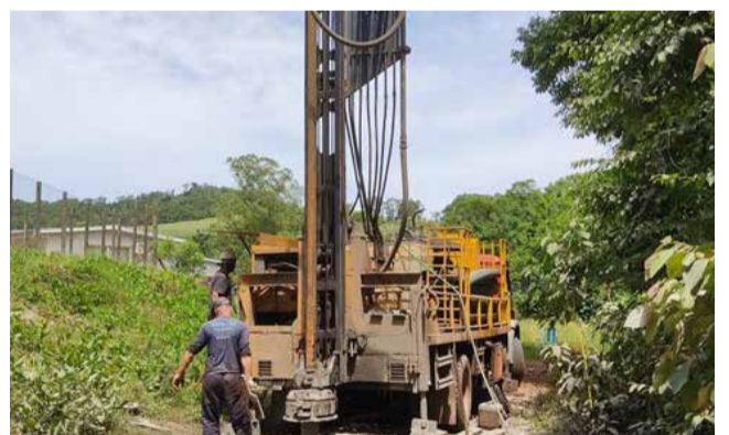
Poço artesiano foi perfurado nas cercanias da escola

• SOMBRA POR QUE TE QUERO: Estamos entrando no outono, mas as características do verão intenso insistem em permanecer ativas. Lembranças que remetem há mais de cinquenta anos, testemunham que nunca vivemos um calor nestas proporções por estas bandas. São novos tempos e é bom irmos nos acostumando. A natureza tem seus próprios regulamentos e muitas coisas não previstas, envolvendo tempo e temperatura, estão por vir.