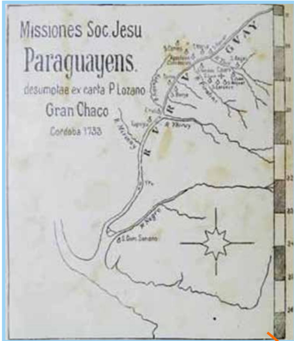
Mapa escoamento da madeira – Os Três Mártires Rio-Grandenses – p. 116

Os pequenos afluentes do Rio Uruguai não possuíam profundidade suficiente para realizar o transporte da madeira a qualquer tempo, fazia-se necessário aguardar a cheia dos rios para que a madeira embalsada pudesse flutuar até São Tomé, na Argentina, onde era comercializada e posteriormente embarcada em navios e exportada, principalmente para a Europa e Ásia. Inclusive, desta madeira foram feitos os dormentes para a construção da Estrada de Ferro Transiberiana, maior ferrovia do planeta. A enchente de 1946 trouxe o vírus do tifo, provocando a desistência de colonos que já haviam adquirido terras da colonizadora.