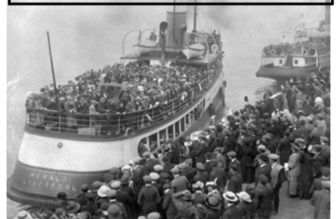
Vapor “La Sofia” partiu do Porto de Gênova na tarde do dia 03 de janeiro de 1874

No dia 21 de fevereiro de 1874, desembarcava no Brasil a primeira leva de italianos. Comemora-se o dia do imigrante italiano.