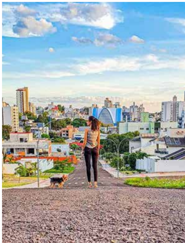
Foto panorâmica de São Miguel do Oeste - SC