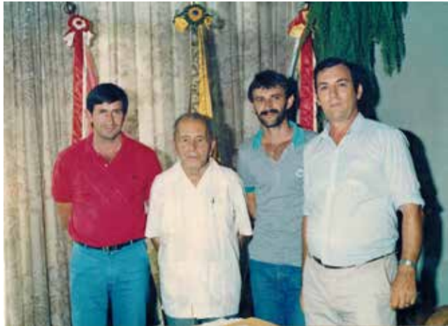
Luíz Carlos Prestes em Descanso