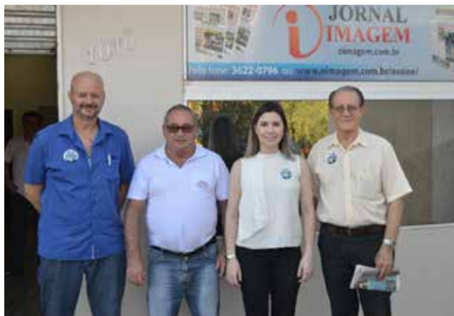
Correligionários do PL visitando o jornal Imagem

O JORNAL IMAGEM foi fundado em 1º outubro de 1999 na cidade de Itapiranga e circulou nas cidades de Itapiranga, São João do Oeste e Tunápolis, sob a direção de Norberto Bauer, até o dia 14 de fevereiro de 2003.