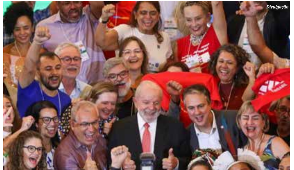
Presidente Lula, que não foi na aula, pediu apoio aos professores para eleições de 2024 durante encerramento da etapa nacional da Conae 2024.

Um membro da Faculdade de Educação da UnB recebeu R$ 13.960,70 para integrar a Comissão de Acolhimento da Conae. Além disso, duas professoras da instituição receberam pagamento no mesmo valor. Outros nove servidores da UnB receberam R$ 8.497,74 por serviços prestados. Foram aproximadamente R$ 477 mil gastos apenas com pagamentos a pessoas físicas. Os dados foram tirados do Portal da Transparência da Finatec, que é uma fundação de apoio da Universidade de Brasília,