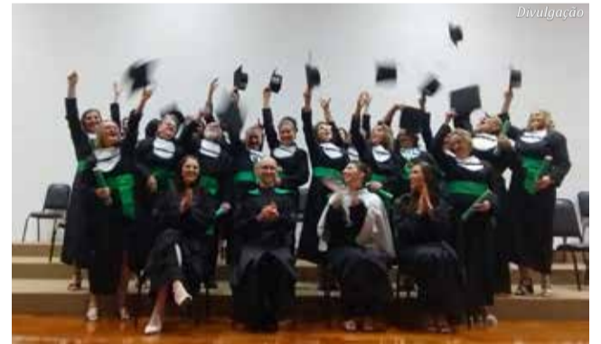
Uniti SMO - Formatura

• Em São José do Cedro: as inscrições estarão abertas a partir de fevereiro e podem ser feitas diretamente na Unoesc, no período vespertino, ou pelo WhatsApp (49) 3643 6000. As prefeituras de São José do Cedro e Guarujá do Sul são parceiras do projeto e disponibilizam transporte gratuito aos participantes.