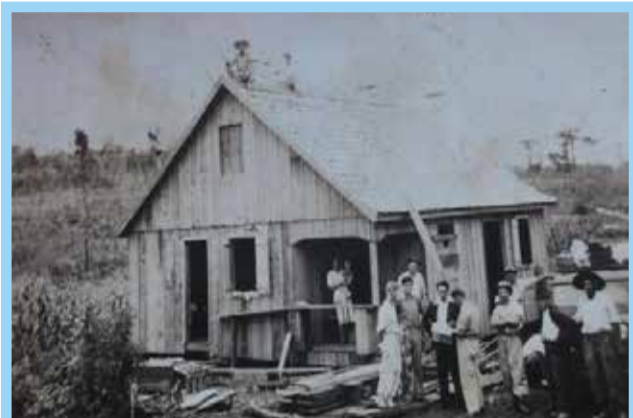
Migrantes constroem moradia em Paraíso, meados do Século XX

O município de Paraíso conseguiu sua emancipação político-administrativa somente em 09 de janeiro de 1992, sendo desmembrado de São Miguel do Oeste juntamente com outros distritos. Mas já na metade do século XX, colonizadores desbravavam o território. Atualmente, conta com cerca de 3.800 habitantes.