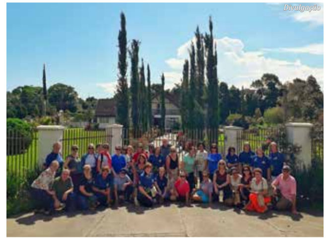
Uniti SMO - Colônia Witmarsum - Palmeira-PR

• Em São Miguel do Oeste as inscrições para a primei-