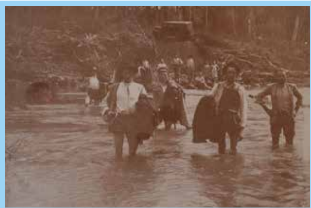
Passagem pelo Rio Peperi-Guaçu no atual Distrito da Grápiá, em 1950