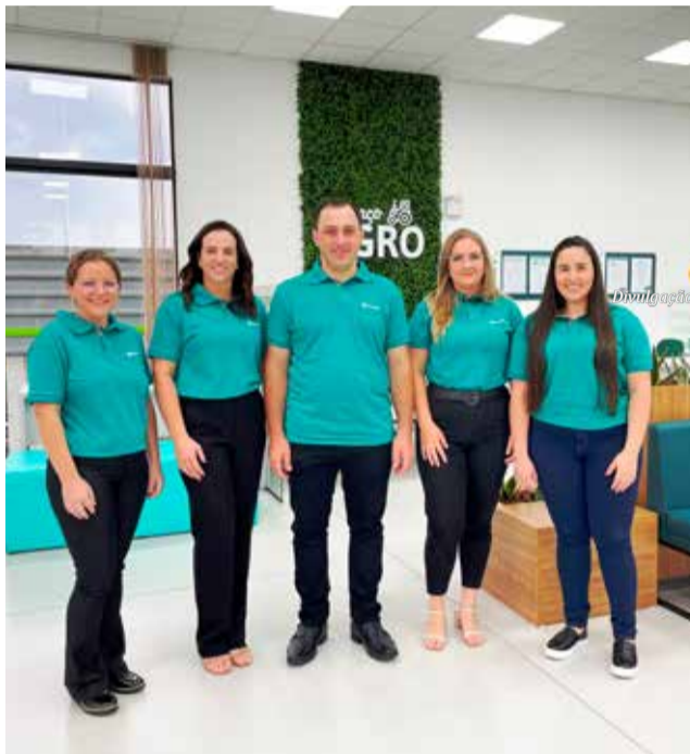
Equipe de funcionários da Agência