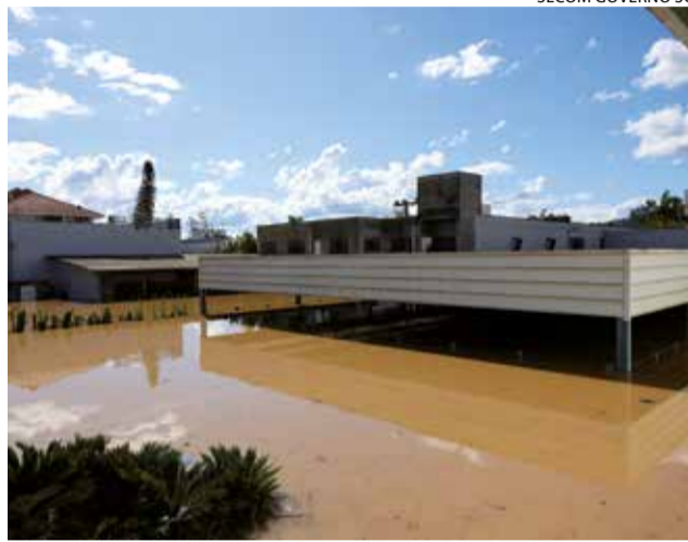
Comércio de Taió fica em baixo de água

“Essa sondagem é mais um instrumento que a Fecomércio utiliza para dar apoio aos empresários dos nossos setores representados e a pesquisa é importante porque conseguimos ter uma amostra fiel de como está a situação”,