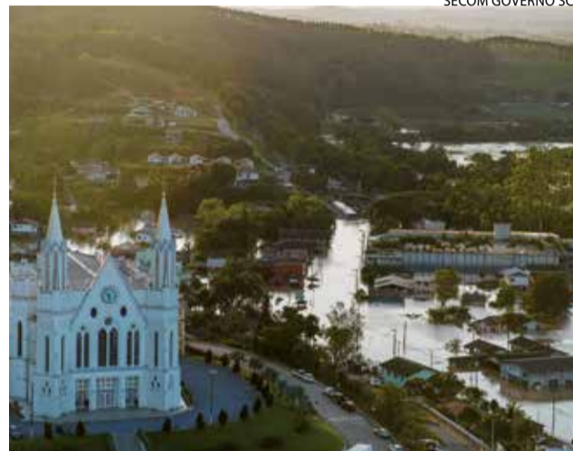
Rio do Sul enfrenta áreas inundadas

de comércio apresentou perdas de 36,4%, o turismo de 35,6% e os serviços mostrou queda idêntica a da média do levantamento, 35,5%. Ainda em termos de faturamento, regionalmente, as perdas