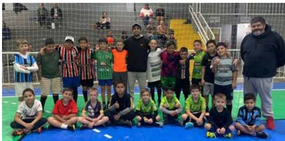
Integrantes da escolinha FRIGO FUTSAL