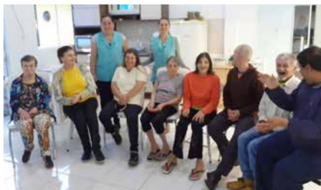
Turma de Serviço de Convivência (com alunos em fase de envelhecimento).

Com a supervisão de duas professoras, os próprios alunos preparam refeições, organizam e limpam os ambientes, arrumam a cama, guardam seus pertences nos armários, lavam roupas, enfim, todas as atividades domésticas de uma casa residencial.