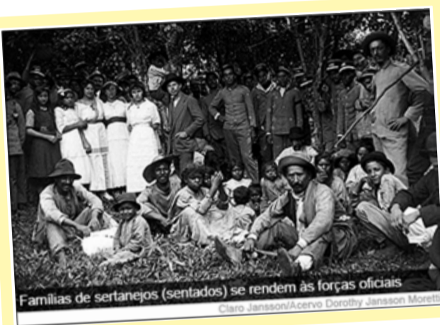
Famílias de sertanejos (sentados) se rendem às forças oficiais