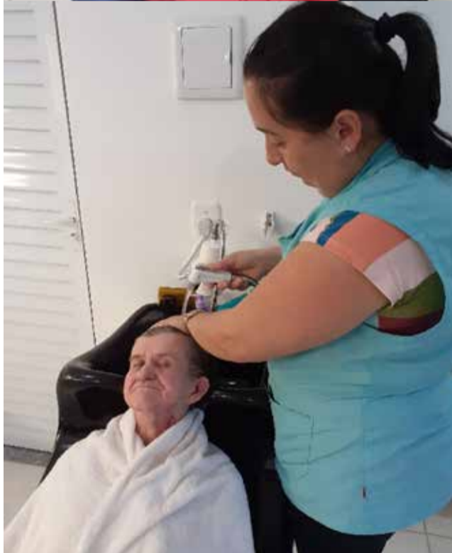
Cuidados estéticos melhoram a autoestima