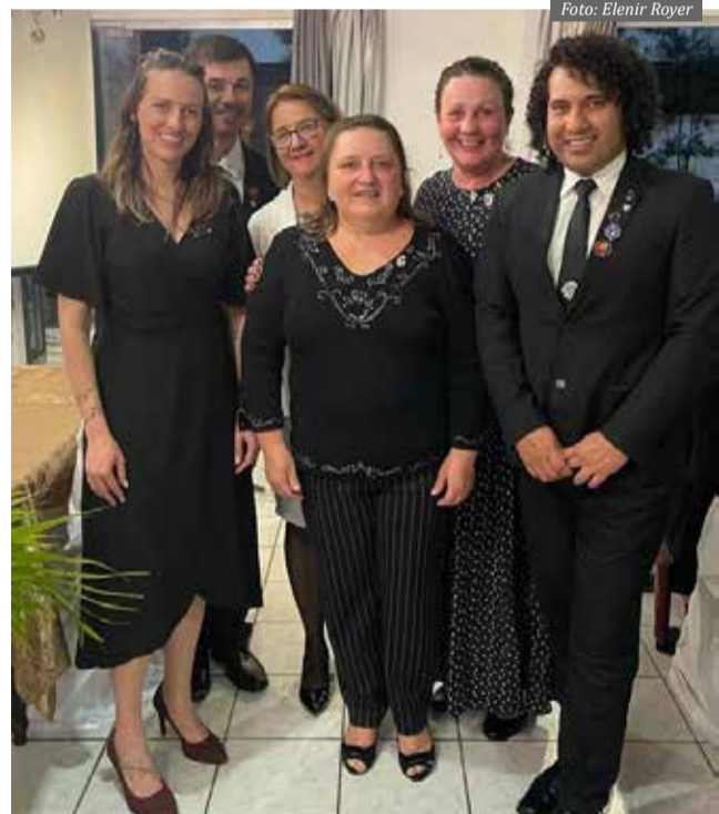
Componentes da nova Diretoria do Lions Clube São Miguel do Oeste Universidade para o ano Leonístico de 2023/2024