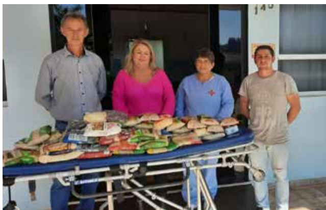
A doação é oriunda dos cartões amarelos e vermelhos durante a realização do Municipal Futebol 7

“Além de ser uma forma de ajudar a entidade, também uma maneira dos atletas refletirem sobre algum lance mais ríspido ou se opor a uma marcação da arbitragem. Todo campeonato ou disputa deve-se valer a diversão, integração e confraternização. Às vezes vale mais o espírito esportivo do que uma vitória”, declarou o prefeito.