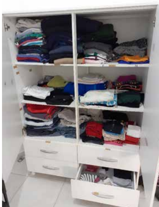
Armário sempre bem arrumado

Segundo a diretora, Adriana Balbinot, a Casa Pedagógica Terapêutica foi construída com o objetivo de se trabalhar o currículo funcional natural. Este currículo busca proporcionar aos educandos situações de aprendizagem