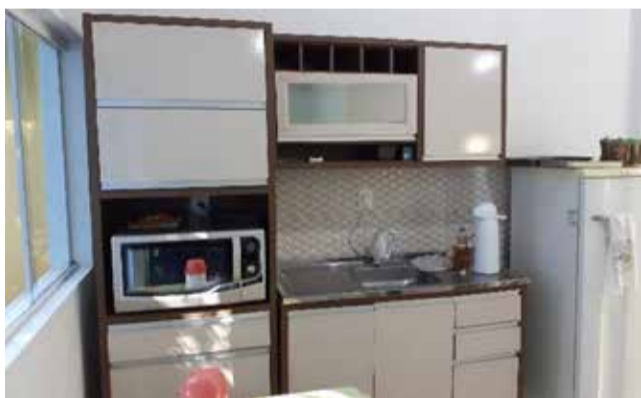
As atividades contam com uma cozinha completa.

Os fortes laços de carinho tornam a Apae de Descanso ser reconhecida pelas famílias como segundo lar dos quase 100 alunos. O conceito se materializa dentro da instituição em uma casa onde crianças, jovens e adultos realizam atividades e aprendem, na prática, a realizar uma série de afazeres do dia a dia como se estivessem em suas casas.