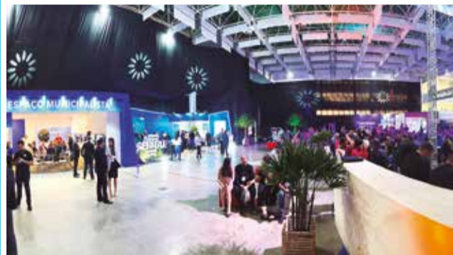
Ambiente favoreceu a troca de experiências

A Federação dos Consórcios, Associações e Municípios de Santa Catarina (Fecam) preparou um ambiente especial para os prefeitos presentes no Summit Cidades, promovido entre os dias 26 e 28 de junho, no Centrosul, em Florianópolis. Com 100 m², o Espaço Municipalista contou com área de palestras, estúdio de gravação e sala de reuniões, tudo para promover a conexão e troca de experiência entre os gestores municipais. O Summit Cidades consagrou-se como o maior evento sobre cidades inteligentes de Santa Catarina, tendo por objetivo capacitar seus participantes e potencializar o desenvolvimento de cidades mais inteligentes, sustentáveis e dinâmicas.