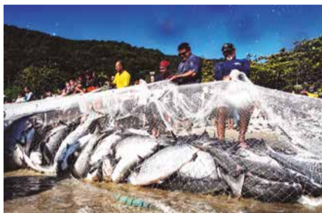
Foram frustradas as estimativas de pesca de 1.800 t no total

O Governo de Santa Catarina continua tentando reverter à medida do Governo federal que reduziu a cota de pesca artesanal de tainha pelo modelo emalhe anilhado. Esse tipo de pesca - rede jogada no mar na forma de círculo, praticada tipicamente pelos pescadores artesanais - teve a cota reduzida de 830 toneladas para 460 toneladas. Um corte de 68% nessa produção pesqueira. A pesca industrial, autorizada em 600 toneladas em portaria de 2022, foi simplesmente banida neste ano. “No auge da pesca da tainha, da safra de 2023, recebemos a