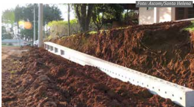
Investimento, com exceção do calçamento, supera os R$ 230 mil

Após as obras, Campagnaro fala que o loteador poderá