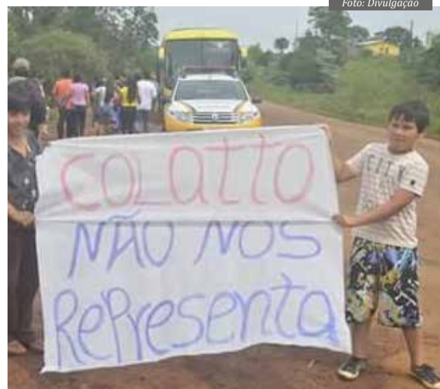
Povos do oeste de Santa Catarina

Qual é o sentimento hoje dos seus pais e vizinhos? O que eles sentem quando veem as notícias sobre Marco Temporal? Eles sentem que a população brasileira conhece a versão, por exemplo, de vocês, pequenos agriculto-