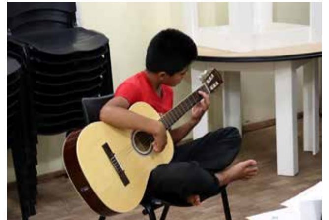
As crianças indígenas participam de diversas oficinas

Em Descanso, vivem sete famílias indígenas com cerca de 30 pessoas no total. Recentemente a Prefeitura Municipal, em uma ação conjunta com outras forças vivas do município, viabilizou uma área localizada na Linha Famoso onde as famílias passaram a residir definitivamente.