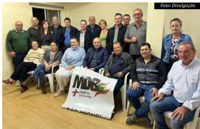
Lideranças regionais do MDB