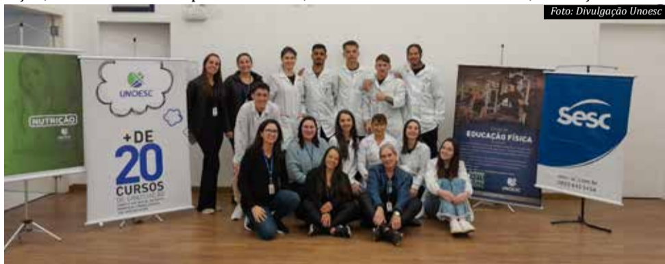
Equipes que participaram dos atendimentos aos colaboradores do Sesc

A Unoesc São Miguel do Oeste vem desenvolvendo diversas atividades com o objetivo de contribuir com o desenvolvimento e bem-estar da comunidade em que está inserida, oferecendo serviços de qualidade e contribuindo para o desenvolvimento regional.