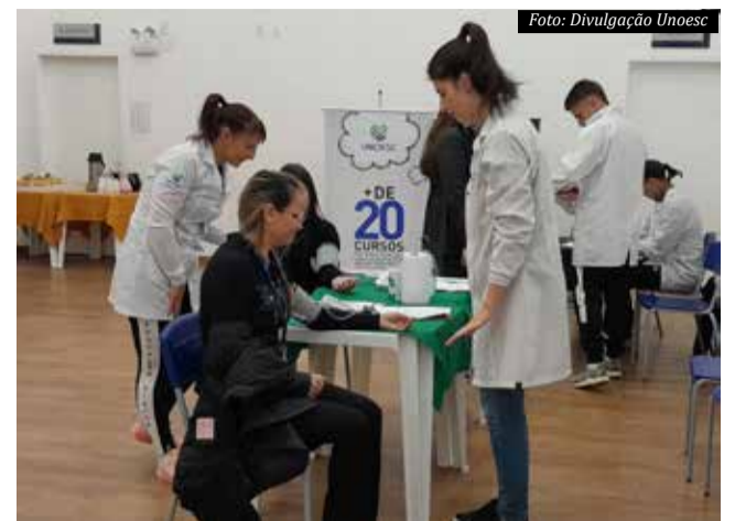
A Unoesc vem desenvolvendo diversas atividades com o objetivo de contribuir com o desenvolvimento e bem-estar da comunidade

— Queremos despertar mais a atenção dos nossos colaboradores para a atividade física e para terem uma alimentação mais