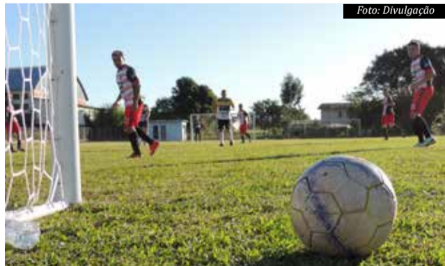
Muitos gols foram anotados nas partidas de volta das semifinais