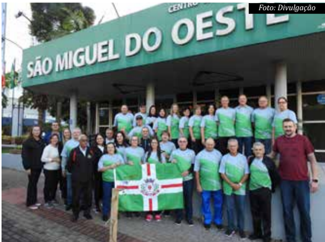
São Miguel do Oeste

A delegação de São Miguel do Oeste segue nesta quarta-feira (24), para a fase estadual dos Jogos Abertos da Terceira Idade (JASTI), que acontece entre os dias 25 e 28 de maio, em São Bento do Sul/SC.