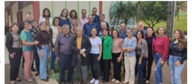
Na foto, ex-diretores e funcionários do CEDUP-GV presentes no evento

A história do CEDUP perpassou diversas direções e, ano após ano, conquistas foram somadas a ponto de, hoje, o CEDUP-GV ser uma referência educacional no Sul do país, ultrapassando os 1.700 alunos formados e que estão no mercado de trabalho Brasil afora.