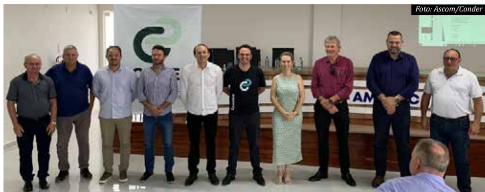
Diretoria do CONDER

A estrutura da Usina de Asfalto está sendo concluída e está localizada no município de São Miguel do Oeste, no acesso ao município de Barra Bonita. Já estão construídos o escritório da usina, a concretagem do piso, o galpão e