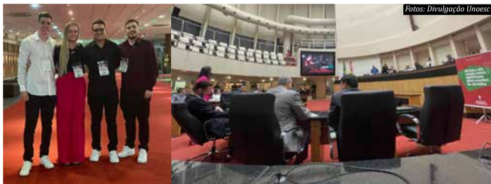
Cada Deputado Estadual pode indicar até dois estudantes de estabelecimentos de Ensino Superior para participarem do Estágio-Visita

Bellini, se sentiu grata pela oportunidade.