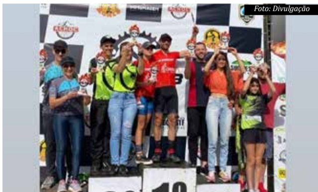
Pódio reuniu os melhores da categoria Dupla/mista