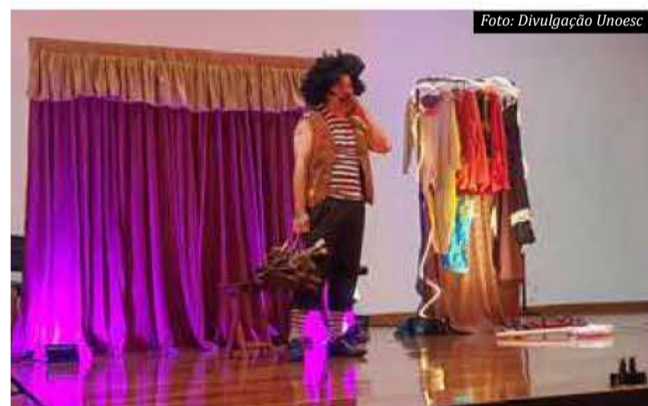
Peça teatral "Varieté humor cômico" arrancou gargalhadas do público

A programação iniciou na segunda-feira (8), com a peça