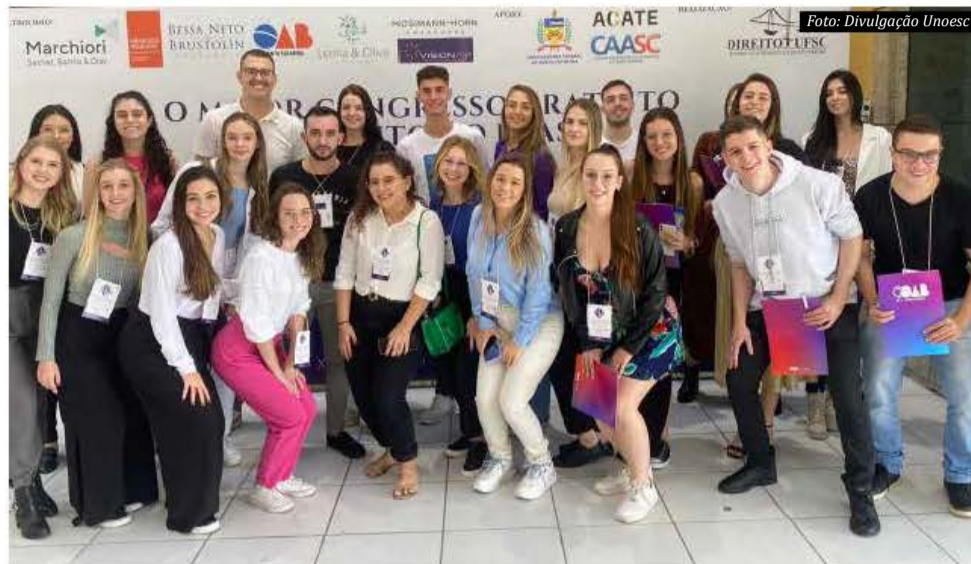
O evento teve por objetivo promover a produção acadêmica e integrar os Cursos de Direito do país com os rumos do pensamento jurídico nacional

Estudantes e professores dos Cursos de Direito da Unoesc São Miguel do Oeste e Pinhalzinho participaram, nos dias 11 e 12 de maio, do XVII Congresso de Direito da Universidade Federal de Santa Catarina (UFSC), em Florianópolis. O evento teve por objetivo promover a produção acadêmica; integrar os Cursos de Direito do país com os rumos do pensamento jurídico nacional; criar um expoente do saber jurídico em Santa Catarina e buscar a evolução saudável da cultura jurídica, no Brasil, abordando temas controversos, que permitam a superação de paradigmas. O Congresso é considerado o maior evento jurídico