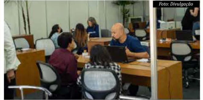
Ao todo, serão 100 Salas do Empreendedor espalhadas pelo estado com programação especial na Semana do MEI

Com uma programação exclusiva aos microempreendedores individuais, o Sebrae/SC promove entre os dias 22 e 26 de maio a Semana do MEI 2023, que busca auxiliar o microempreendedor individual (MEI) que já se formalizou, deseja abrir uma empresa ou ainda expandir o seu negócio. As ações acontecem nos formatos presencial e online, em diversas cidades do Estado, e são totalmente gratuitas. Mais informações pelo http://sebrae.sc/semanadomei23 .