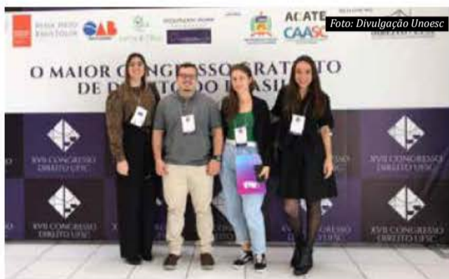
O Congresso é considerado o maior evento jurídico gratuito do Brasil