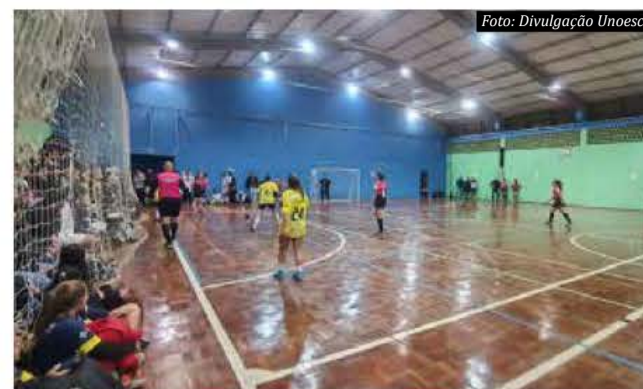
Competições esportivas foram realizadas no Centro Esportivo da Unoesc e no Ginásio Municipal

Janete Bertochi e Ismael Balbinot, do Ateliê de Artes Cores ao Mundo, com quadros e desenhos também com diversas técnicas.