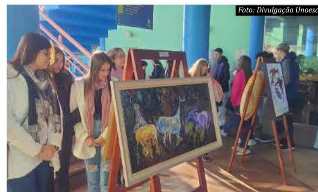
Semana Esportiva e Cultural abriu espaço para exposição de obras de artistas regionais