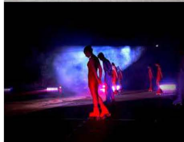
Clube de Patinação Danúbio Azul foi uma das atrações

Continuar a VOAR É PRECISO O desenvolvimento do Extremo-Oeste de Santa Catarina passa pelo aeroporto Élio Wassum