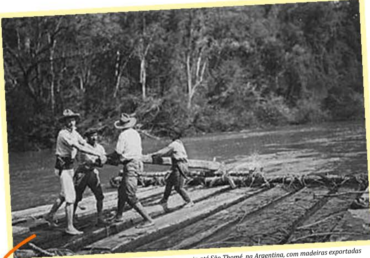
Navegação de balsa no Rio Uruguai, que posteriormente seguia até São Thomé, na Argentina, com madeiras exportadas para a Europa e Ásia. Na época, era comum o uso de arma na cintura

vam as colônias gaúchas se escondiam no lado catarinense da fronteira, vindo daí a denominação. Mondaí foi colônia, depois distrito de Chapecó e emancipou-se em 30 de dezembro de 1953.