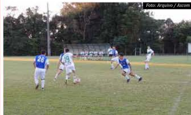
Os confrontos ocorreram no Estádio Municipal