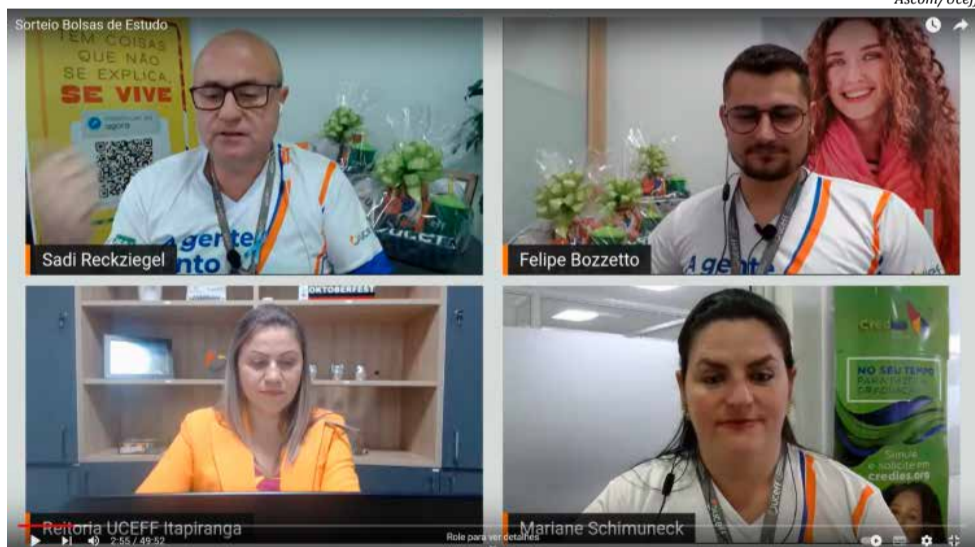
Sorteio foi realizado em evento pelo Youtube

de conhecer a Instituição através de visitas agendadas em grupos de alunos.