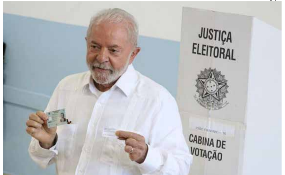
Previsão é que Lula assuma a faixa presidencial em 1º de janeiro

Luiz Inácio Lula da Silva – que tem previsão de assumir a faixa presidencial dia 1º de janeiro de 2023 – teve uma visão profética no dia 9 de março de 2016, antes de ser condenado por corrupção e acabar forçado pelo ex-juiz Sérgio Moro a passar 580 dias “hospedado” em um cárcere improvisado, especialmente arrumado só para ele, em uma sala na sede da Superintendência da Polícia Federal, em Curitiba. Lula proclamou e o Estadão registrou: “Se me prenderem, eu viro herói. Se me matarem, viro mártir. Se me deixarem solto, viro Presidente