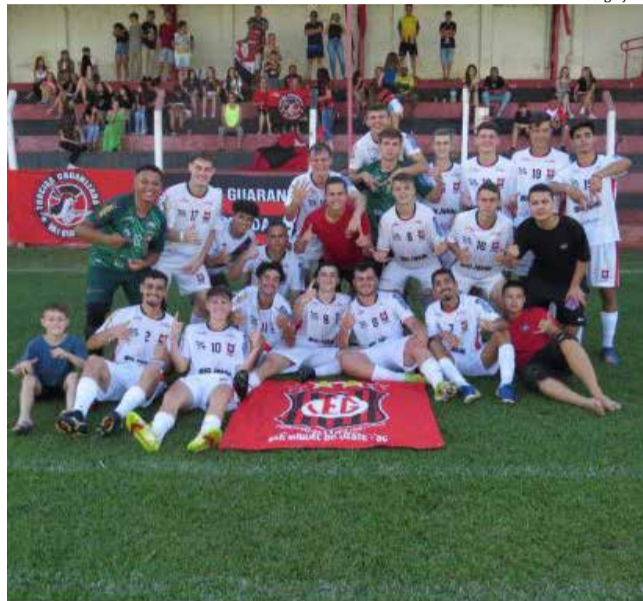
Nessa competição, a equipe Sub-18 do Guarani teve a defesa menos vazada