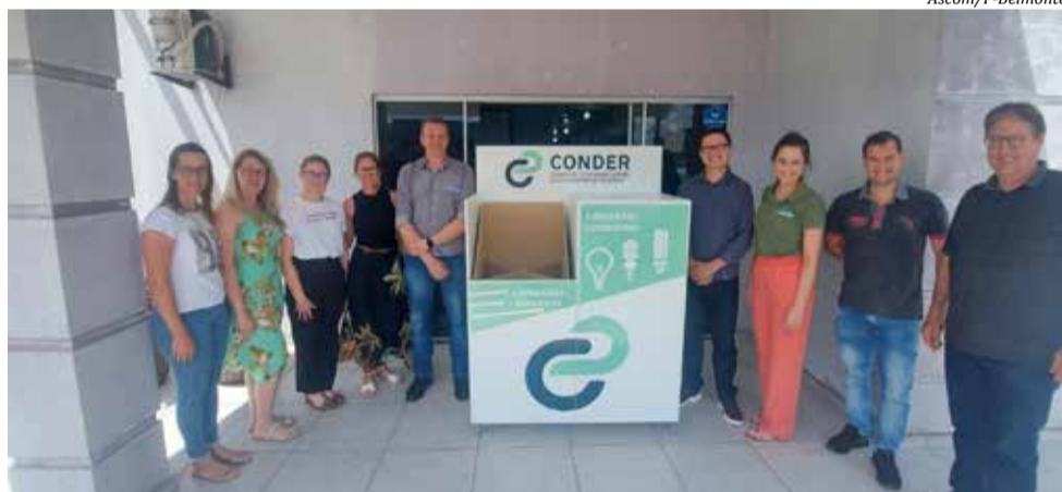
Convênio foi assinado no final da semana passada

ciclagem de lâmpadas é desenvolvido pelo Conder, com apoio do Ministério Público de Santa Catarina (MPSC), Instituto do Meio Ambiente (IMA), Programa Penso, Logo Destino