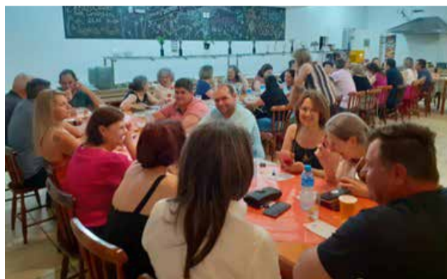
Conversas animadas abrilhantaram o encontro

A festa, embora organizada em pouco tempo, teve boa participação dos profissionais que estão na ativa, bem como os que já se aposentaram. O reencontro sempre é importante, uma vez que existe um movimento de boa convivência, matar saudades, de querer encerrar o ano positivamente junto com os colegas, incluindo desde os que se veem frequentemente até os que se encontram esporadicamente.