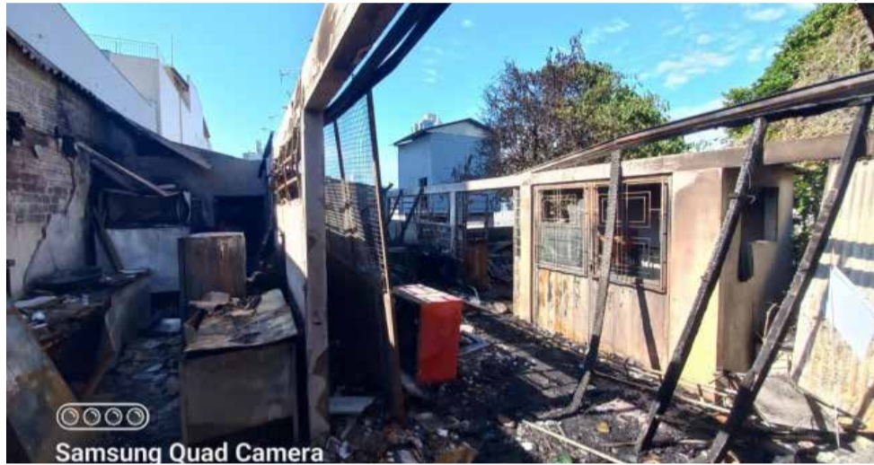
Samsung Quad Camera

Em uma rápida ação os combatentes conseguiram controlar as chamas e evitar maiores danos. Conforme os bombeiros, cerca de mil e quinhentos metros quadrados de área construída foram salvos e 80 metros quadrados acabaram dani-