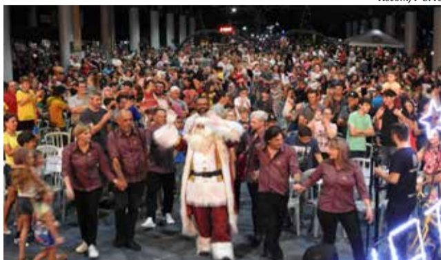
Área coberta da praça ficou lotada para o evento que deu início à programação natalina

Para abrilhantar ainda mais a noite, o público pôde prestigiar a apresentação da Orquestra de Itapiranga. Além disso, foi realizado o 5º Festival