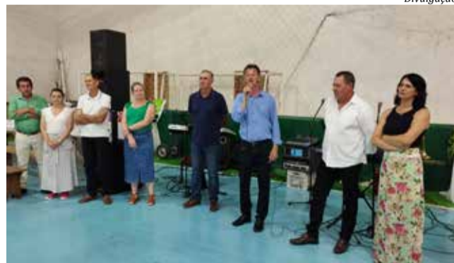
Prefeito Blásio Hickmann e demais autoridades do município prestigiaram o evento

Conforme a organização, entre o público da terceira idade, voluntárias, funcionários públicos e colaboradores, cerca de 500 pessoas marcaram presença. A organização agradece o envolvimento voluntário dos servidores públicos para servir os idosos. "Foi um dia lindo, coroado por uma excelente organização que contou com várias mãos. Muito obrigado a todos", agradece a coordenação.