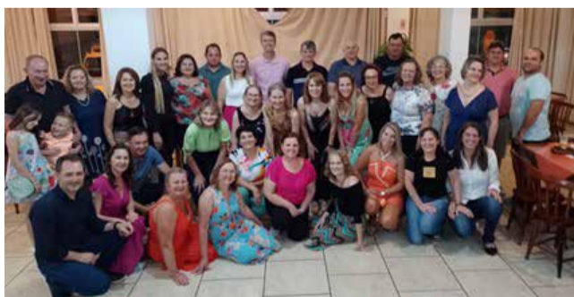
Pose especial para o Jornal Imagem

O encontro dos profissionais da EEB. Everardo Backheuser aconteceu no dia 02 de dezembro, sexta feira no restaurante da Klka em Descanso