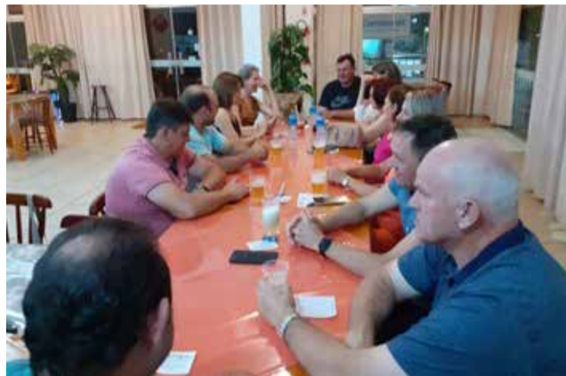
Enquanto a janta não vinha, havia outras opções...

É lá se foi mais um ano letivo... Foram muitas conquistas, desafios, contratempos, estudos, reflexões, planejamentos e organizações. Muito trabalho! Mas, antes de fechar a escola e aproveitar o recesso ou as férias, é muito importante reunir a equipe escolar para uma confraternização merecida.