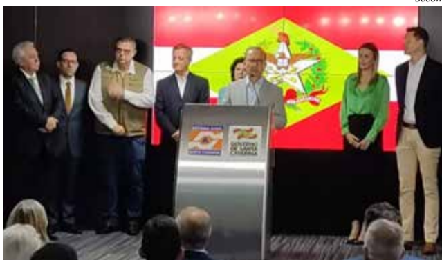
Anúncio foi feito segunda-feira, em coletiva de imprensa

Ainda faltam ser nomeados os secretários para a Secretaria de Estado do Desenvolvimento Social, Secretaria de Estado da Infraestrutura e Mobilidade, Secretaria de Estado da Administração Prisional e Socioeducativa, Secretaria Executiva de Assuntos Internacionais, Secretaria