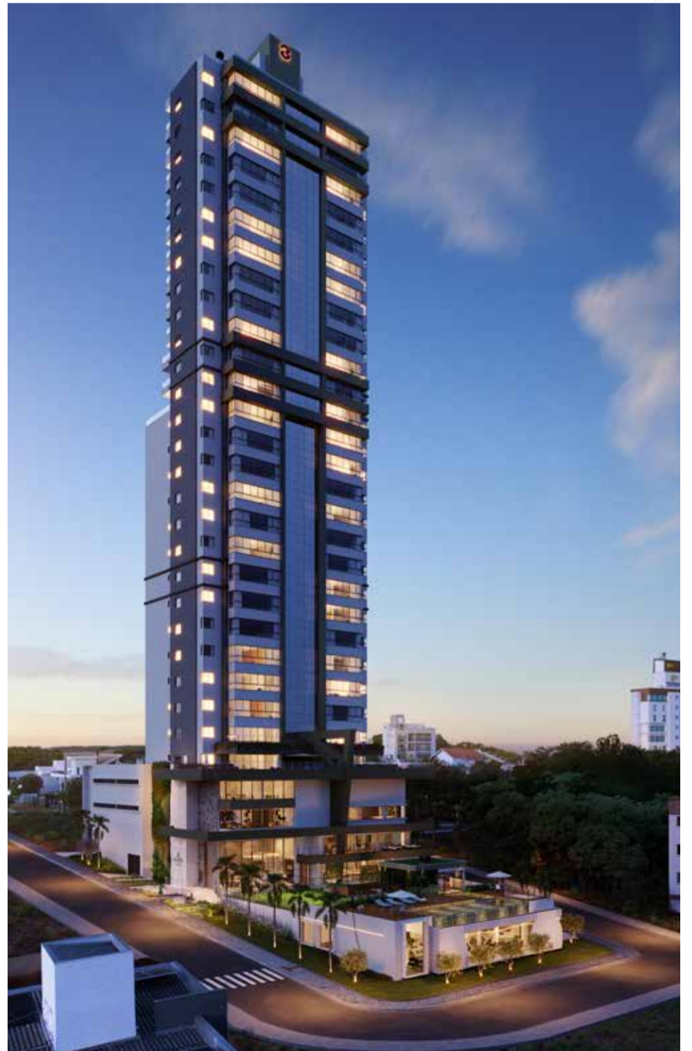
Edifício Majestic, o mais arrojado empreendimento da Bolfe Engenharia foi apresentado durante a Faismo