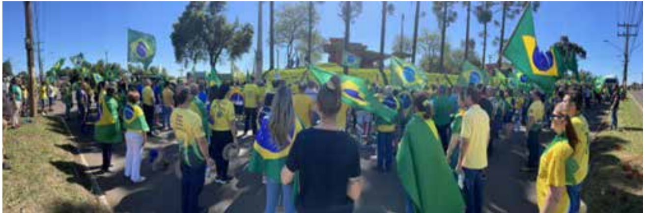
Povo ordeiro e trabalhador pede SOS aos Lanceiros do Ponche Verde, no feriado de 15 de novembro, em São Miguel do Oeste

Esta decisão de soltar o Lula e calar os patriotas deste país, condenou o nosso Supremo Tribunal Federal (STF) a prisão perpétua. Jamais poderão se apresentar em local público, sem serem cobrados pela decisão, a meu ver, fora das quatro linhas da Constituição Federal.