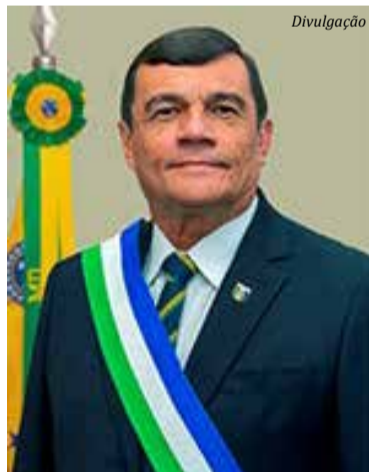
General de Exército Paulo Sérgio Nogueira de Oliveira - Ministro de Estado da Defesa

Outro fato que chama a atenção é o fato do deputado federal Elias Vaz (PSB), no dia seguinte à nota do ministro esclarecendo que o relatório não afiançava o processo, ter impetrado, no Supremo Tribunal Federal (STF), uma notícia-crime contra o general Paulo Sérgio Nogueira, ministro da Defesa, por ter promovido "especações golpistas" com a divulgação do relatório de fiscalização das urnas.