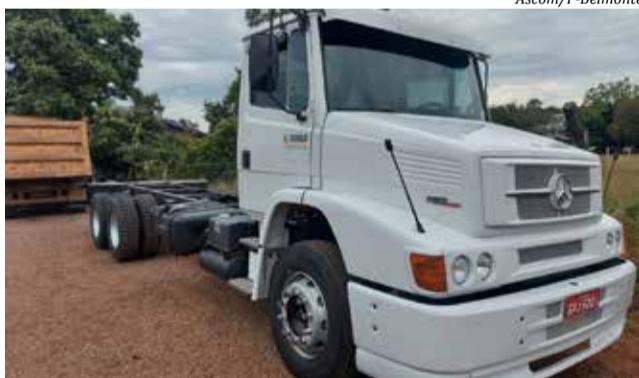
O veículo é seminovo e passou por uma vistoria de uma comissão mista

“Esse caminhão será essencial para o município, pois além agilizar o deslocamento das máquinas, evitará o tráfego de-