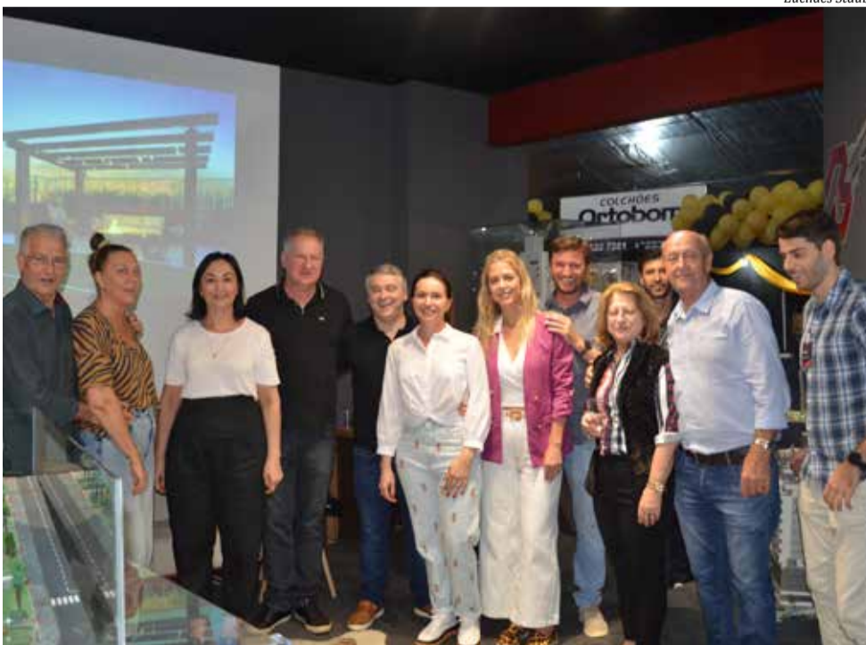
Estande da Bolfe Engenharia foi um dos mais movimentados durante a Faismo