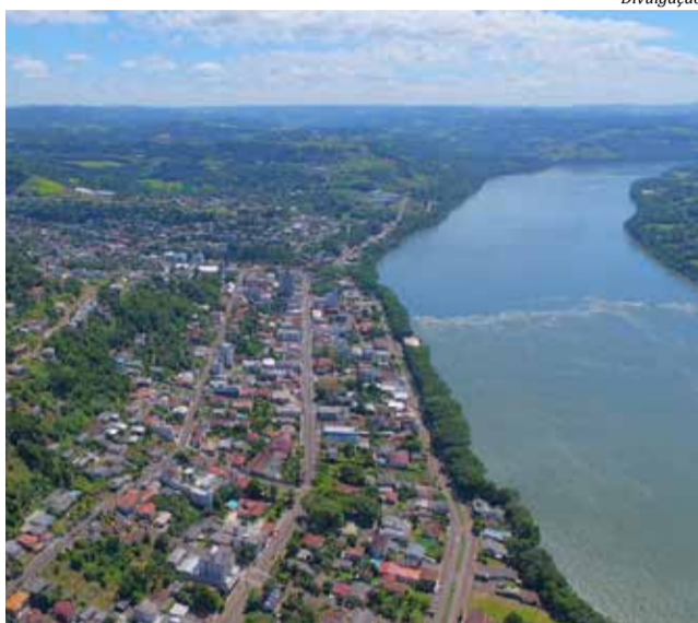
Ponte vai ligar Santa Catarina e Rio Grande do Sul sobre o Rio Uruguai, em Itapiranga

De acordo com ele, o grupo, formado por entidades empresariais e prefeitos do Extremo-Oeste de SC e o Noroeste