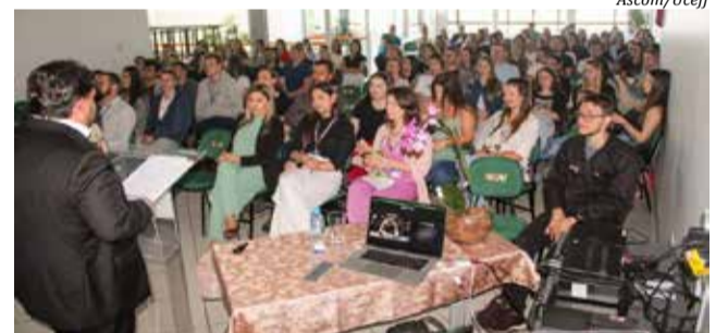
O Simpósio contou também com palestras aos acadêmicos

Os painéis passaram por avaliação de bancas compostas por professores de diversos cursos da Uceff de Itapiranga e foram expostos para todos os acadêmicos, contribuindo não só para a área científica da faculdade, mas também do município de Itapiranga.