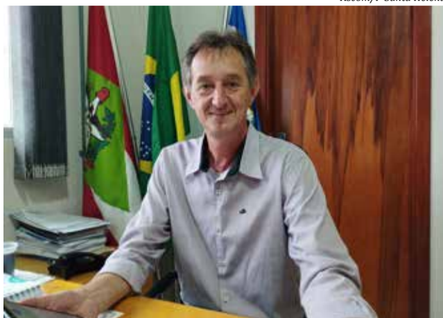
Prefeito Blásio Hickmann

Por conta deste evento, será realizado no início do próximo ano o baile com escolha das soberanas. Para este baile, os trabalhos foram divididos em comissões, as quais já estão cuidando dos detalhes para realização de um evento bonito. "Num primeiro momento, tínhamos o interesse de fazer o baile com escolha das soberanas no dia 08 de janeiro, por conta do 31º aniversário do município, mas neste mesmo final de semana acontece a Feira em Belmonte. Por isso, faremos o baile com desfile no dia 11 de fevereiro", explica Hickmann.