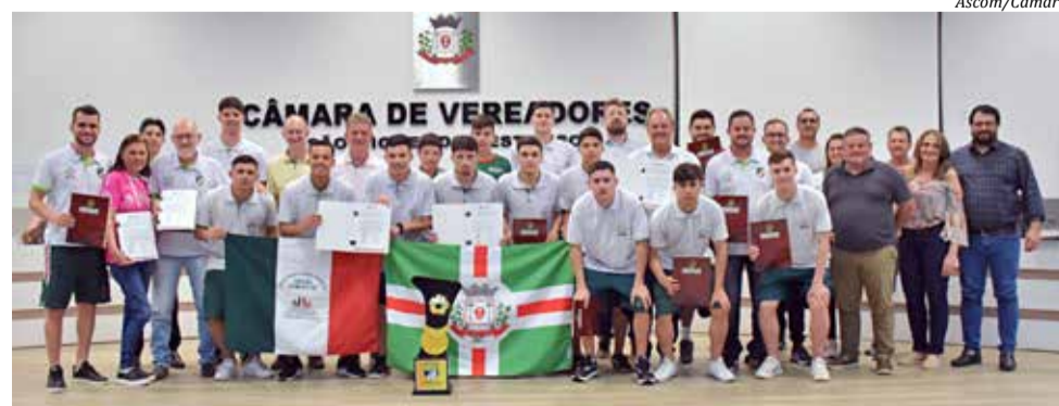
Vereadores entregaram moção de aplauso a atletas que conquistaram campeonato nacional

te e sério trabalho desenvolvido pelo Joni Gool/São Miguel Futsal, especialmente com as categorias de base e formação de novos atletas. O município de São Miguel do Oeste sente muito orgulho com a conquista e este é o reconhecimento do Poder Legislativo Municipal ao clube, torcedores, patrocinadores e apoiadores, que mais uma vez colocam nosso município no topo do cenário nacional de futsal", declaram os vereadores autores da moção.