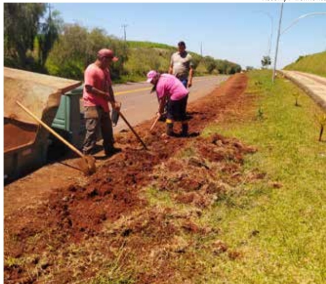
Espécies de flores e arbustos são plantados, afim de melhorar o aspecto da cidade