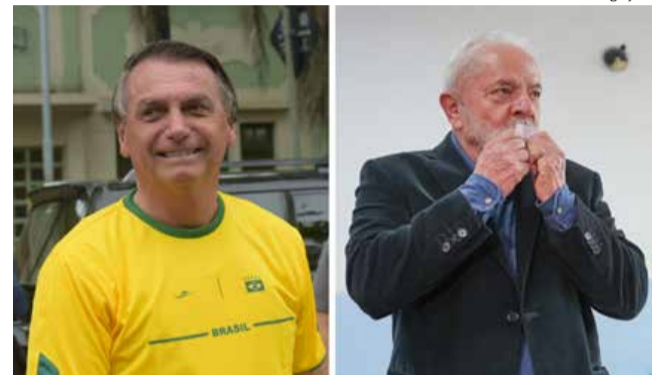
Jair Bolsonaro e Lula disputam o segundo turno das eleições de 2022 no dia 30 de outubro

Na Política Real a coisa é mais feia. Nossa República Presidencialista é uma ficção. Não existe mais – se é que um dia efetivamente existiu, desde que foi proclamada no dia 15 de novembro de 1889. Sempre foi oligárquica. Falta razão pública. Não garante e nem respeita a legalidade. Sobram leis em vigor. Falta respeito a elas. A Lei Maior é violada abertamente. Feita para operar um sistema parlamentarista, sob controle do Congresso Nacional, a Constituição de 1988 já foi revogada, na prática.