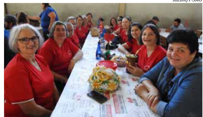
O Encontro contou com a participação de 31 clubes, que confraternizaram num dia de festa, união e integração

Todos os grupos receberam uma lembrança e, após o almoço, as mulheres acompanharam o sorteio da rifa e participaram de rodadas de bingo. Andreia