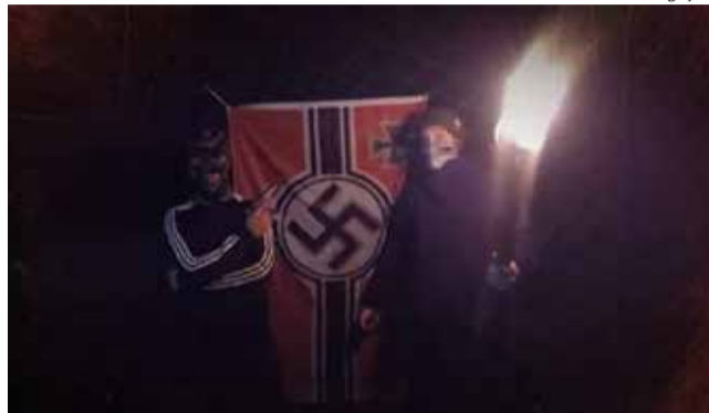
Grupo produzia vídeos nas redes sociais defendendo as ideias de Adolf Hitler

O inquérito policial revelou que a célula se reunia em um sítio, utilizando coletes e peças réplica de uniforme na-