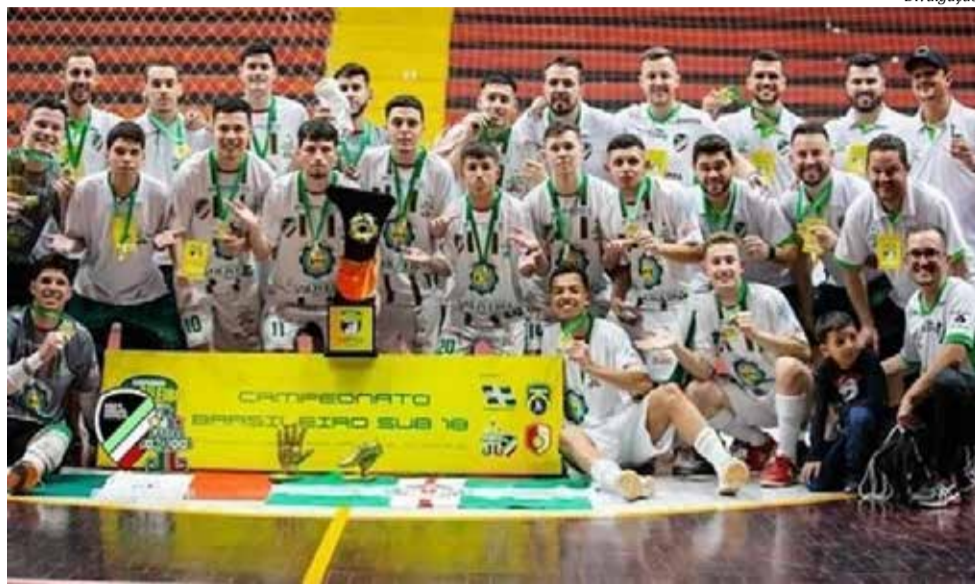
Título conquistado é inédito para a equipe e para o futsal de São Miguel do Oeste

A final na noite de sábado foi disputada pelo Joni Gool e Associação Santo Ângelo, que na fase de classificação já havia arrancado um empate em 3 X 3. O confronto mostrou dois estilos de jogo diferentes. De um lado, o Futsal Joni Gool de intensa movimentação