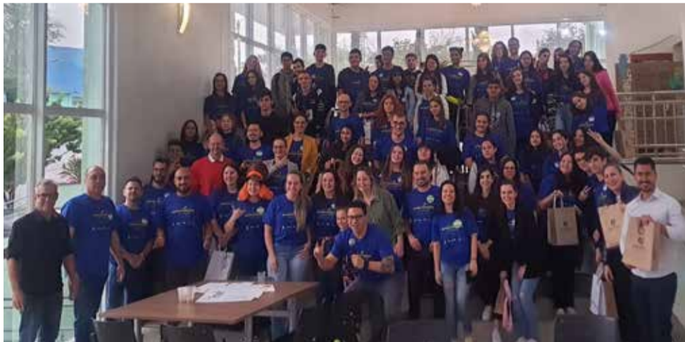
Pelo menos 80 alunos participaram com acompanhamento de mais de 10 mentores