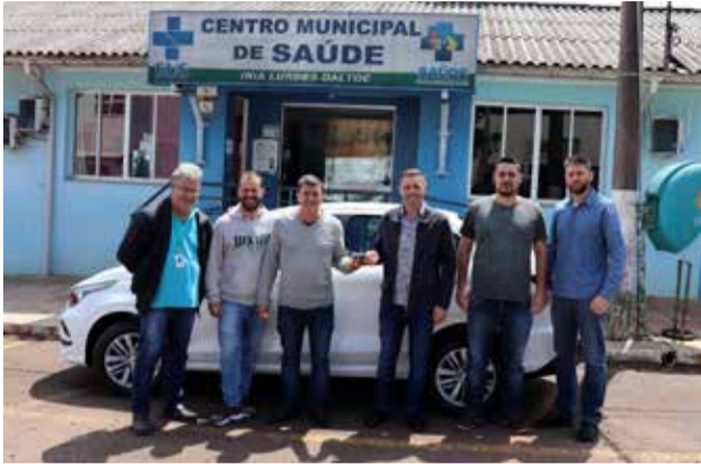
Veículo foi entregue sexta-feira à Secretaria da Saúde