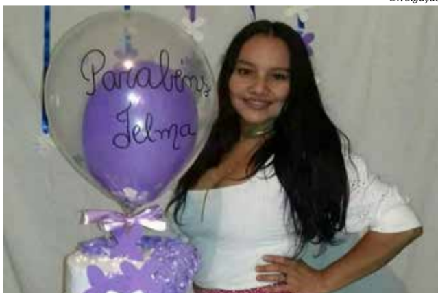
Horas antes da morte, a vítima publicou uma foto em suas redes sociais agradecendo as felicitações pelo seu aniversário

O réu foi denunciado pelo Ministério Público pela prática do crime de homicídio qualificado pelo feminicídio, mediante recurso que dificultou a defesa da vítima e por