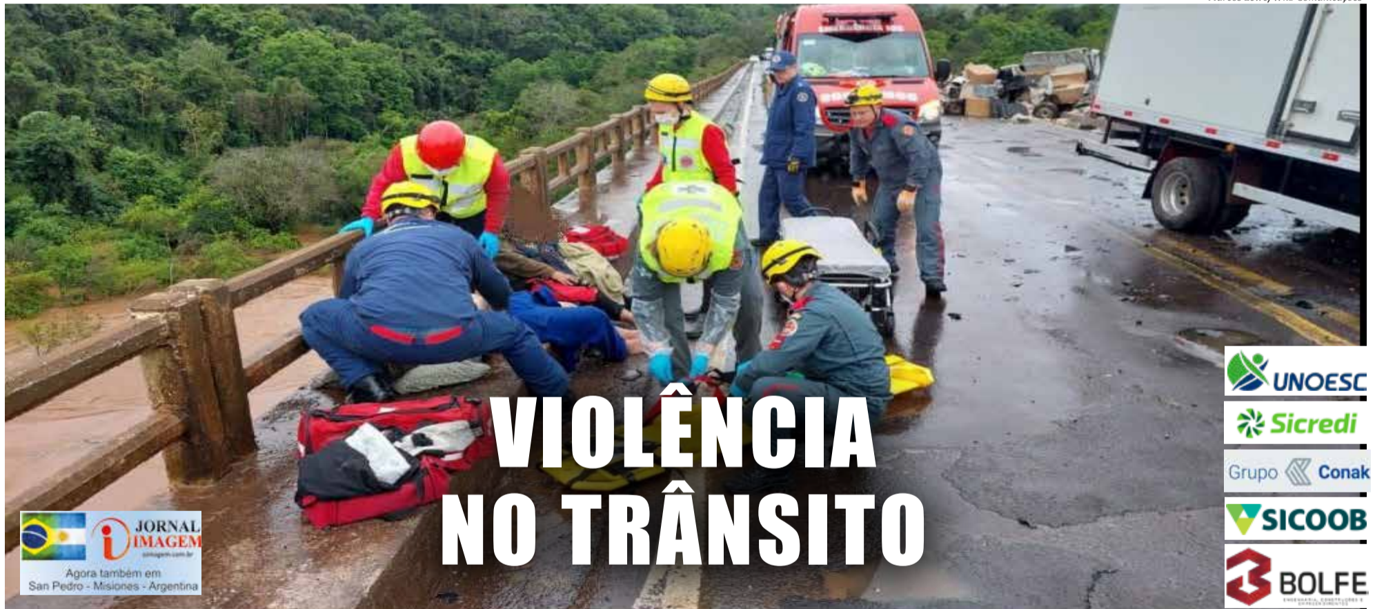
Marcos Lewe/Wh3 Comunicações