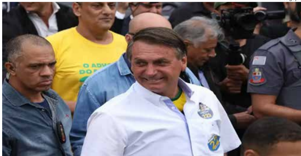
Jair Bolsonaro apelou aos prefeitos para mobilizar eleitores nos municípios

"Em grande parte a decisão de quem comandará a Nação passará pela mão de vocês no respectivo município. Vocês podem comparar meu governo com os anteriores. Há pouco tempo vocês viviam em romaria, de pires na mão em Brasília. Isso acabou. Vocês hoje, com a ajuda do governo federal e impostos que vêm do povo,