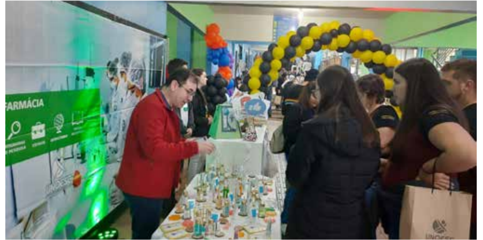
Todos os cursos apresentados durante a Feira das Profissões estão no Processo Seletivo 2023