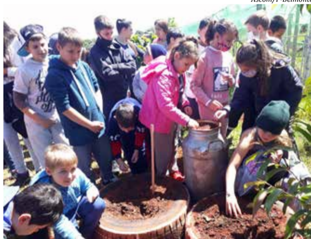
Estudantes fizeram o plantio de girassóis para marcar o início da Primavera

Nessas ações, os alunos do Centro de Educação Fundamental João Revers realizaram, na última semana, a semeadura de girassóis nos jardins da unidade, na cidade, e na