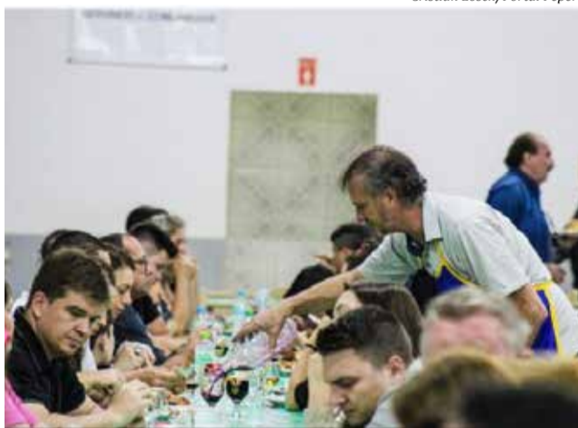
Evento ocorreu sábado, no Salão Comunitário do Bairro Agostini