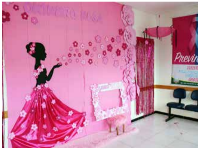
A recepção do Posto de Saúde está decorada com temas que lembram a campanha

Conforme o secretário de Saúde, Cleber Rech, as mulheres interessadas devem fazer o agendamento com o seu agente de saúde ou ligando nas Unidades de Saúde. “Nossas equipes farão a coleta do preventivo também em horários diferenciados para atender um número maior de mulheres. Façam o agendamento, pois além de servir para a detecção de lesões precursoras do câncer e da infecção pelo HPV, o papanicolau indica se você tem alguma outra infecção que precisa ser tratada”, alerta.