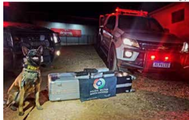
Droga foi apreendida graças ao uso de um cão de faro