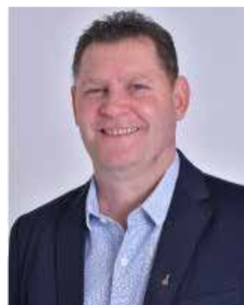
31 - Massocco (PL) 31.659 votos