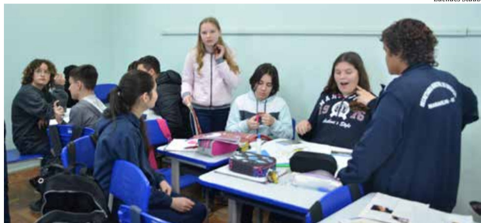
Alunos trabalharam em grupos o assunto empreendedorismo