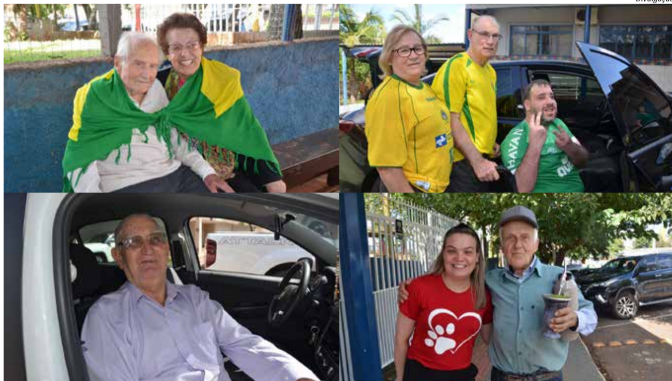
Muitos eleitores que não precisavam mais votar pela idade fizeram questão de comparecer às urnas