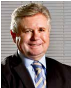
21- Berlanda (PL) 41.488 votos