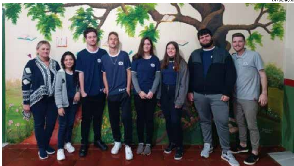
Ao menos seis alunos participaram do projeto na escola do Santa Rita