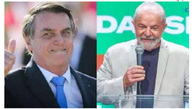
Luiz Inácio Lula da Silva e Jair Bolsonaro se enfrentam no segundo turno, no dia 30 de agosto

durante uma passeata em Juiz de Fora (MG), sofreu um atentado a faca e teve que passar por cirurgias e ficar internado. Com uma campanha voltada para temas morais, foi eleito no segundo turno de 2018, com 55% dos votos. Bolsonaro é pai de cinco filhos. Três deles são políticos: Carlos Bolsonaro é vereador no Rio de Janeiro; Eduardo Bolsonaro é deputado federal por São Paulo; e Flávio Bolsonaro (PL) é senador pelo Rio de Janeiro.