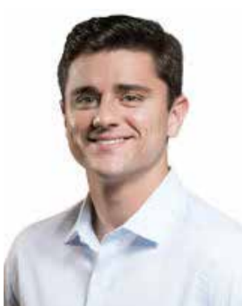
37 - Sorgatto (PL) 25.622 votos