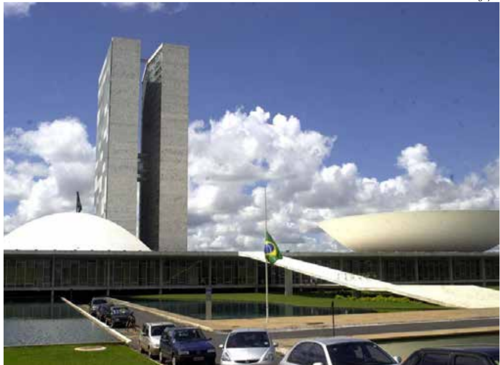
Fachada do palácio do Congresso Nacional, localizado em Brasília

Quem venceu, antecipadamente, foi a Cleptocracia e (sua amante e comparsa) a Juristocracia. As empresas de pesquisa também "venceram"? Embora tenham errado muito, acertaram na missão de ajudar a propagandar um resultado a favor de Lula. Impressionante foi como um Presidente da República mais popular nos últimos 20 anos chegou atrás de um ex-Presidiário, que quase nada saiu às ruas, mas quase liquidou a fatura no primeiro turno. Muito estranho. Candidatos aos governos estaduais apoiados por Bolsonaro tiveram desempenho fabuloso, e ele, não? Metade do eleitorado aceita devolver a gestão do País aos corruptos comprovados? Que esquisito. Ainda bem que nem tudo se perdeu. Bolsonaro fez 14 senadores e maioria na Câmara dos Deputados. O Centrão cresceu.