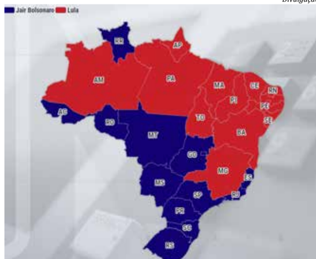
Mapa mostra como foi a distribuição dos votos nos estados e Distrito Federal

Jair Bolsonaro (PL): 62,21% Lula (Pt): 29,54% Simone Tebet (MDB): 4,42% Ciro Gomes (PDT): 2,05% Felipe D'avila (Novo): 1,13% Soraya Thronicke (União): 0,08% Padre Kelmon (PTB): 0,08% Sofia Manzano (PCB): 0,04% Léo Péricles (UP): 0,04% Vera (PSTU): 0,02% Constituinte Eymael (DC): 0,01%