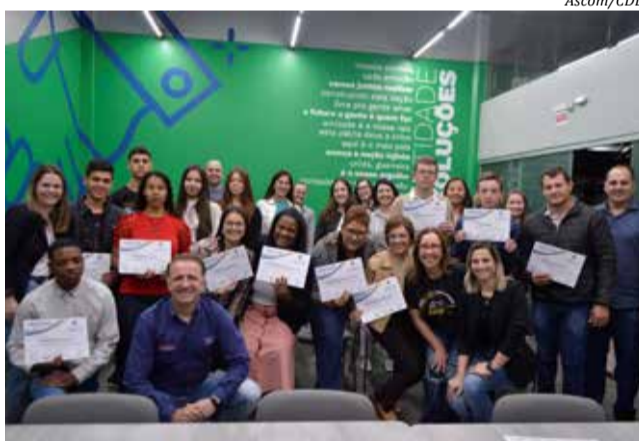
Projeto teve seu encerramento segunda-feira

Foi uma iniciativa gratuita para a comunidade, que contemplou em sua grade aulas desde apresentação pessoal, preparação de entrevistas, oratória e comunicação; noções de vendas, negociação, rotina administrativa, contábil, marketing digital e noções de informática.