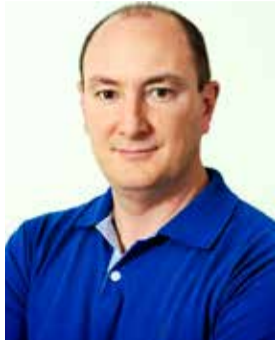
6- De Nadal (MDB) 67.065 votos