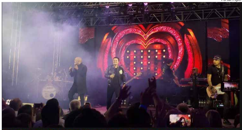
O ponto alto foi registrado na noite deste sábado, quando o público lotou a área de shows para assistir a dupla sertaneja Rick e Renner

De acordo com a CCO, nem a chuva de domingo atrapalhou o sucesso do evento, que registrou mais de 30 mil visitantes durante os três dias. Os destaques da Efacitus foram os expositores