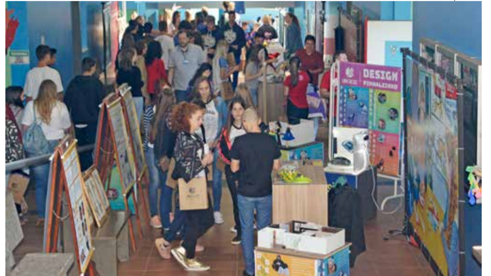
4ª Edição da Feira das Profissões terá apresentação de dois novos cursos

Durante os dois dias, das 8h às 16h e das 19h às 22h, os estudantes serão recepcionados no Centro Cultural da Universidade, onde receberão um mapa com a localização dos laboratórios