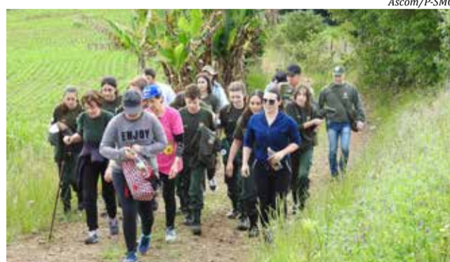
Durante o percurso de 5 km, os caminhantes passaram por estradas rurais, de roça, poteiros e morros, por cerca de duas horas e meia

Durante o percurso de 5 km, os caminhantes passaram por estradas rurais, de roça, poteiros e morros, por cerca de duas horas e meia, com duas paradas em oficinas temáticas, organizadas pelos cursos de Fisioterapia e Psicologia da Uno-