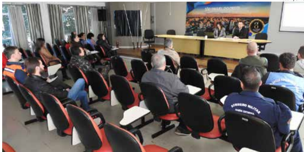
Integrantes da Sala de Situação de Combate à Dengue se reuniu sexta-feira para um balanço da situação

Entre os trabalhos desenvolvidos para combate à epidemia em São Miguel