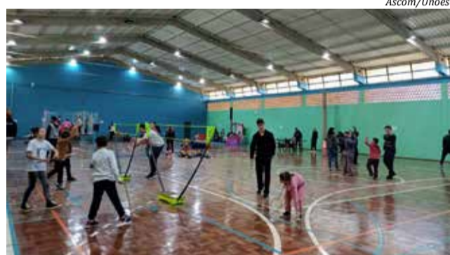
Os participantes puderam interagir com os acadêmicos em modalidades esportivas e diversas brincadeiras lúdico-recreativas

participantes, no Centro Esportivo da Universidade, que pôde interagir com os acadêmicos em modalidades esportivas, diversas brincadeiras lúdico-recreativas e apresentações culturais. Os pais e responsáveis que acompanharam as crianças puderam realizar avaliação física, no Laboratório de Fisiologia do Exercício, atividades de jump e circuito funcional na sala de ginástica.