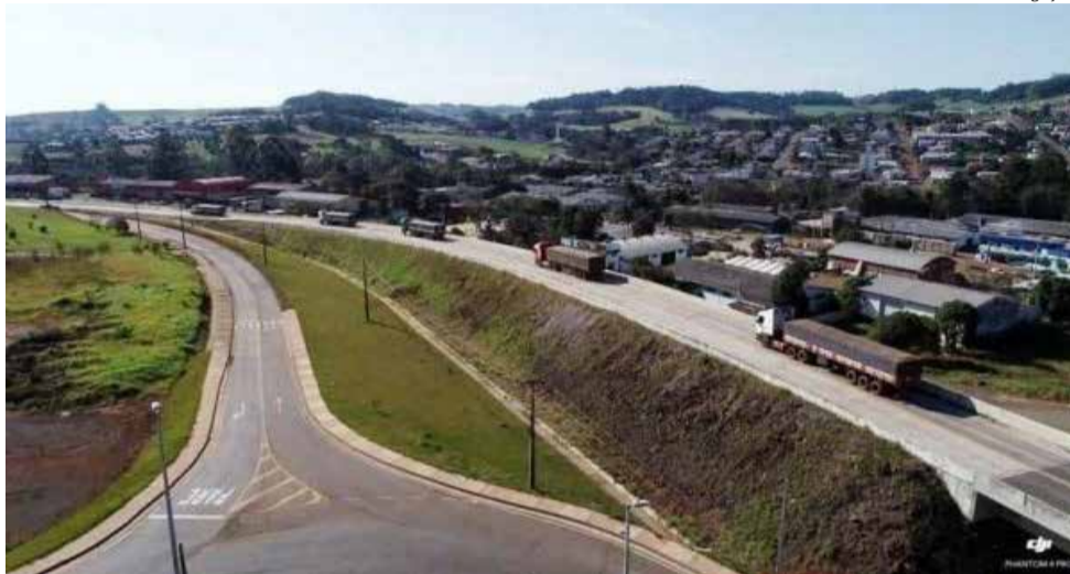
Somente neste ano, foram investidos R$ 60 milhões na rodovia, incluindo os recursos do convênio com o governo estadual

No sistema adotado na BR-163, uma camada de 23 centímetros de concreto é aplicada sobre o asfalto antigo, numa técnica chamada de "whitertopping". Desde a semana passada, o concreto passou por lavagem e recebeu a pintura das faixas de sinalização. A meta do Departamento Nacional de Infraestrutura de Transportes (Dnit) é liberar o tráfego até amanhã, sexta-feira, 30, trecho