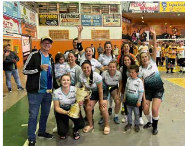
Equipe da Metalúrgica Belmonte venceu no Feminino