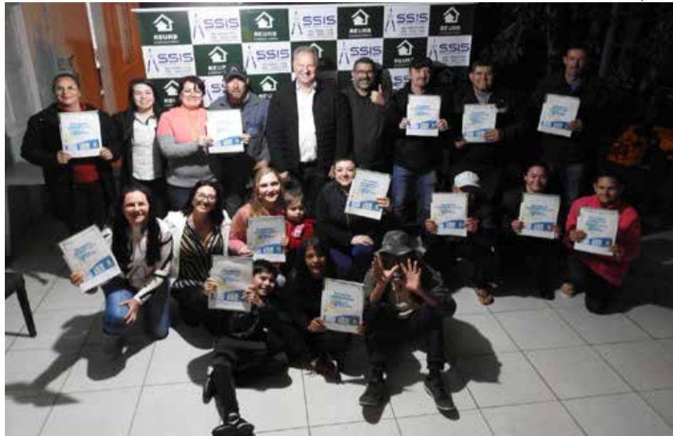
As 17 escrituras foram entregues a moradores do Bairro Santa Rita