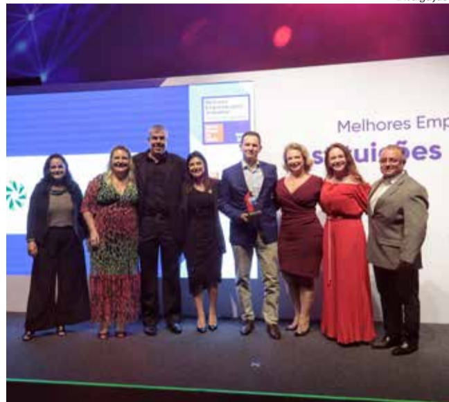
Sicredi foi premiado em quarto lugar no ranking