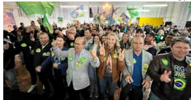
Ato reuniu lideranças do PL no Oeste do Estado