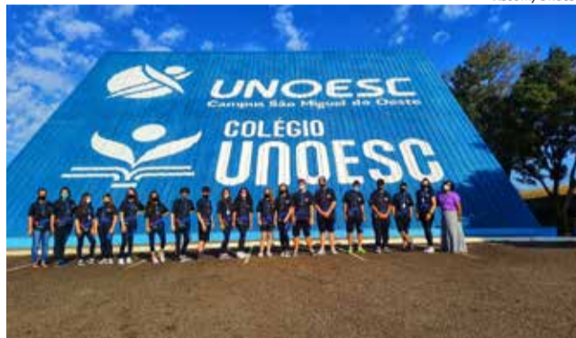
O Colégio está instalado em uma área de 62.359,94 metros quadrados, dentro da Universidade, no Bairro Agostini

Além de oportunizar educação de qualidade e inovadora, o Colégio Unoesc procura inspirar em seus estudantes valores que contribuem para a formação de cidadãos competentes, conscientes, criativos, comprometidos, críticos e reflexivos. Os interessados em conhecer a estrutura e metodologia de ensino podem agendar visita pelos telefones 3631-1600 ou 3631-1040.