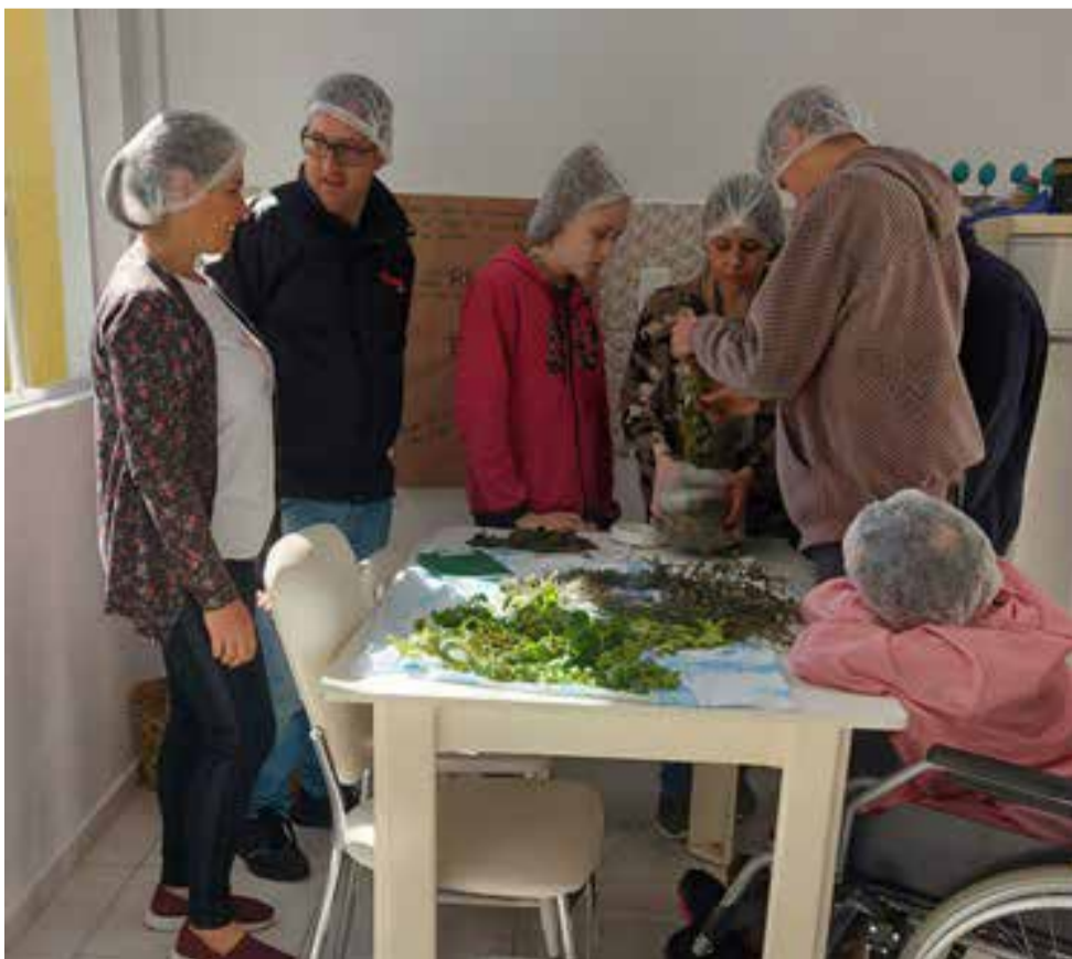
Oficina atraiu o interesse dos alunos