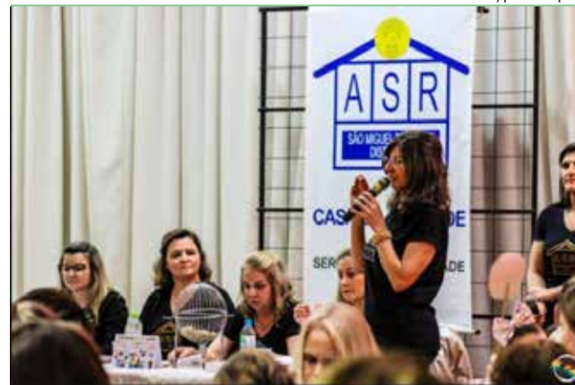
Evento foi realizado segunda-feira, no Clube Comercial