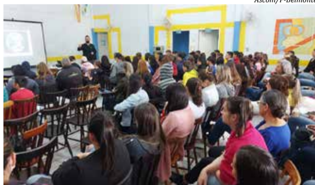
A atividade foi organizada pela Secretaria de Assistência Social

Também é alarmante o grande número de adolescentes, a partir dos 12 anos, que já tentaram algum ato. "É preciso falar sobre abordar o assunto