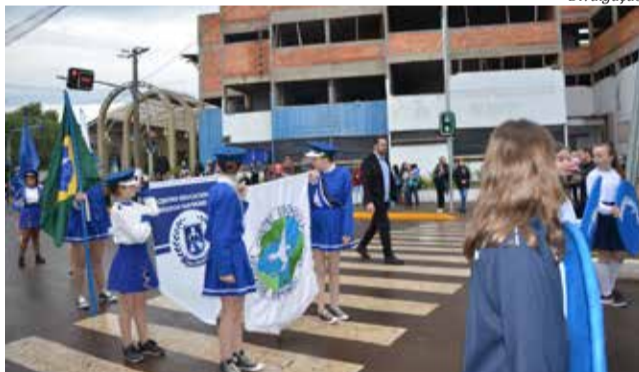
Alunos da Escola Cívico-Militar - Centro Educacional Vereador Raymundo Veit, recém criado no município, abrilhantou o desfile

e militares, a novidade no desfile ficou por conta da Escola Cívico-Militar - Centro Educacional Vereador Raymundo Veit, recém criado no município. A escola municipal conta atualmente com 67 funcionários, entre direção, professores, estagiários e serviços gerais.