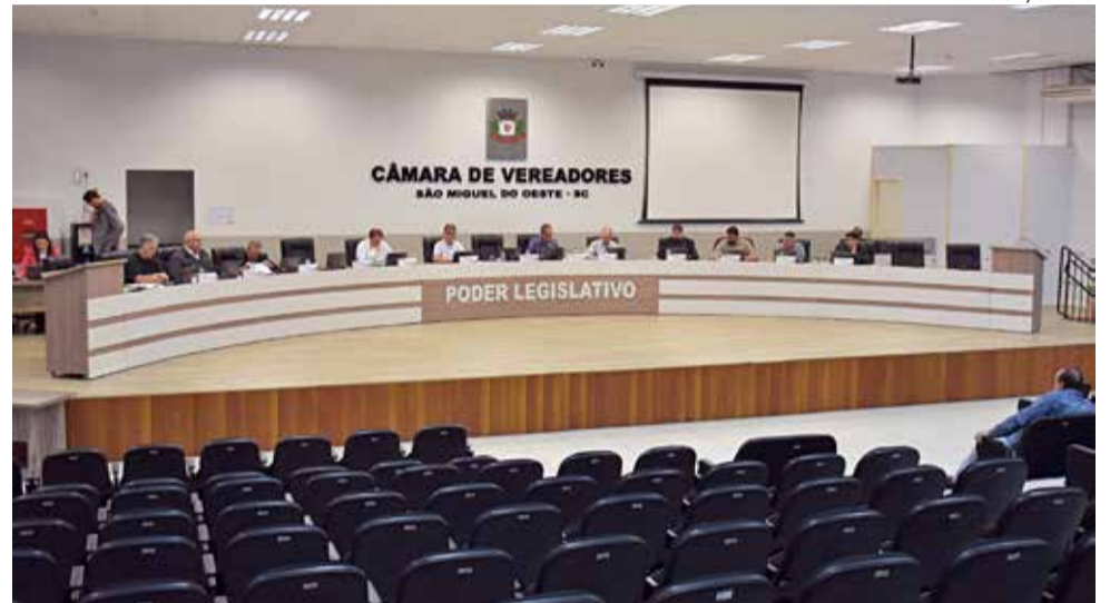
Projeto foi aprovado na sessão de terça-feira, em primeiro turno

O projeto estabelece que a instalação e o funcionamento de fornos crematórios poderão ser feitos por meio de concessão/permissão e as empresas concessionárias para esse fim ficarão sujeitas à permanente fiscalização do município. Também prevê que a atividade de crematório