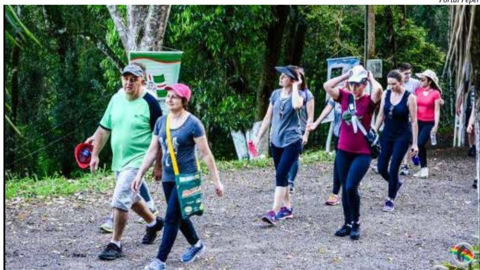
Iniciativa volta a acontecer depois de dois anos