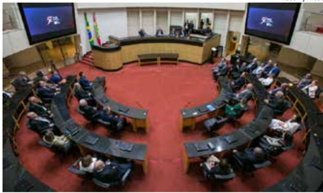
Sessão especial foi realizada na noite de segunda-feira