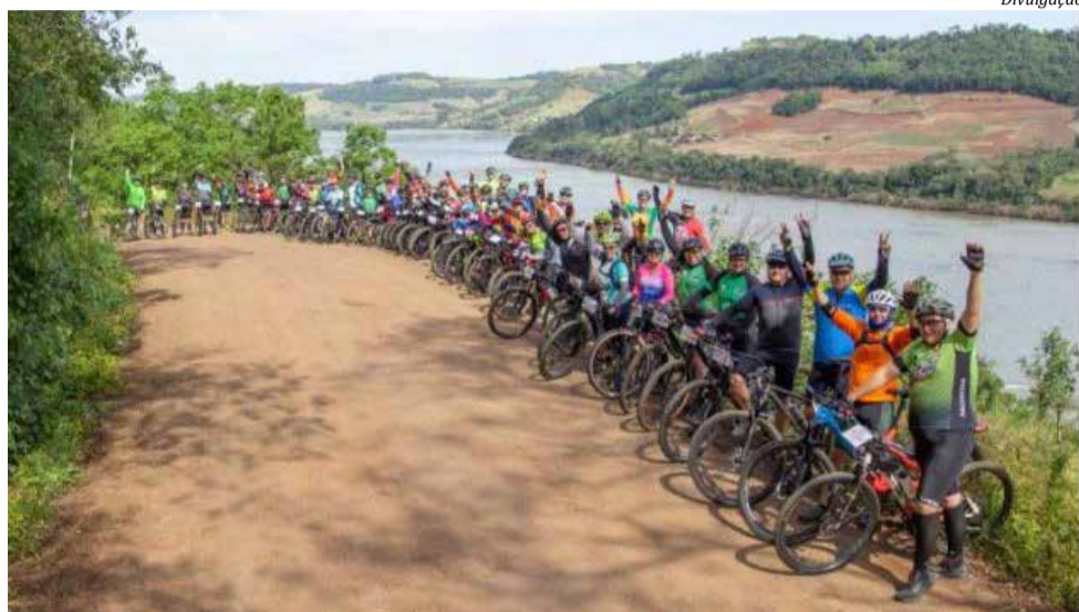
Trajeto, parte margeando o Rio Uruguai, somou 145 quilômetros em dois dias