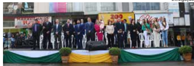
Autoridades civis e militares prestigiaram o desfile na Avenida Araucária