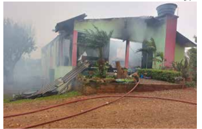
Ocorrência foi registrada sexta-feira, na Linha Bela União