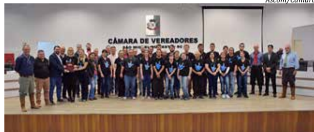
Moção de aplauso foi entregue a membros da Associação dos Pais e Amigos dos Surdos

O texto autoriza a Câmara e o Município a contratar intérpretes de Libras e firmar convênios ou parcerias com órgãos e entidades públicas ou privadas que atuem no