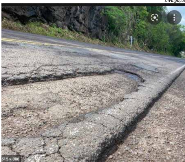
Trechos mais críticos devem estar recuperados em cerca de 50 dias

O trânsito de veículos não deve ser interrompido para as obras, mas a