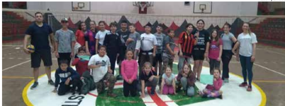
Atividades esportivas gratuitas são para crianças e adolescentes de 10 a 16 anos