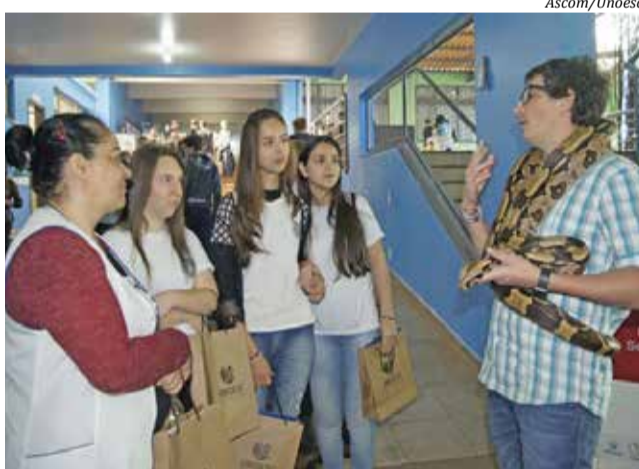
Participantes visitando a Unoesc São Miguel do Oeste durante a Feira das Profissões em 2019

"Estamos preparando grandes eventos e ficaremos muito felizes em receber toda a comunidade. Ser-