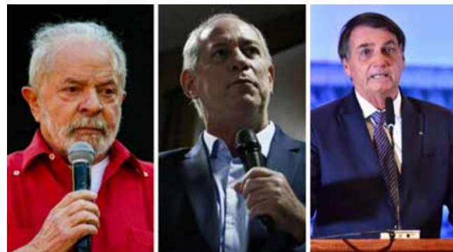
Lula, Jair Bolsonaro e Ciro Gomes são os candidatos mais competitivos da corrida presidencial

O político não pode ser morno. Nunca. Ele mexerá com a emoção das pessoas. Fernando Henrique Cardoso, por exemplo, sempre teve esse jeitão de lorde. Sujeito fino, bem preparado, habituado a viver em bons ambientes. No início, levava para a tribuna esse mesmo comportamento. Se, por um lado, se mostrava bastante natural, por outro, faltava a ele a demonstração de envolvimento com as causas que abraçava. Falava dos problemas de segurança do país como se tratasse da segurança do prédio onde residia. Ao perceber que esse estilo brando não estava levando a lugar nenhum, mudou a maneira de transmitir a mensagem e passou a fazer discursos mais entusiasmados.