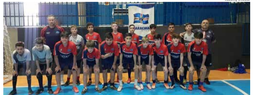
Futsal de Guaraciaba foi uma das entidades esportivas beneficiadas pelas atividades

O projeto também é realizado nos municípios de Guaraciaba (futsal e voleibol), Anchieta (futsal e voleibol) e São João do Oeste (futebol de campo e futsal). Em cada um desses municípios, há acadêmicos de Educação Física e professores supervisores atuando com as crianças e os adolescentes visando fomentar ainda mais o esporte na região.