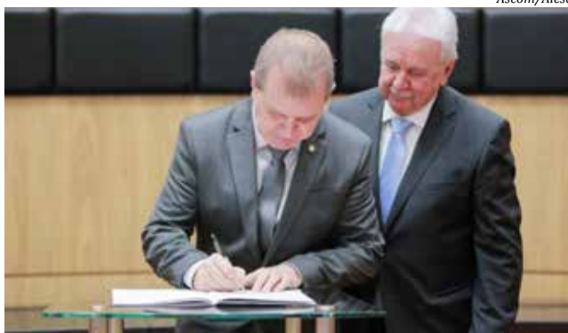
Posse aconteceu em solenidade na manhã de sábado

Sobre a condução dos trabalhos na Alesc, ele afirmou que pretende dar continuidade à linha adotada por Sopelsa, buscando conferir agilidade na votação dos projetos, enxugando