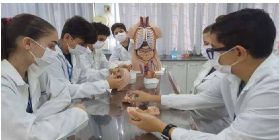
Estudantes têm aulas em laboratórios modernos e inovadores

Além de oportunizar educação de qualidade