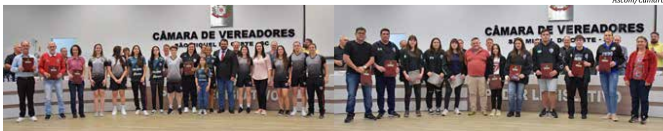
Judocas do município e professores de Educação Física receberam homenagens na sessão