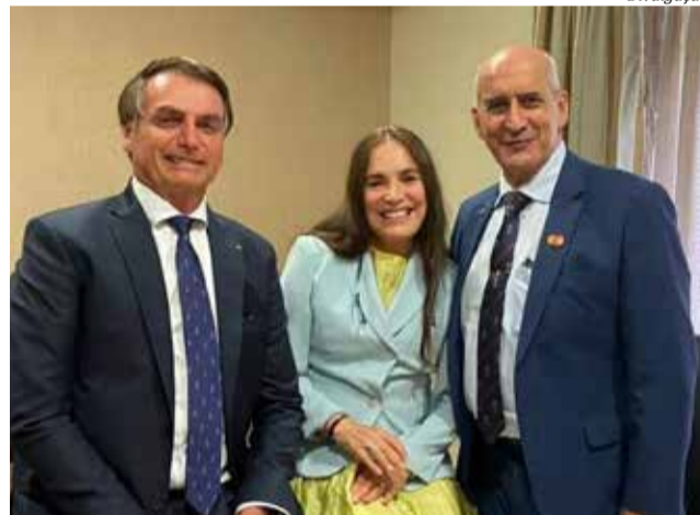
A atriz Regina Duarte, secretária especial da Cultura, e o presidente Jair Bolsonaro

Em vídeo postado nas redes sociais, a atriz manifesta seu apreço pelo presidente Jair Bolsonaro, dizendo que ele é um exemplo de democracia para o mundo inteiro, questionando os artistas que assinaram e leram o manifesto da Faculdade do Largo de São Francisco. Ao seu ver, uma gente interessada. Ela pergunta: “De que democracia essa gente está falando?” Ela mesma responde: “É o buraco esquerdista em que a Argentina se meteu”. Ela repete: “Eu tenho medo”. Regina Duarte ressurgiu para ficar ao lado de Bolsonaro contra Lula. Afirma que fazia algum tempo que não tinha esse sentimento de medo, mas agora foi inevitável, porque, como ela diz, o Brasil corre o risco de perder toda a estabilidade que foi conquistada pelo governo Bolsonaro.