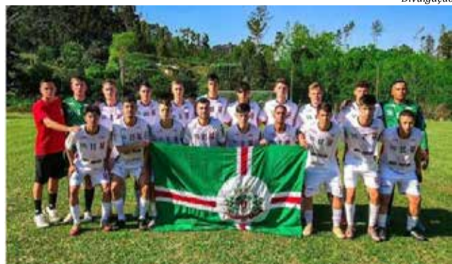
Guarani conquistou terça-feira, 30, o título de campeão do futebol de campo da fase regional dos Joguinhos Abertos

Enquanto isso, o Joni Gool/Terra Viva conquistou, também terça-feira,