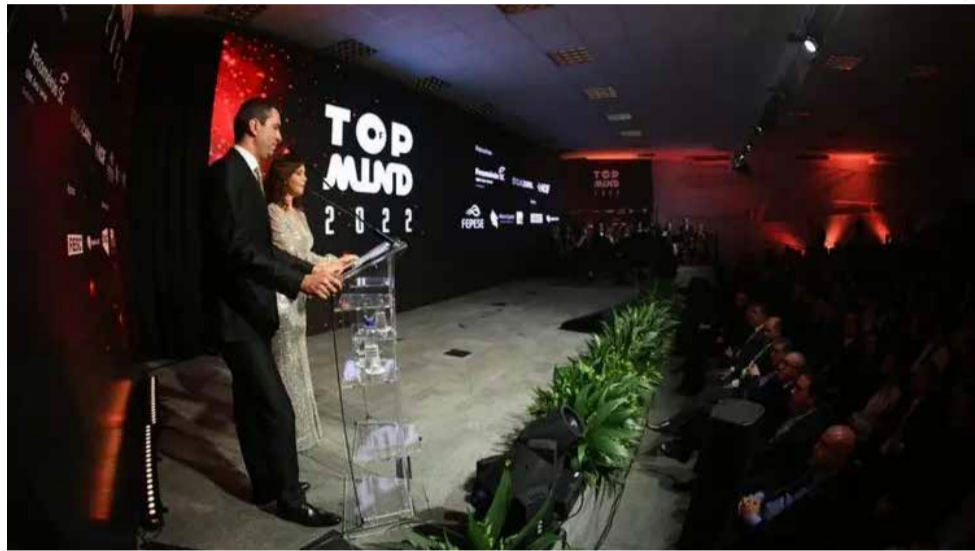
Premiação da 27ª edição do Top of Mind ocorreu quinta-feira, 25, na Federação das Indústrias de Santa Catarina

Este é o primeiro ano em que o Sicredi assume