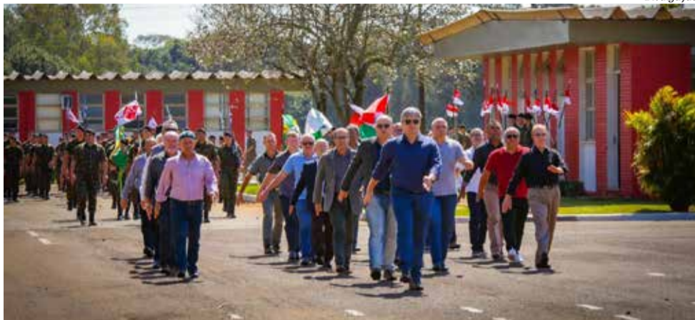
Em um dos pontos altos, os veteranos do Regimento realizaram um desfile em continência ao comandante

Em um dos pontos altos, os veteranos do Regimento realizaram um desfile em continência ao comandante, relembrando e enaltecendo os valores e o patriotismo adquiridos nos tempos de caserna. Uma das tradições que marca a data é o plantio de uma árvore, um ipê, que fará parte do bosque do