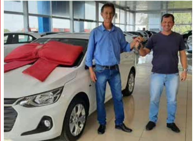
Automóvel Onix Plus foi entregue sexta-feira