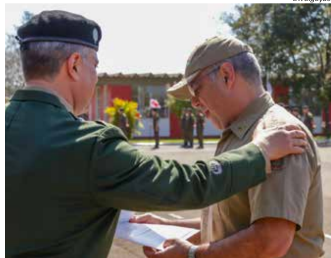
Durante a solenidade, foram entregues Medalhas e Diplomas

Recentemente, foi empregado em diversas ações de apoio durante a pandemia que assolou o mundo. Atualmente, o 14º RC Mec conta com as modernas viaturas Guaranis em sua frota e de militares que permanecem em constante prontidão, fortalecendo e consolidando a presença do Estado no Oeste catarinense.