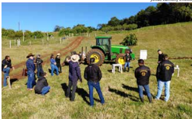
Demonstração de máquinas e equipamentos para preparo do solo