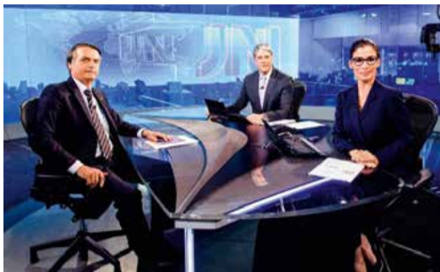
O nervosismo mora ao lado