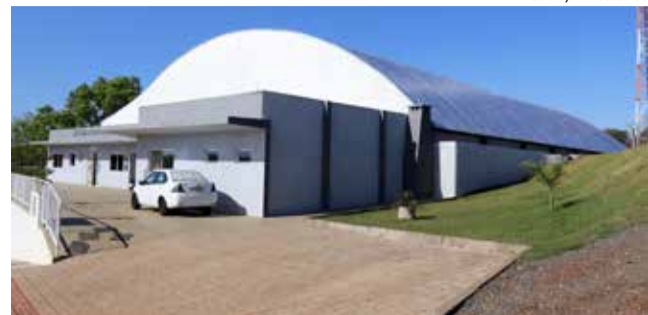
A instalação da manta proporciona a impermeabilização do telhado, o que resolve as infiltrações em dias chuvosos