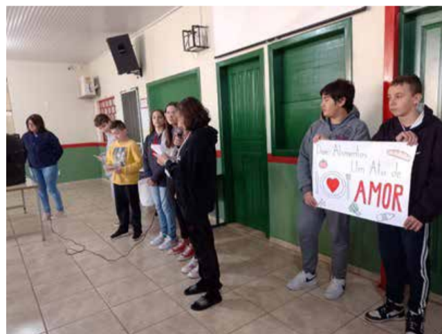
Momento da apresentação da atividade