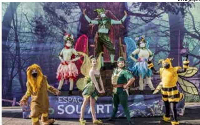
Espetáculo percorre nove cidades de Santa Catarina

apresentadas situações de conflito que buscam a reflexão sobre os conteúdos principais, buscando envolver o público numa história divertida e informativa. Com atuação nos três estados do Sul do Brasil e