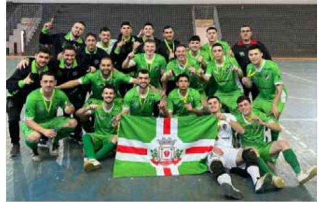
Equipe representa São Miguel do Oeste nos Jogos Abertos de Santa Catarina

Durante a campanha do JASC, o São Miguel Futsal/Joni Gool venceu Des-