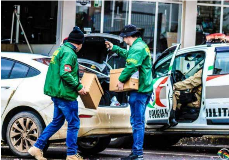
Operação teve o objetivo de coibir a prática de crimes de venda ilegal de armas e munições

Foram cumpridos 40 mandados de busca e apreensão nas comarcas de São Miguel do Oeste, Maravilha, Descanso e Mondai. Também foram deferidas medidas cautelares de suspensão de atividade econômica de empresas utilizadas para a prática dos fatos. O nome das empresas e pessoas envolvidas não foram divulgadas pelas auto-