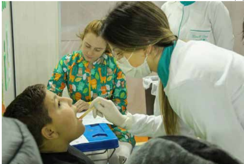
Acadêmicos do sexto e dos oitavos semestres do curso fizeram um levantamento de informações, com a finalidade de verificar a condição de saúde bucal dos alunos