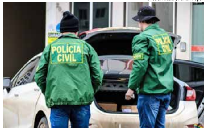
Cristian Lösch/Portal Peperi