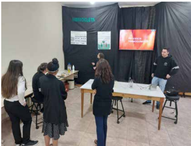
A apresentação dos trabalhos mobilizou os alunos.