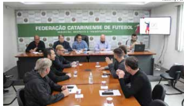
Detalhes da competição foram definidas em reunião segunda-feira

O formato da competição é eliminatório em três fases: quartas de final, semifinal e final, com partidas de ida e volta até a grande decisão. Na fase inicial os campeões enfrentam os vice-campeões regionais e necessariamente em regiões