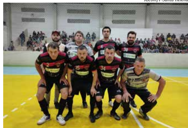
Amigos do Pombo é uma das equipes classificadas

No dia 13, sábado, serão realizados mais jogos decisivos, mata-mata das semifinais. No Veterano, Bela Vista X D&C Rural e Mercado Mileski X Consultório/Cantina. No Feminino, Bela Vista X Feio a Mão e Lumack X Baixada Carijó. No Masculino Livre, Bela Vista B X Avante FC e Brondis FC X Amigos do Pombo.