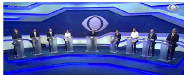
No domingo 07, debateram os postulantes ao governo paulista

Vale indagar novamente: por que os políticos custam tão caro aos cofres públicos? Por que necessitam de tantos assessores — a maioria “aspones” (gíria para assessores de p... nenhuma)? O que justifica uma máquina legislativa tão dispendiosa? Para que tantos políticos profissionais e seu séquito mal ou bem remunerado?