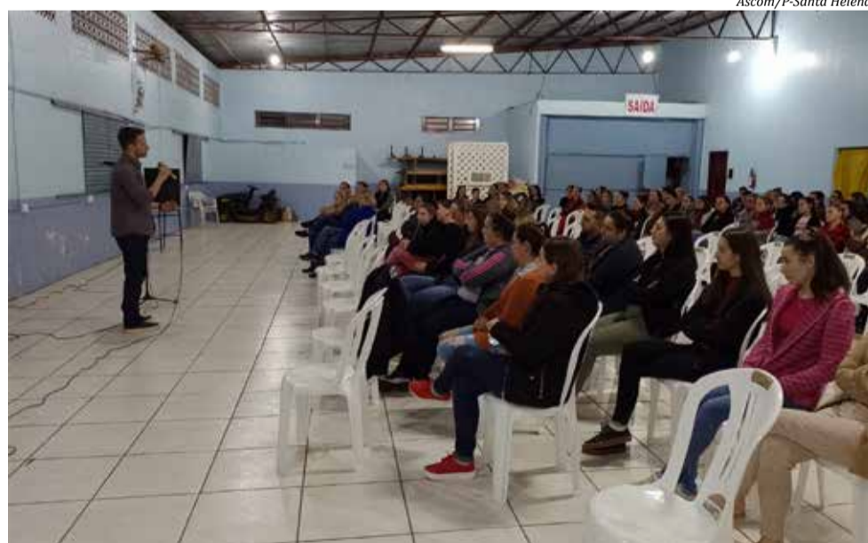
Palestra teve boa participação da comunidade

nistério Público quer resolver os problemas, mas é necessário o comprometimento das famílias. Outra situação abordada e muito presente nas famílias são os acessos dos menores de idade à internet. O promotor afirma que a família deve acompanhar e monitorar o que