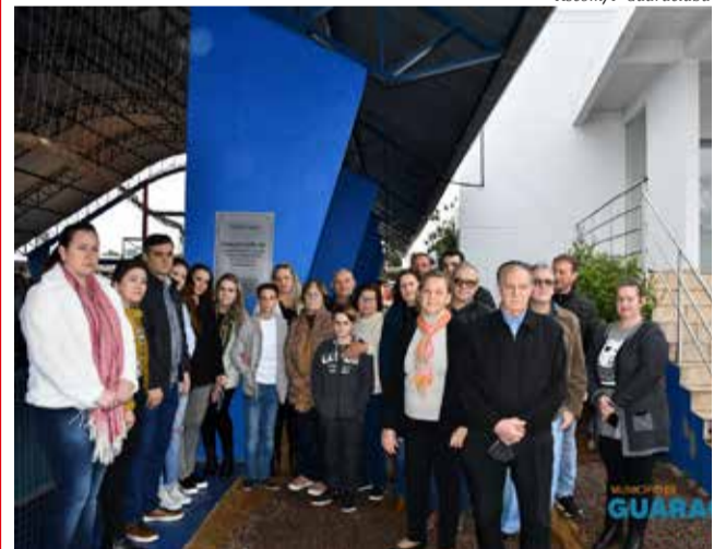
Famílias participaram da homenagem, juntamente com os alunos da escola e autoridades