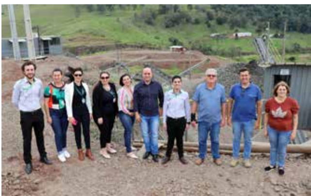
Conselheiros Municipais de Turismo e Desenvolvimento Econômico de Descanso

O Britador Volta Grande, localizado às margens da BR 282, no qual foram investidos R$ 10 milhões está operando normalmente. Atualmente, o britador está gerando 14 empregos diretos e 22 indiretos e produz pó de brita, brita 1, brita 2, pedrisco, base e rachão, podendo chegar a produzir 120 toneladas de material por hora.