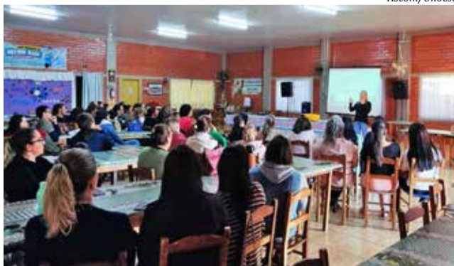
Professores participaram de diversas oficinas e palestras

Os professores participaram das oficinas e palestras Literatura na Escola; Alfabetização e Letramento; Projeto de Vida; Planejamento Interdisciplinar; Deslocamentos Tectônicos da Atualidade e a Escola; Trabalho em Equipe e Relações Interpessoais; Projeto Político Pedagógico; Educação Especial; Estratégias para o Ensino de Espanhol; Transtorno do Espectro Autista e Trans-