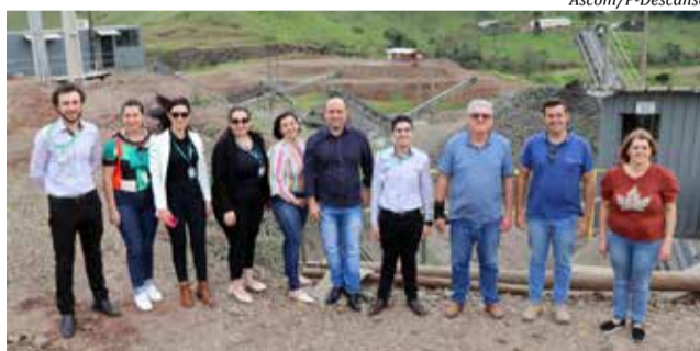
Os membros do Conselho conheceram as etapas de produção das diferentes pedras

Atualmente, o britador está gerando 14 empregos diretos e 22 indiretos e produz pó de brita, brita 1, brita 2, pedrisco, base e rachão, podendo chegar a produzir 120 toneladas de material por hora. Conforme Schneider, a intenção é investir ainda mais e expandir a produção.