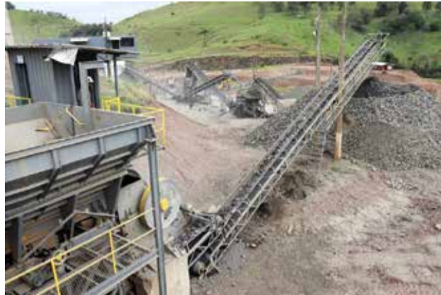
Britador Volta Grande em operação