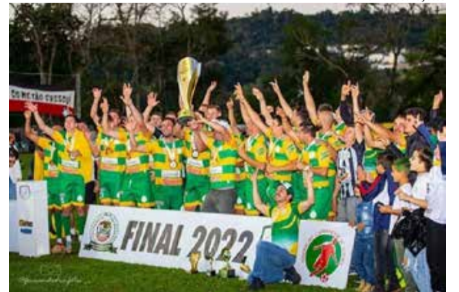
Ypiranga levantou a taça depois de empate em 2 X 2 e vitória nos pênaltis

Agora, as duas equipes vão representar o Oeste na etapa estadual do campeonato amador. Os times devem ser reforçados. O Cometa, por exemplo, está acertando com um lateral esquerdo, um zagueiro e um