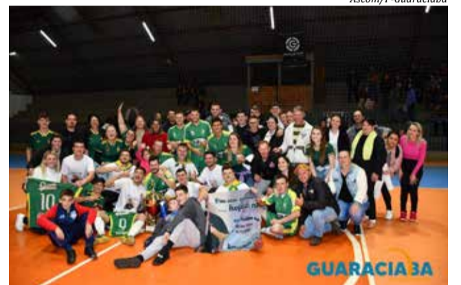
Equipe de Itapajé conquistou a taça ao vencer o Tupy por 10 X 5