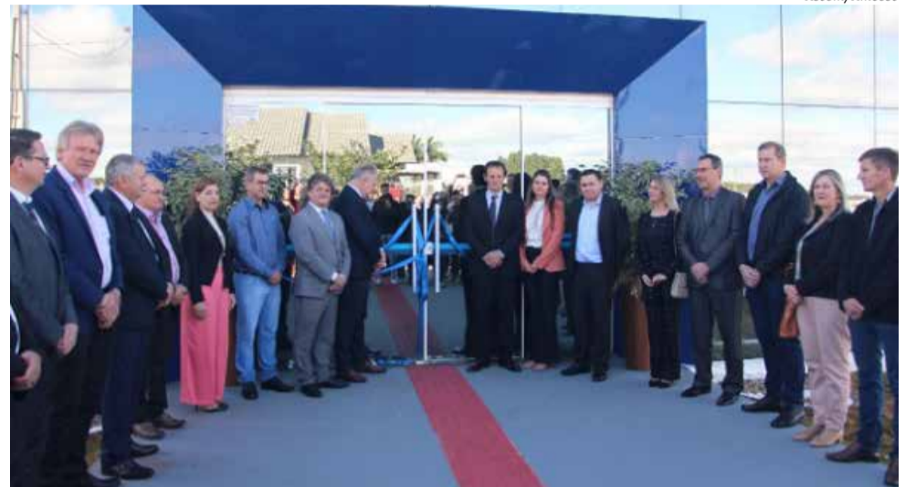
Solenidade de inauguração foi realizada em frente à nova estrutura, com a presença de prefeitos e lideranças da região