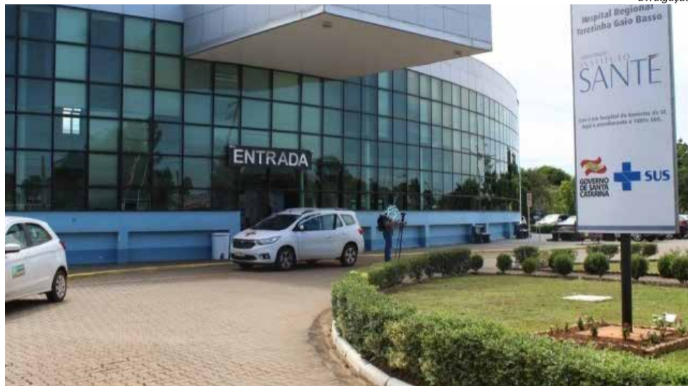
Estado terá que instalar sete leitos de Unidade de Terapia Intensiva Neonatal no Hospital Regional Terezinha Gaio Basso

Na decisão, o Juízo da 1ª Vara Cível da Comarca de São Miguel do Oeste adverte ao Estado que, se deixar de cumprir a sentença, estará incidindo nas penas de litigância de má-fé no caso de deixar injustificadamente de