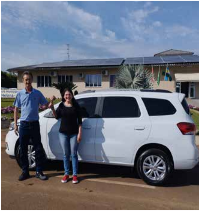
Prefeito Blásio Hickmann entregou o segundo veículo à Secretária da Saúde