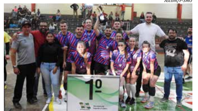
Misto Quente foi a vencedora do campeonato depois de 29 jogos