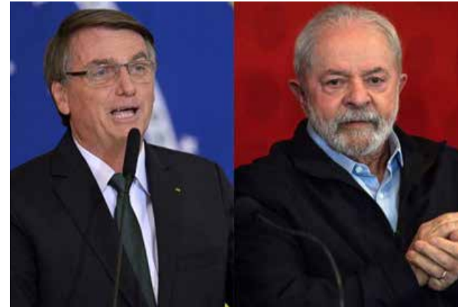
Jair Bolsonaro e Luiz Inácio Lula da Silva

Neste ano os desfiles militares estarão de volta, depois da pandemia. Esse fato vai atrair mais gente para a comemoração. Bolsonaro tem dito aos auxiliares mais próximos, aqueles que ainda merecem confiança, que o Sete de Setembro não será só festejos, haverá manifestações políticas também, com concentrações especialmente em São Paulo, Rio de Janeiro, Brasília e várias outras