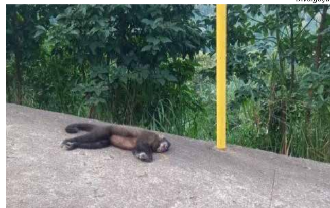
Animal foi encontrado por moradores nas proximidades do Bairro Floresta