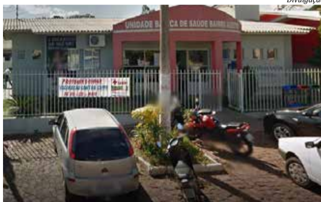
Sala de Vacina do Posto de Saúde do Bairro Agostini foi reativado

Outros pontos estratégicos terão vacinas disponíveis a partir de 08 de agosto um dia da semana. Nas segundas-feiras o posto de saúde São Gotardo, nas terças-feiras o Santa Rita, nas quartas-feiras o São Luiz, nas quintas-feiras o Salet e nas sextas-