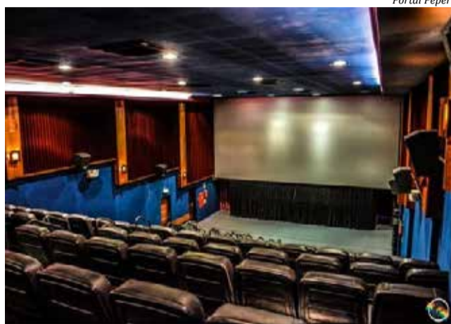
Os debates serão transmitidos no auditório do Cine Peperi

O primeiro debate do projeto eleições 2022 será no dia 27 de agosto com candidatos a deputado estadual. No dia 03 de setembro, o programa vai reunir os candidatos a deputado federal. O debate para se-