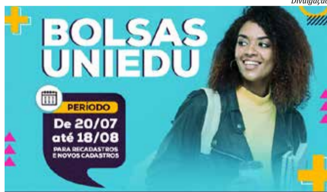
Uniedu oferta bolsas de graduação de até 100% para estudantes do ensino superior

A lista de documentos necessários, o passo a passo para o cadastro e o edital estão disponíveis no portal do Programa. Na inscrição, o estudante fornece as informações pessoais e também deve anexar a documentação que comprova sua situação socioeconômica. Todo o processo é feito pelo site, não sendo necessário encaminhar os comprovantes ao SAE.