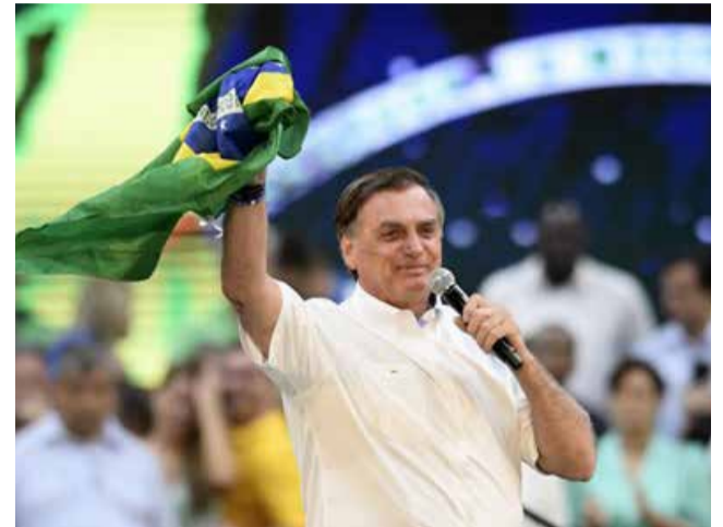
Presidente falou sobre obras inacabadas por governos anteriores e corrupção na Petrobras

O presidente também mencionou políticas públicas e investimentos feitos na área social, como o Auxílio Brasil e os novos benefícios aprovados com a PEC das Bondades, e seus impactos para a economia brasileira. “Tenho certeza, teremos deflação no corrente mês. Eu