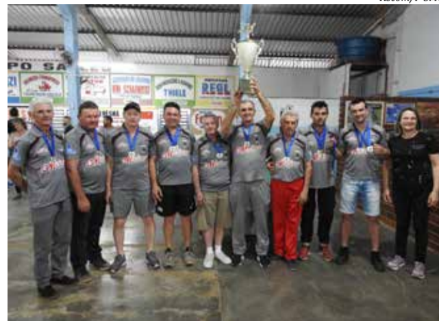
Equipe de Campos Salles levantou a taça