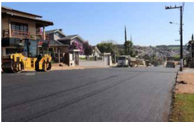
Rua Ludovico Wronski em fase final do asfaltamento

A vencedora da licitação, Gaia Rodovias, executou a obra de asfaltamento da rua Ludovico Wronski onde foram investidos R$ 449 mil, sendo R$ 400 mil de emenda parlamentar articulada pela bancada do MDB municipal e o restante de recursos vinculados.