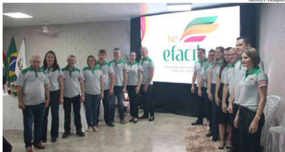
14ª edição da feira foi lançada em solenidade sexta-feira

Na Indústria e Comércio, pontuou-se sobre a locação de estandes, tanto internos quanto externos,