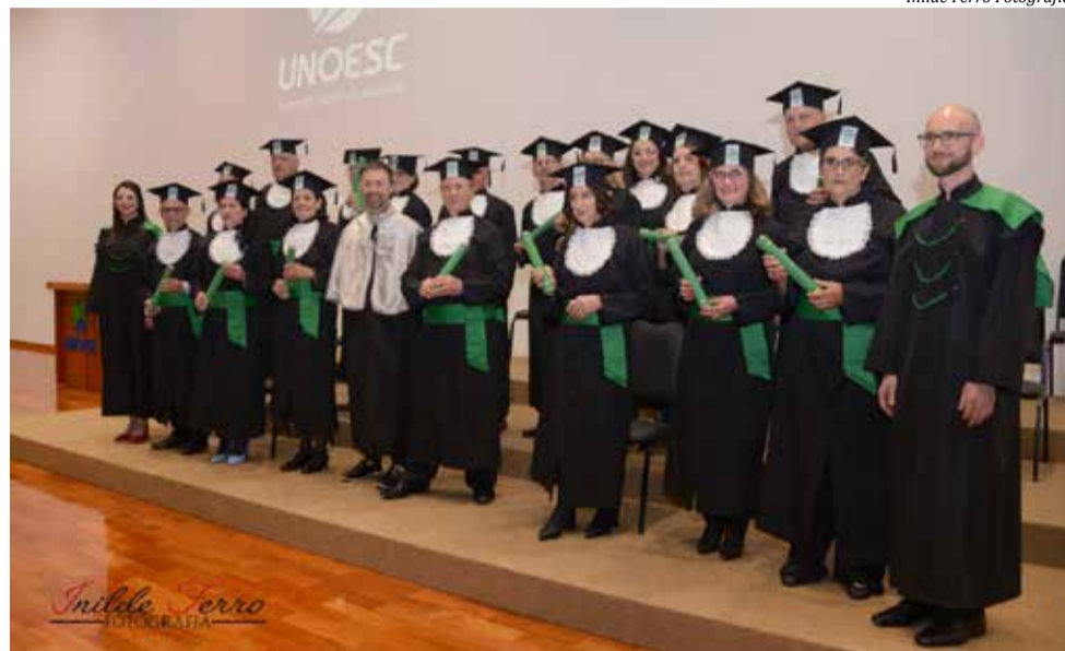
Formatura dos 17 alunos foi realizada no Centro Cultural da Unoesc São Miguel do Oeste