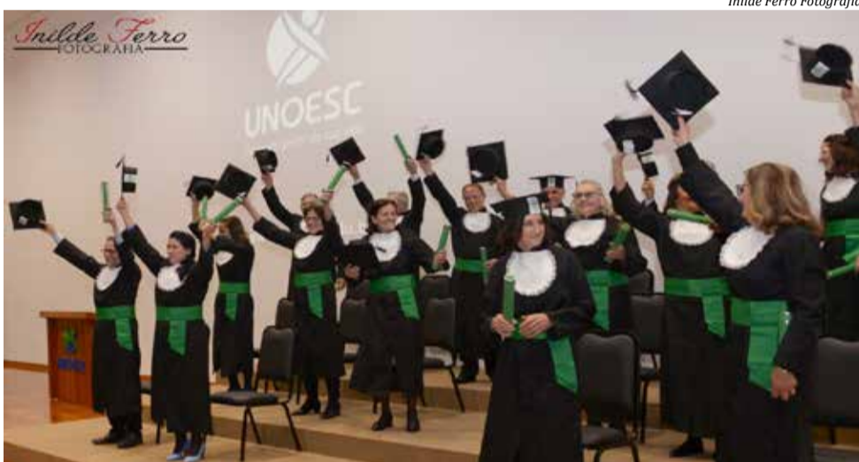
Formandos comemoram após 18 meses de estudos e também diversão