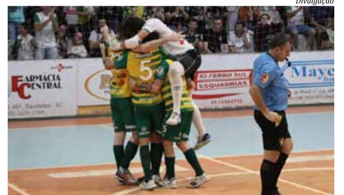
Equipe de São Miguel do Oeste venceu com dificuldades em São Domingos

mas venceu o Independente por 3 X 2. Na cidade de São Carlos, a Associação São Carlos e Luzerna Futsal empataram em 2 X 2. E em Faxinal dos Guedes, a ADC Futsal/Sicredi derrotou a AD Modelo por 3 X 2. Os jogos da volta das quartas de final acontecem sábado, 30, e no dia 06 de agosto. No dia 06, o São Miguel Futsal/Joni Gool recebe o Independente.