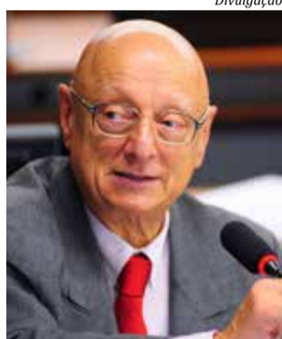
Esperidião Amin (PP)