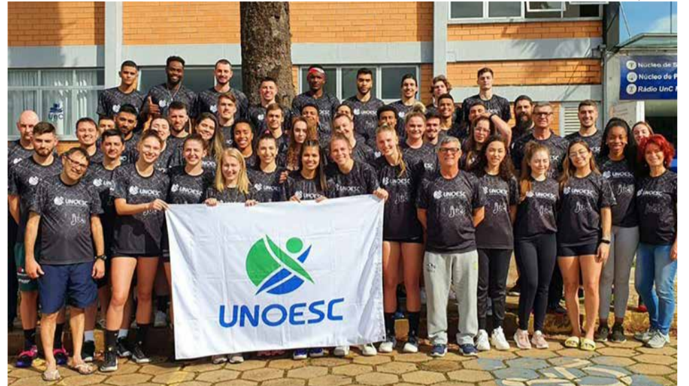
Equipe de São Miguel do Oeste venceu com dificuldades em São Domingos