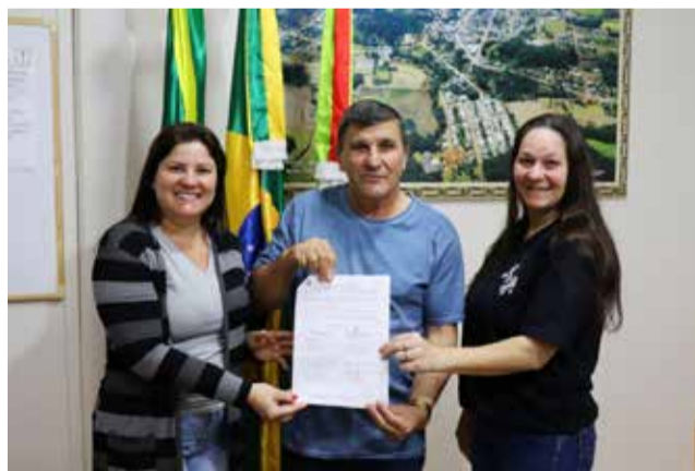
Momento da entrega da autorização

As dirigentes da Grupo de Patinação agradecem à Administração Municipal por esses recursos que serão muito bem aplicados. Até então, o grupo vinha se mantendo com recursos próprios e agora essa ajuda é muito bem-vinda.