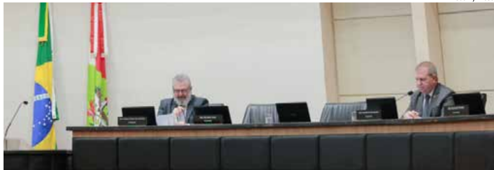
Anúncio foi feito pelo deputado Maurício Eskudlark (D), vice-presidente da Assembleia Legislativa