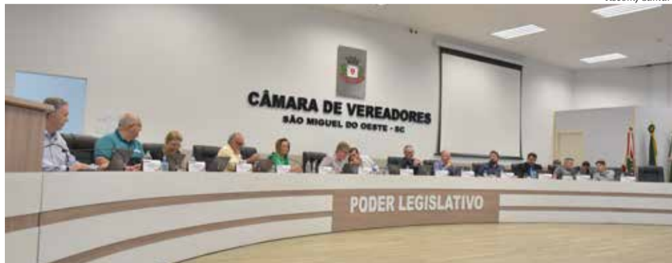
Projeto foi aprovado por maioria na Câmara de Vereadores