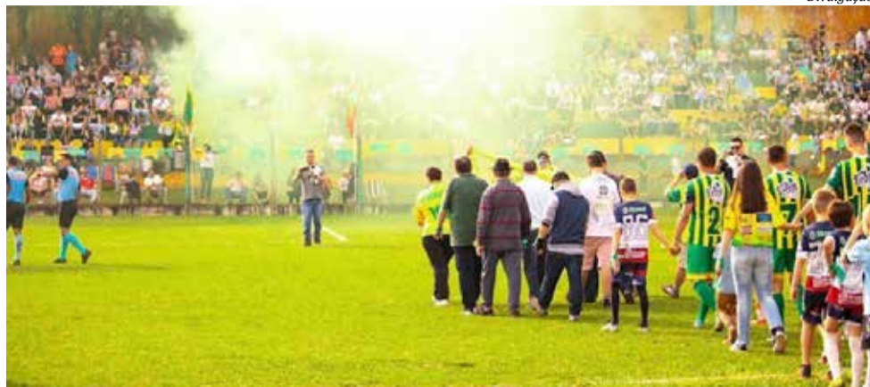
Jogo de ida no último domingo teve casa cheia em São José do Cedro