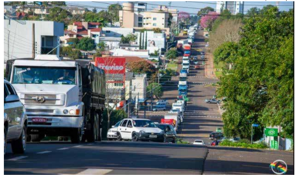
Centenas de veículos participaram do desfile em São Miguel do Oeste na manhã de domingo