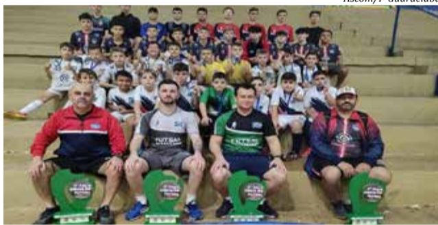
Os atletas das escolinhas de Guaraciaba ficaram em segundo lugar na competição

A equipe da Associação dos Pais e Amigos do Futsal de Guaraciaba (Apaf/GBA) participou nas categorias, sub-9, sub-11, sub-13 e o sub-15. De acordo com a direção da Apaf, as escolinhas de Guaraciaba obtiveram resultados excepcionais na competição, ficando em segundo lugar nas quatro categorias.