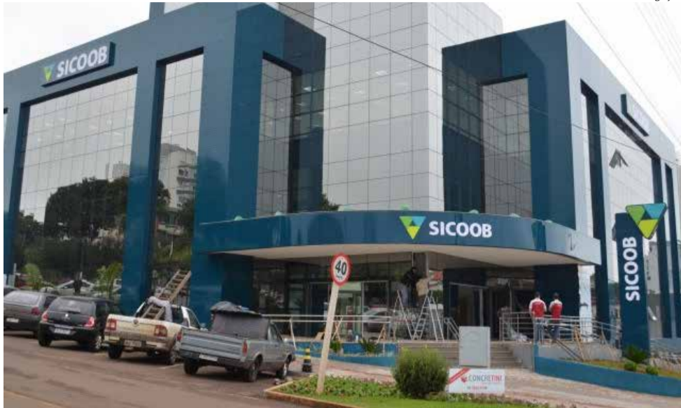
33 anos depois, o Sicoob São Miguel é uma das maiores cooperativas de crédito do Brasil

“É uma honra e uma alegria enorme estar à frente da cooperativa em praticamente toda sua história e perceber essa relação de confiança, união e companheirismo que há entre os associados, funcionários, diretorias e conselhos. Isso enaltece ainda mais a nossa responsabilidade com o desenvolvimento e perenidade do Sicoob São Miguel”, destaca.