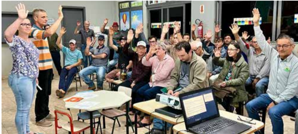
A negociação foi aprovada por unanimidade durante a assembleia extraordinária

A então Associação 25 de Maio nasceu em 1996, da união de dezenas famílias assentadas. A indústria foi montada com foco o mercado local. Logo surgiram associações semelhantes em assentamentos da reforma agrária de Anchieta e de São José do Cedro. A Cooperoeste foi criada meses depois para industrializar e comercializar a produção dessas comunidades em volume e formato capaz de atender a outros mercados