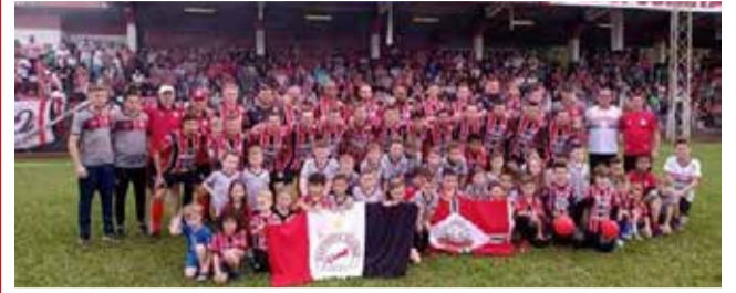
Cometa enfrenta novamente o Aliança com vantagem sobre o adversário