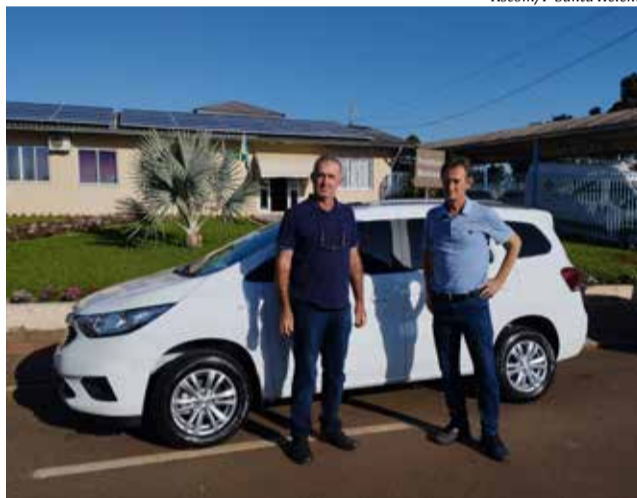
Presidente da Câmara, Claudemir Gonchoroski (E) e prefeito Blásio Hickmann

Conforme o prefeito Blásio Hickmann, também está em processo de licitação a aquisição de uma Van de transporte de passageiros. Antes disso, foi efetuada a compra de uma ambulância, que já está à disposição para ser usada. “Renovar a frota de veículos para o transporte de pacientes é uma das metas da administração municipal. Com veículos mais novos e modernos, o transporte é feito com mais conforto e segurança”, afirma o prefeito.