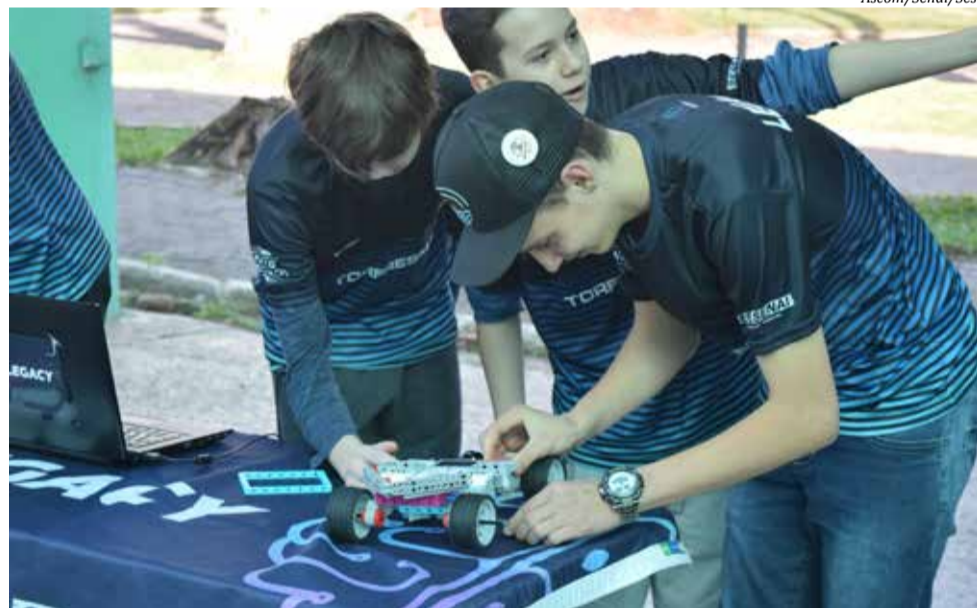
O time de robótica do Sesi Senai foi fundado em 2017 para participar de competições

O time de robótica do Sesi Senai foi fundado em 2017 para participar de competições e no decorrer dos anos passou por diversas formações e conquistou prêmios im-