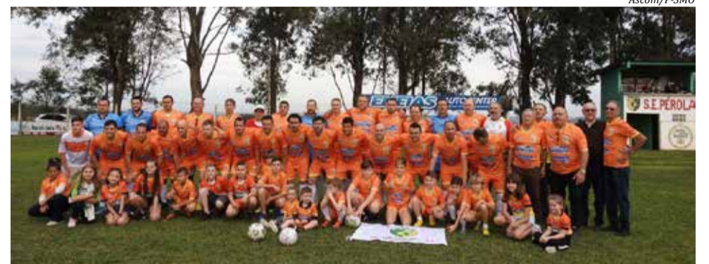
Esporte Clube Pérola, que sagrou-se campeão com o resultado de 1 x 1 no jogo de ida e 2 x 1 no jogo de volta