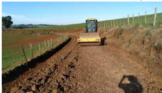
Trabalhos nas estradas do interior são intensificados