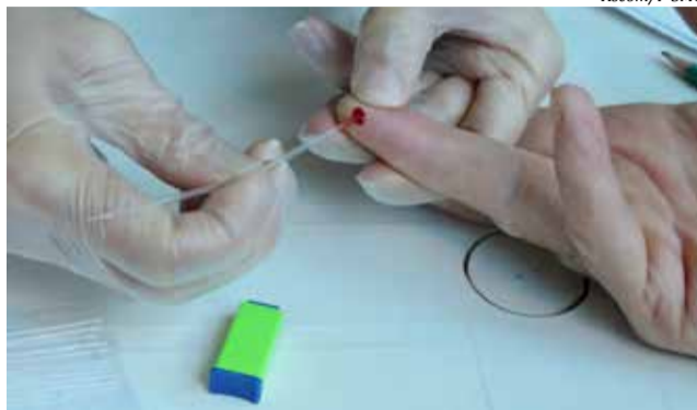
Teste fica pronto em apenas 20 minutos

nistério da Saúde, as hepatites virais B e C afetam 325 milhões de pessoas no mundo, causando 1,4 milhão de mortes por ano. Sendo a segunda maior causa de morte entre as doenças infecciosas.