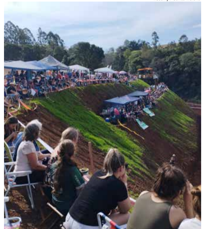
Público compareceu em massa para assistir a competição da 3ª etapa da Copa Oestina de Veloterra