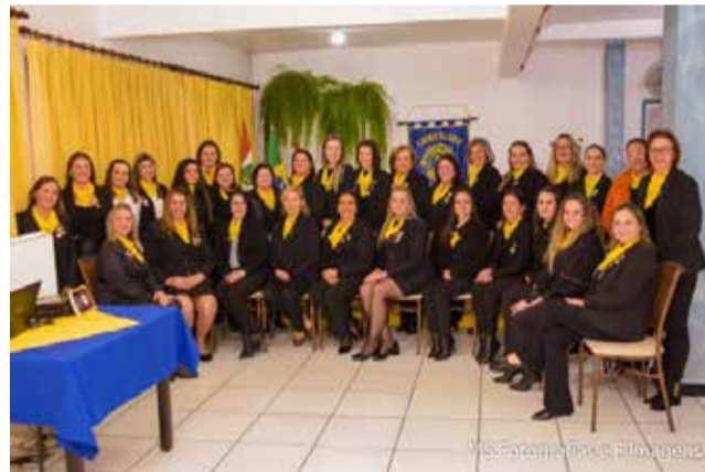
Integrantes do Lions Clube de Descanso Mulher

Neste ano, o Dia C aconteceu no dia 6 de julho e trouxe como lema “Cooperar é uma atitude do nosso dia a dia”, estimulando-nos a repensar nossa rotina e priorizar as boas atitudes para, juntos, construirmos um futuro melhor para todos. O evento é uma idealização da Organização das Cooperativas Brasileiras (OCB) e mobiliza milhares de entidades no país.