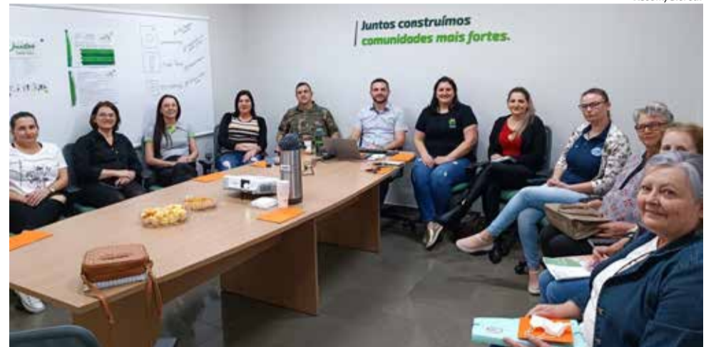
Nove projetos de entidades de São Miguel do Oeste foram contemplados com recursos

Na área de atuação da Cooperativa, foram recebidas inscrições de 234