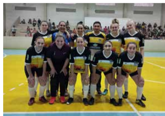
No feminino, a liderança é do Bela Vista

Na Chave A, a liderança é de Brondis e Cantina com 9 pontos, Amigos do Pombo, Bela Vista A e Real FC tem 3 pontos e a equipe do Vila Nova ainda não pontuou. Na Chave B, a liderança é de Bela Vista B com 9 pontos, Liberdade e Amigos da Lenda tem 6, Avante e