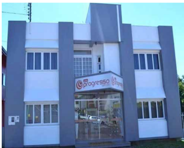
A emissora operará na frequência 89.5

Na última quinta-feira (23), a Rádio Progresso AM 590, foi autorizada pela Anatel (Agência Nacional de Telecomunicações) para operar em FM na frequência 89.5. A sigla FM vem do inglês "frequency modulation" e que significa Modulação em Frequência se refere à transmissão de ondas com variação da frequência, proporcionando boa qualidade de som.