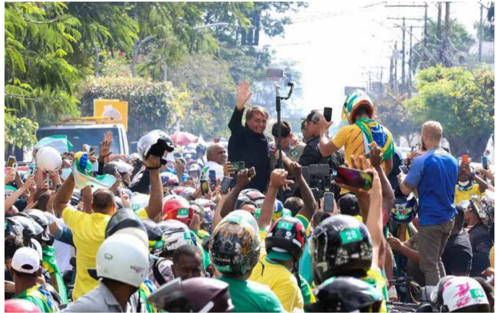
Jair Bolsonaro participa de motociata em Cruz das Almas, na Bahia

Por isso, é fundamental que a esquerda cleptocrática não retorne ao poder, porque ela representa o atraso, a corrupção e a escravidão do brasileiro à ditadura criminosa.