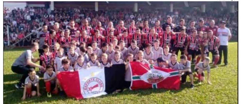
Cometa é uma das equipes classificadas para as semifinais do Estadual de Amadores, Fase Oeste