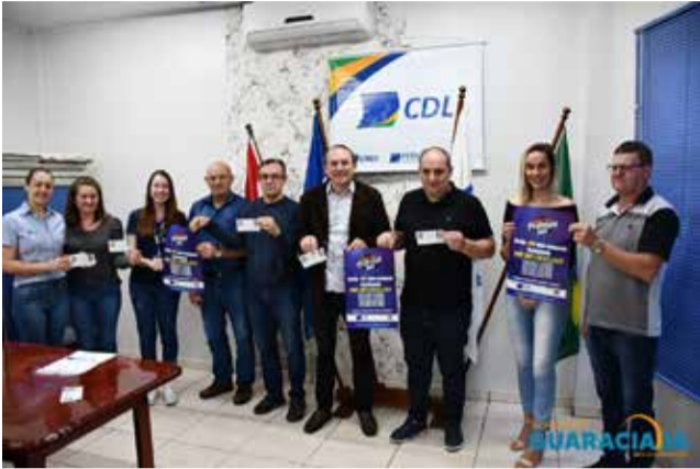
Campanha foi lançada segunda-feira pela CDL e prefeitura