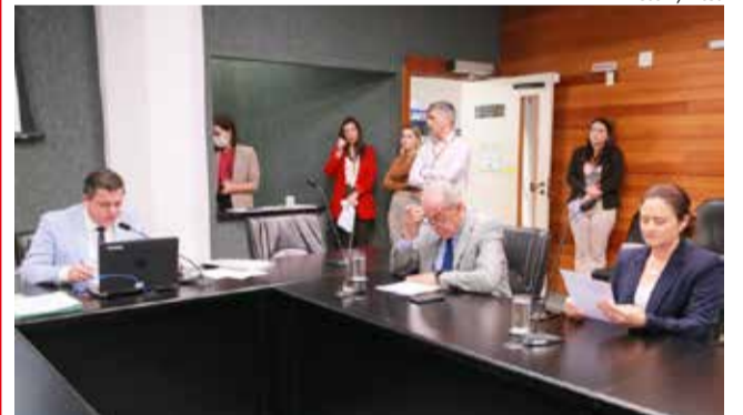
A reunião da Comissão de Turismo aconteceu na manhã desta terça-feira