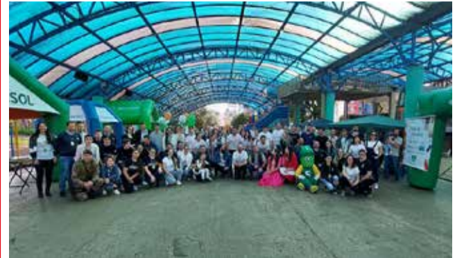
Cooperativas e entidades desenvolveram atividades no Dia Internacional do Cooperativismo