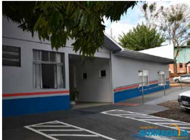
Foram investidos cerca de R$ 346 mil nas obras de reformas e ampliação