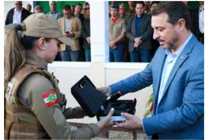
Governador Carlos Moisés participou da entrega de viaturas, armamentos e equipamentos.

tóricos que estão sendo feitos na Segurança Pública foram destacados pelo governador. Citou o programa SC Mais Segura, o maior volume de recursos da história do Estado na área. Serão R$ 343