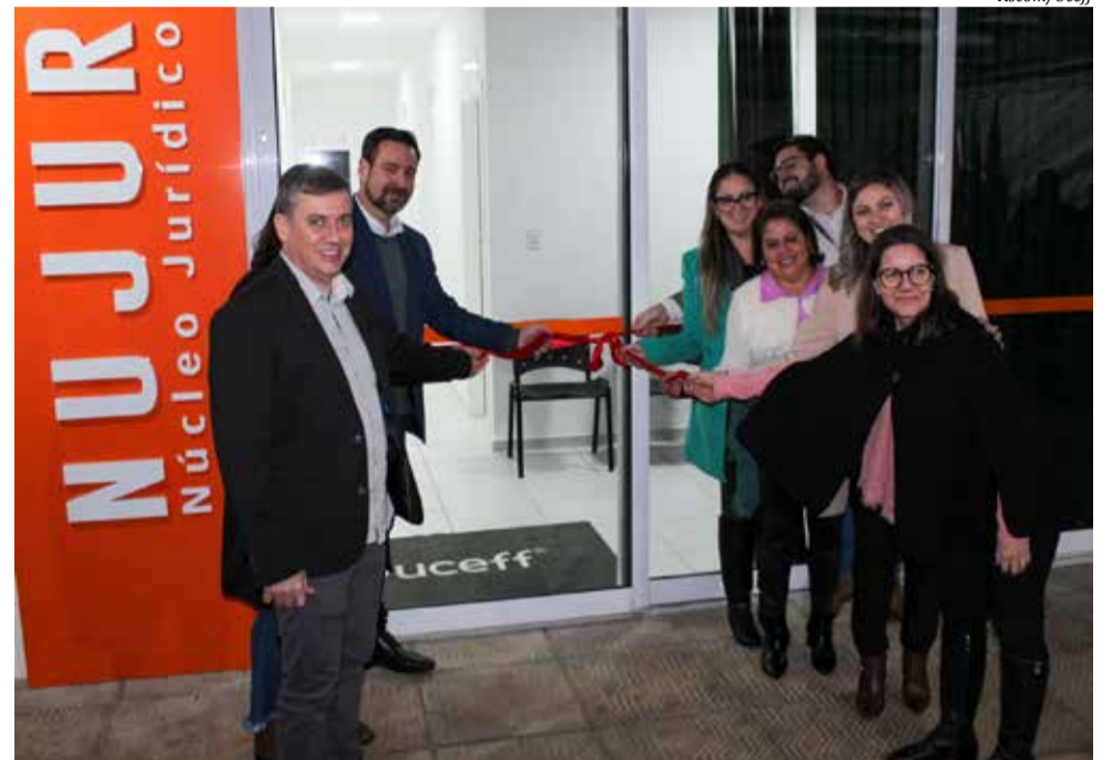
Novos espaços foram inaugurados na semana passada

O curso de Psicologia iniciou suas atividades neste ano com o ingresso da primeira turma de calouros. O curso de Direito, que já formou 285 bacharéis, iniciou sua trajetória no segundo semestre de 2006, e desde 2010 atua com o Serviço de Assistência Judiciária Gratuita (Sajug), inicialmente instalado no centro da cidade e mais