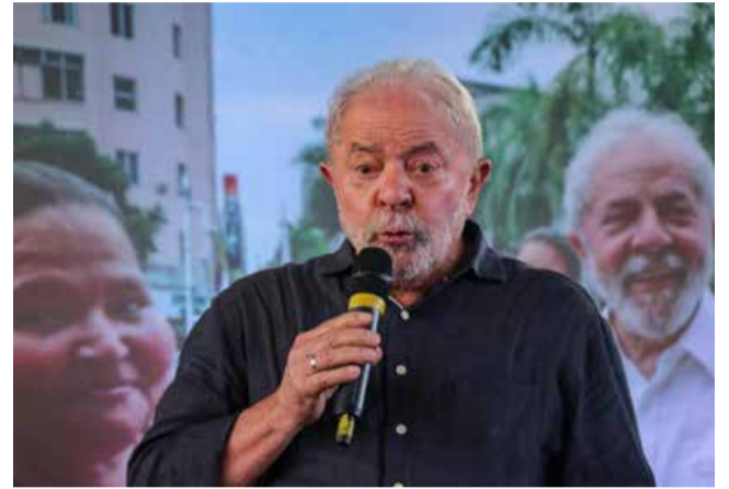
Lula é o candidato do PT à Presidência para as Eleições 2022

Já o PT explica que muitas propostas foram deixadas de lado porque também são defendidas pelo candidato do PDT, Ciro Gomes. Integrantes da equipe de coordenação do programa de governo reclamam que não foram consultados sobre a redação do documento antes de encaminhá-lo para os partidos aliados. O presidente nacional do Solidariedade, Paulo Pereira da Silva – o Paulinho da Força – afirma que o programa tem que ser debatido.