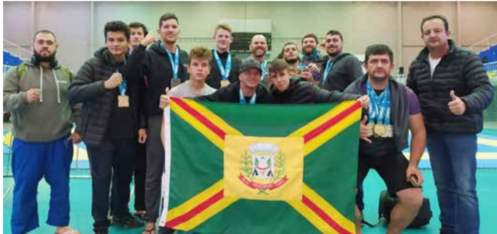
A equipe de 11 atletas se destacou entre mais de mil atletas do Brasil e de outros países da América do Sul

Segunda-feira, 20, Dutra esteve no gabinete do