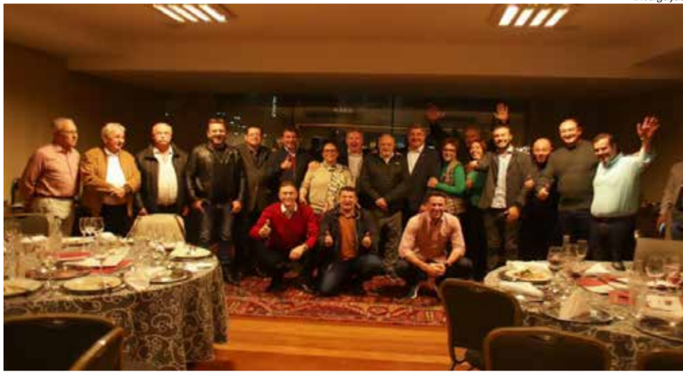
Decisão foi tomada pelo partido em encontro na noite de segunda-feira

O entendimento dos dirigentes é que ele é a liderança capaz de unir o partido e também trazer apoio de outros segmentos da sociedade à reeleição do governador. O empresário, que há mais de um ano vinha percorrendo o interior de Santa Catarina, defendia a necessidade de buscar a unidade dentro do MDB