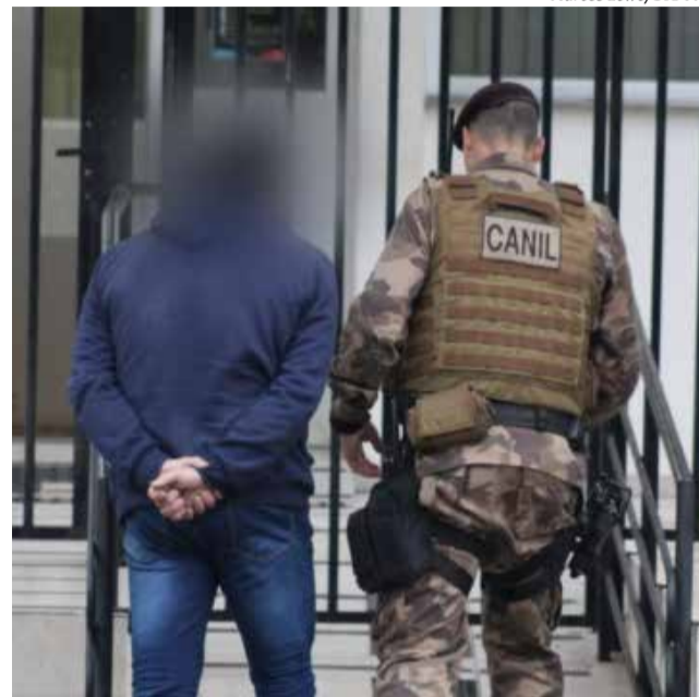
Após o flagrante, empresário foi conduzido para a cadeia