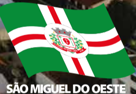
SÃO MIGUEL DO OESTE