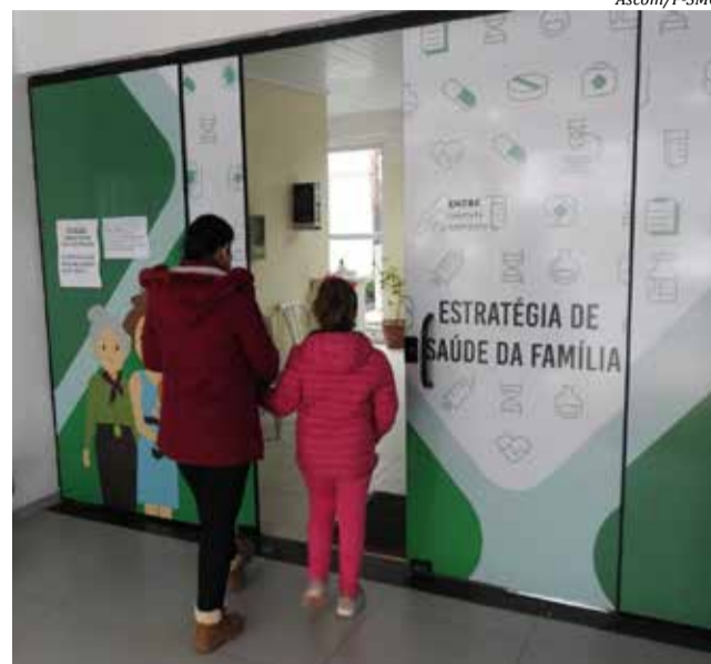
Postos vão começar o atendimento mais cedo e estender até mais tarde sem interrupção ao meio dia

De forma paralela à ampliação dos horários nos postos de saúde, o Município também pretende contratar uma equipe extra para atendimento na UPA 24h. “Tudo isso, para atendermos às necessidades da nossa população cada vez com mais qualidade e eficiência”, descreve o