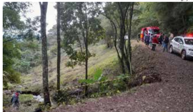
Corpo encontrado no interior de Anchieta mobilizou a polícia e bombeiros