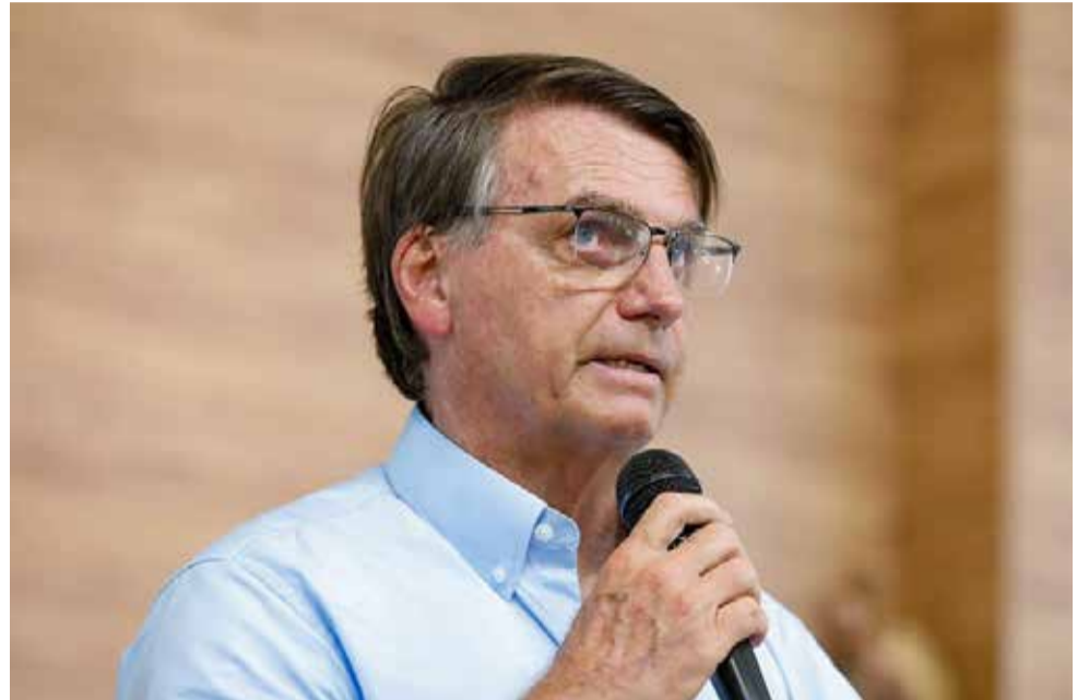
Bolsonaro afirma que Alexandre de Moraes não cumpriu os acordos

O cacique do MDB, no entanto, deu outra versão. Em nota, Temer disse que “não houve condicionantes nem deveria haver, pois tratamos de fazer ali um gesto de boa vontade e grandeza entre dois Poderes do Estado brasileiro”. O ex-presidente ainda destacou que “as conversas se desenvolveram no mais alto nível, como cabia a uma pauta de defesa da democracia” e que “mais do que nunca, o momento é de prudência, responsabilida-