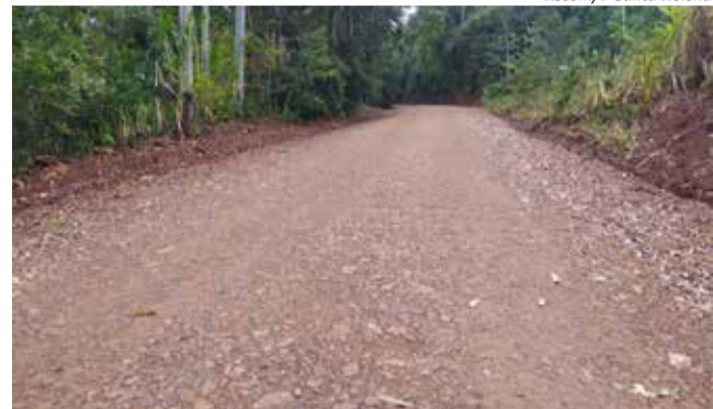
Estrada da Linha Cantina a Quadro Santo Antônio, até a divisa com Belmonte, foi uma das vias recuperadas