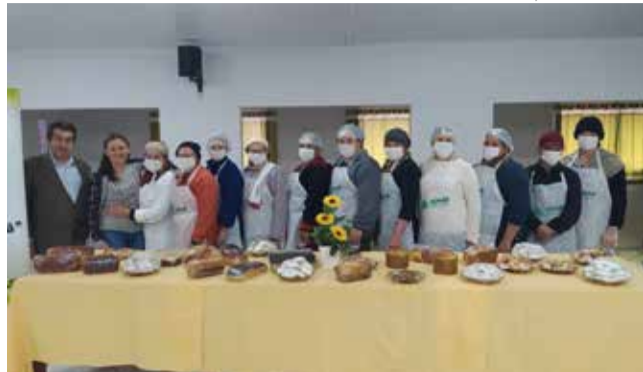
Curso envolveu nove mulheres e um homem durante três dias