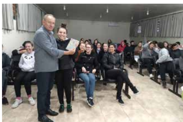
Alunos recebem um exemplar da obra.

Os mais de 150 alunos que tiveram a oportunidade de assistir às palestras nos períodos matutino e vespertino demonstraram grande interesse em ler, estudar e conhecer todos os fatos históricos e que dizem respeito ao legado que a passagem da Coluna por Descanso deixou. A obra teve o incentivo fiscal da Lei Rouanet, o que permitiu sua publicação. Todos os presentes na palestra ficaram gratos também, pelo recebimento de um exemplar do livro resultado do projeto.