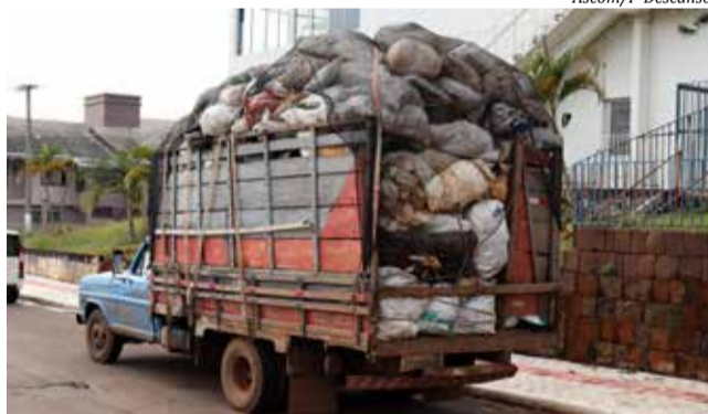
A campanha será realizada entre o dia 27 de junho a 08 de julho