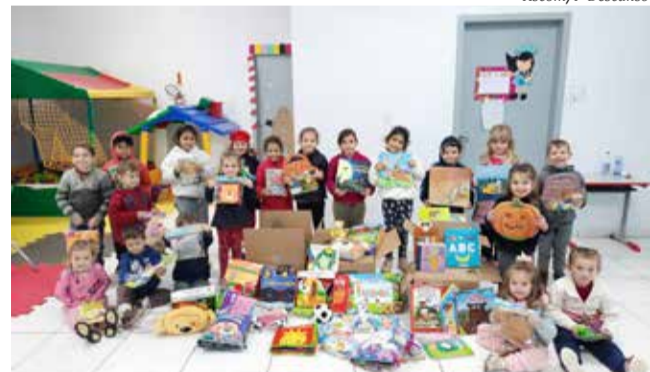
Os livros já estão sendo distribuídos para as escolas de acordo com a faixa etária dos alunos