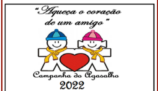
Lançamento da Campanha foi ontem, dia 08.

• CAMPANHA DO AGASALHO: Há alguns dias atrás, reclamamos aqui, na coluna, que as tradicionais campanhas viabilizando agasalhos e cobertores, estavam muito tímidas neste inverno. Estavam, porque a EEB. Everardo Backheuser iniciou sua campanha que promete ser muito generosa. Bom para estimular a solidariedade dos alunos e, melhor ainda, para quem precisa de proteção para o frio que está muito intenso neste ano.