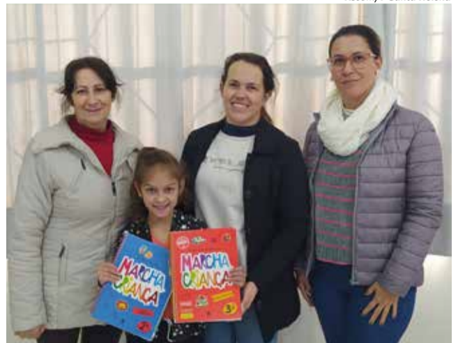
Cada estudante do 1º ao 5º ano recebeu uma apostila de cada idioma