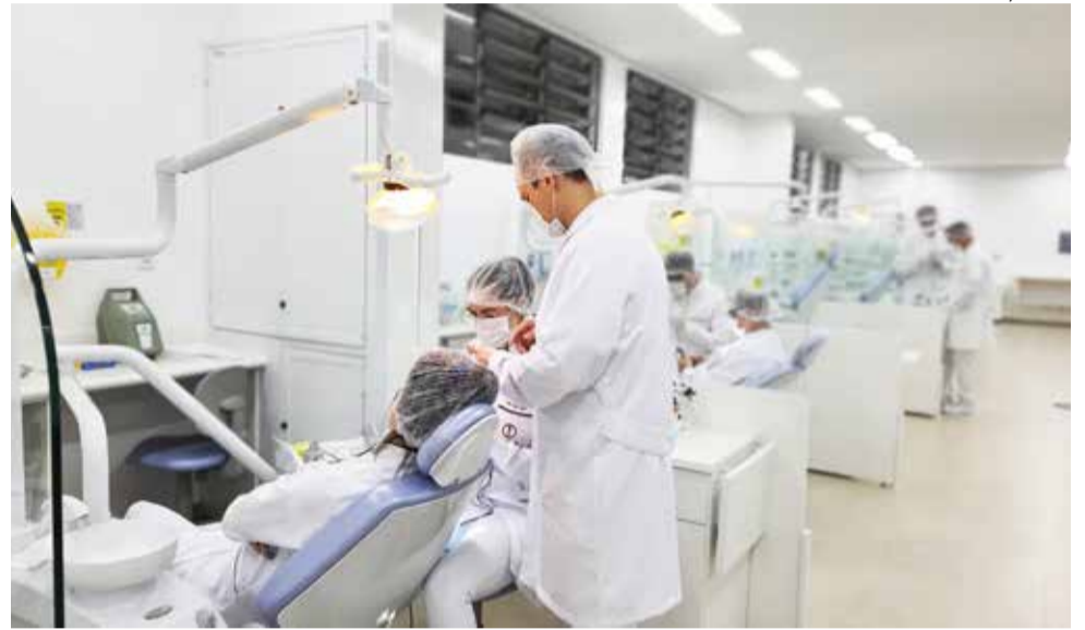
Unoesc São Miguel do Oeste dispõe de uma moderna clínica odontológica que ficará também à disposição da população