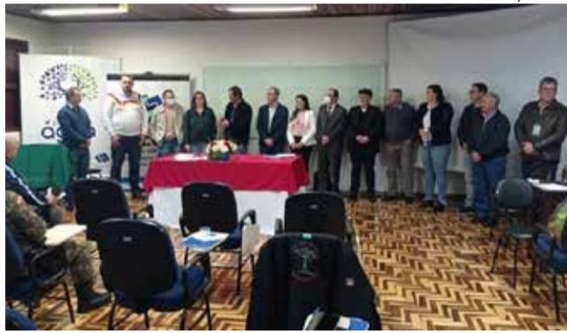
Participaram do evento prefeitos e secretários dos municípios associados à entidade, além de lideranças locais e regionais

O objetivo principal do projeto é mobilizar os mais diversos atores