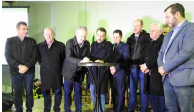
Prefeito Wilson Trevisan e o governador Carlos Moisés firmaram parceria para novas obras em São Miguel do Oeste

"Quando assumimos o Estado, muitas pessoas diziam que Santa Catarina terminava em Chapecó, pois os recursos não chegavam aqui. Estamos mudando isso. Nenhuma região do nosso Estado será esquecida na nossa gestão.