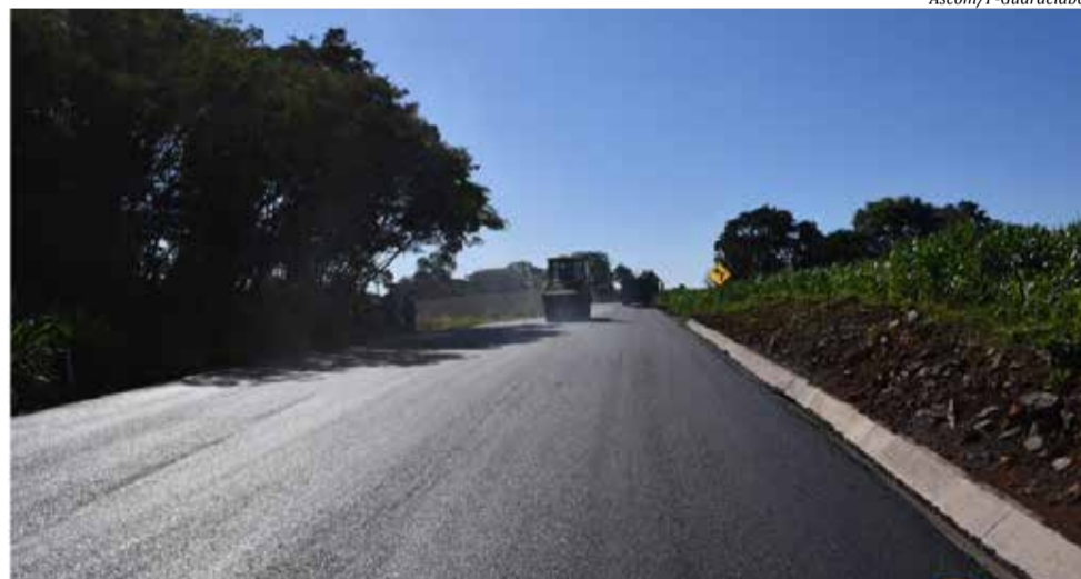
A licitação é para 5º trecho de asfalto que liga a estrada geral/intercessão da Linha Sede Flores até São Roque