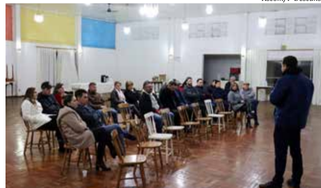
Objetivo foi incentivar a troca de experiências e capacitar os microempreendedores locais