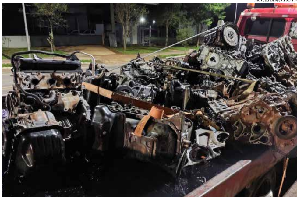
Foram localizados pelo menos 21 motores e praticamente todos estavam com a numeração de série raspada

Após buscas na região, o baú foi localizado em um local de difícil acesso e pouca visibilidade. Ainda conforme a polícia, o compartimento de carga estava fechado com cadeado e foi necessário abrir a estrutura para identificar os objetos. Os motores estavam com a numeração raspada e enfileirados.