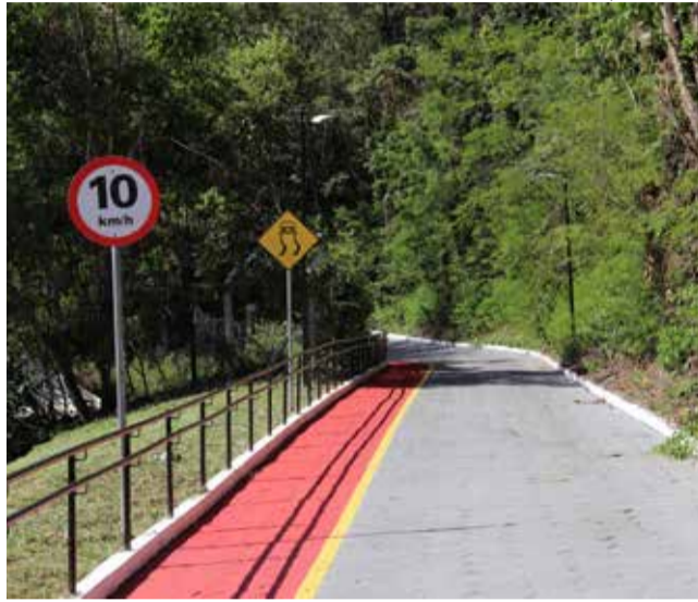
Mais de R$ 600 mil de recursos próprios e destinados foram investidos na primeira e segunda etapa de revitalização do ponto turístico

O ato de inauguração será realizado no dia 20, às 17h30, no Morro do Cristo. "Teremos um momento