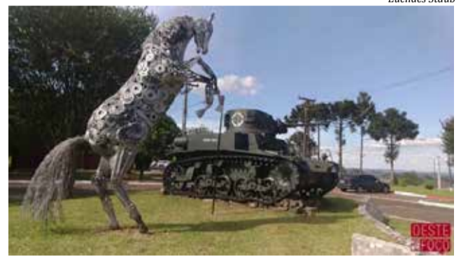
4ª RC Mec em São Miguel do Oeste

(1851-52), à frente do 2º Regimento de Cavalaria Ligeira, desempenhou importante papel em Monte Caseros (1852), sendo promovido a coronel por merecimento.