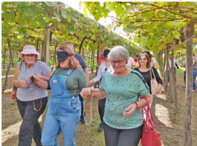
Alunos da Uniti de São Miguel do Oeste e São José do Cedro conheceram a vinícola Giardinoviel em Chapecó