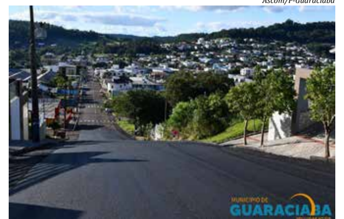
Ruas receberam a camada asfáltica na tarde de sexta-feira

Olavo Bilac, entre a Rua São Pedro e a Rua Antônio Caetano Arpini, com 1.180 metros quadrados, com investimentos de R$ 94.624,20; Rua Antônio Caetano Arpini, entre a Rua Olavo Bilac e a Rua Reinoldo Ritter, com 1.350 metros quadrados, com investimentos de R$ 108.256,50; Rua Willibaldo Hass, entre a Rua Santa Barbara e 15 de Novembro, com 700 metros quadrados e investimentos de R$ 67.067,00; Rua 15 de Novembro, entre a Rua Willibaldo Hass e Laudir Antônio Comin, com 406 metros quadrados e investimentos