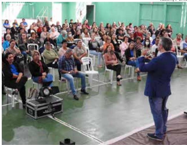
Evento foi realizado no ginásio do Caic na tarde de sábado