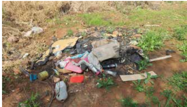
Foi flagrado volume de entulhos depositados de forma errônea e em locais inadequados