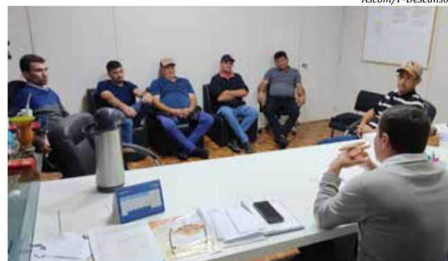
Decisão foi tomada a fim de recuperar o quanto antes todas as estradas e acessos danificados pelas chuvas

Ele acrescenta que as demais demandas dos agricultores serão atendidas por meio do bônus fiscal. "Pedimos a colaboração e a compreensão dos nossos agricultores, que se precisar de algum serviço dentro de sua propriedade que solicite o serviço pelo bônus, que serão re-