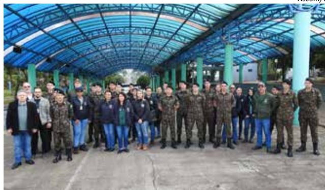
Ação começou a ser desenvolvida com a participação do Exército segunda-feira

Onde estão sendo identificados criadouros, se possível, os mesmos foram eliminados durante a ação. Caso contrário, no