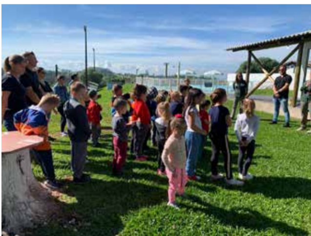
Escoteiros em atividade na AABB de Descanso