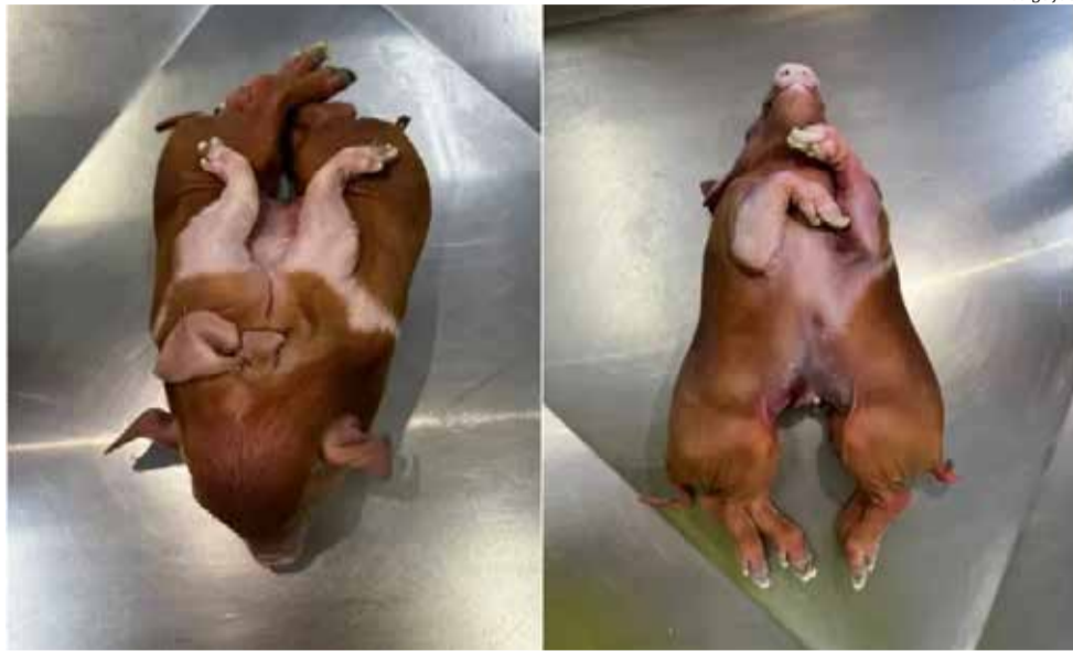
Animal será alvo de estudos por biólogos e veterinários