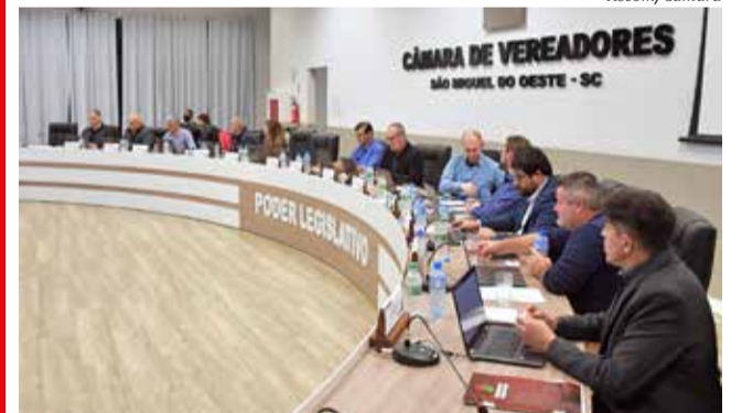
Vetos do prefeito foram mantidos por maioria na sessão de terça-feira