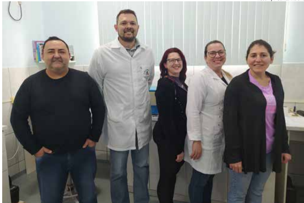
Equipe na linha de frente no município se desdobra para manter os atendimentos

A equipe de Saúde ressalta que a Unidade de Saúde visa a prevenção, mas há exames que ficaram parados por dois anos, não apenas de Santa Helena, mas de toda a região, e isso trouxe um acúmulo para o Hospital Regional. O que aumentou também são os pacientes oncológicos. "Nesse caso, o trabalho é ainda mais