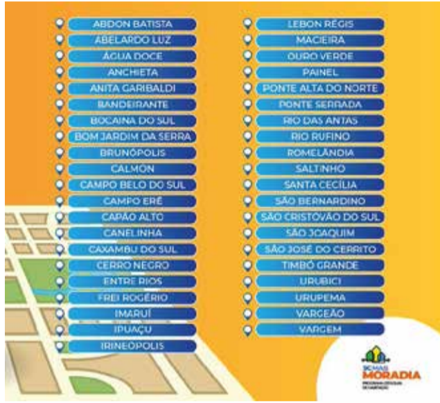
As cidades contempladas nesta fase são as que entregaram a documentação e indicaram a matrícula dos terrenos

O projeto é destinado aos municípios com IDH até 0,699. São 61 cidades que poderão participar, desde que indiquem as matrículas de onde as unidades poderão ser construídas. A SDS está atuando para levantar os imóveis a serem disponibilizados pelos demais municípios