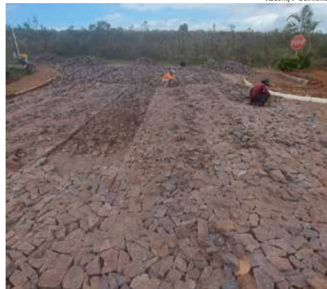
A obra integra o projeto que beneficia as ruas Nossa Senhora Jesus de Baitaca e rua Manuel Ribas