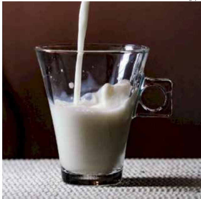
Leite longa vida é um dos itens que teve a alíquota reduzida

O documento aprovado pelo plenário trata, ainda, da ampliação do prazo para concessão de crédito presumido para a farinha com mistura até 31 de dezembro de 2023 e redução do ICMS de 7%