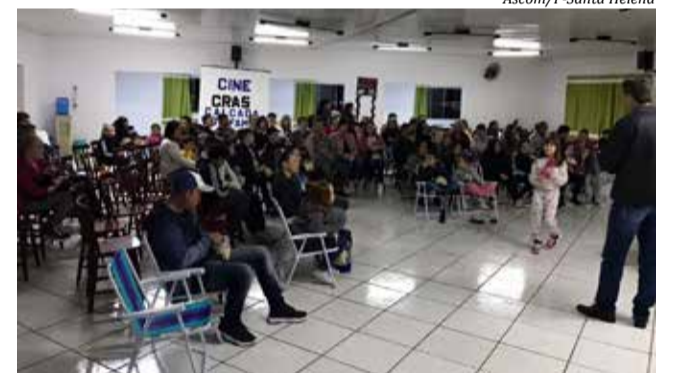
Mais de 100 pessoas prestigiaram a ação desenvolvida pelos usuários do Cras e SCFV

Os usuários sugeriram então a realização do 1º Cine Família. Eles propuseram também que a noite servisse para arrecadar roupas para a Campanha do Agasalho. Deizi afirma que os próprios usuários sugeriram o envolvimento da família. “Ficamos surpresos com a boa adesão e 57% do público que par-