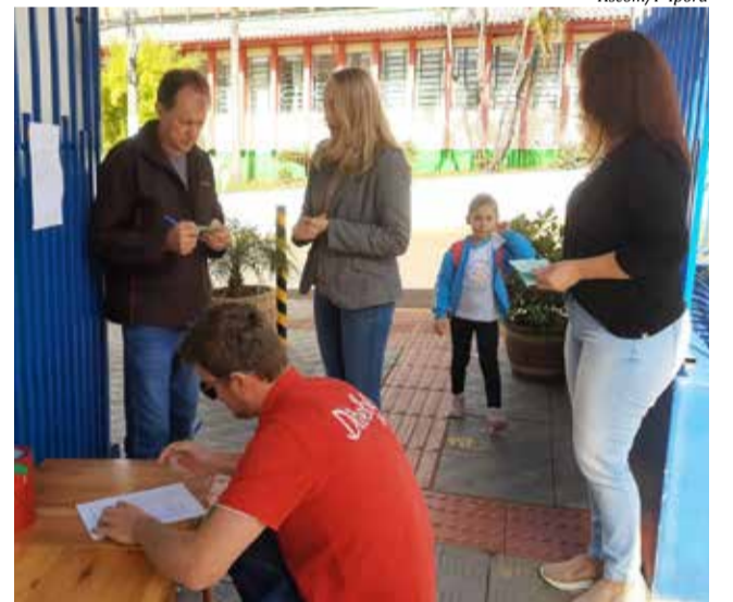
Eleições foram realizadas em escolas e entidades

Também, foram definidos quatro membros de entidades civis organizadas. No dia 06 de maio, ocorreu a escolha na assembleia do Sindicato dos Trabalhadores Rurais e no dia 07 na Pastoral da Criança, ambos com dois representantes eleitos em cada.