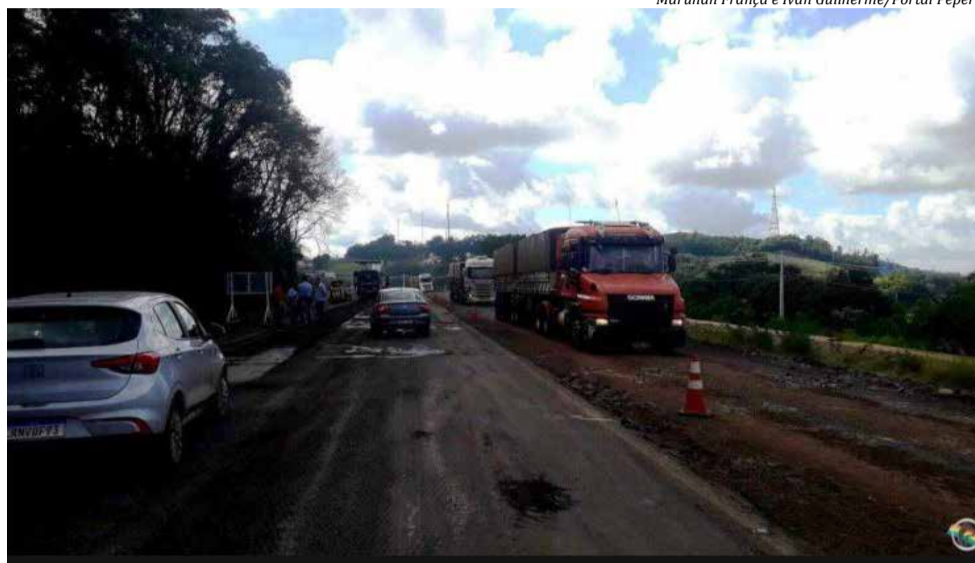
Filas enormes se foraram nos dois sentidos da rodovia

A empreiteira Torc está promovendo a fresagem da pista visando deixar a via adequada para receber o pavimento de concreto, qwue começou a ser colocado ontem. Os trabalhos ocorrem entre os quilômetros 95 e 102 da rodovia e a concretagem iniciará nas proximidades do trevo de acesso ao município de