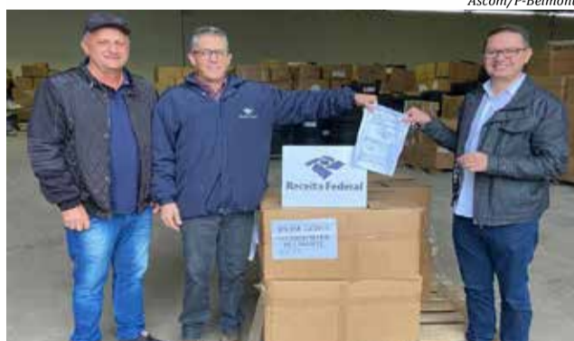
Equipamentos foram repassados ao prefeito Jair Giumbelli (D) terça-feira

Esses materiais serão repassados para alguns setores da administração. Já os veículos serão legalizados e destinados às secretarias para atendimento à população. "São doações que auxiliarão o município a economizar em alguns investimentos e também a melhorar o atendimento à população", disse o prefeito.