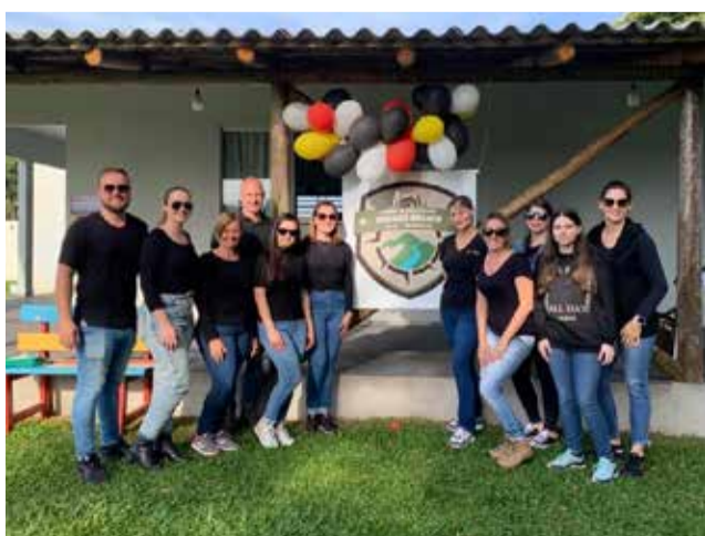
Lideranças do escotismo de Descanso e Iporã do Oeste

As ações iniciaram no domingo que passou com atividades demonstrativas e os organizadores foram agradecidos por uma tarde linda de sol que permitiu realizar todas as atividades propostas com muita segurança.