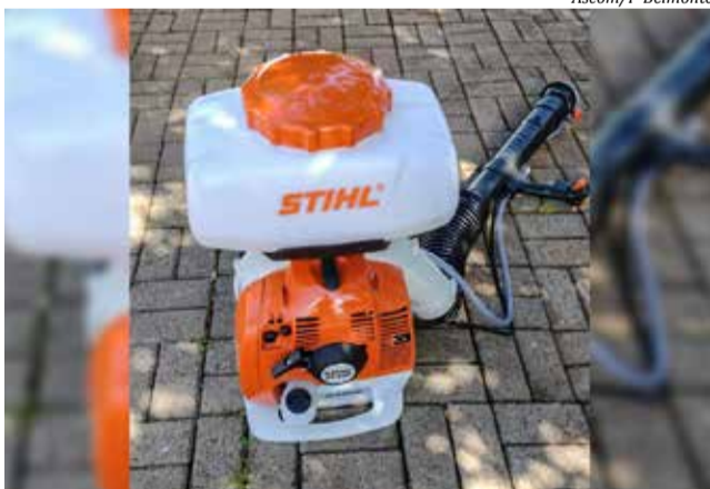
Pulverizador motorizado será mais uma arma contra o mosquito Aedes Aegypti