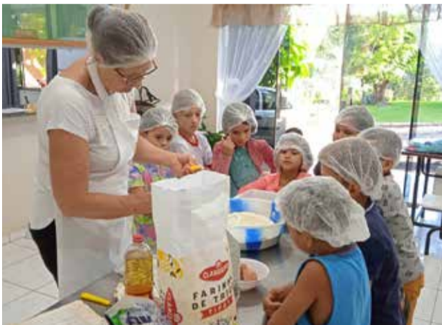
Crianças atentas e curiosas em novo aprendizado