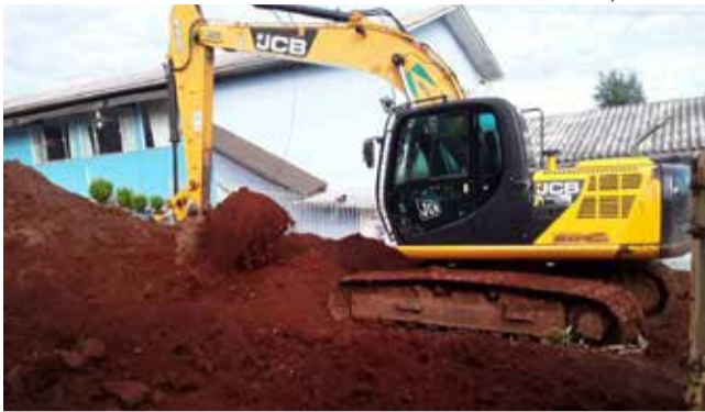
Obras de escavação e nivelamento do terreno iniciaram terça-feira