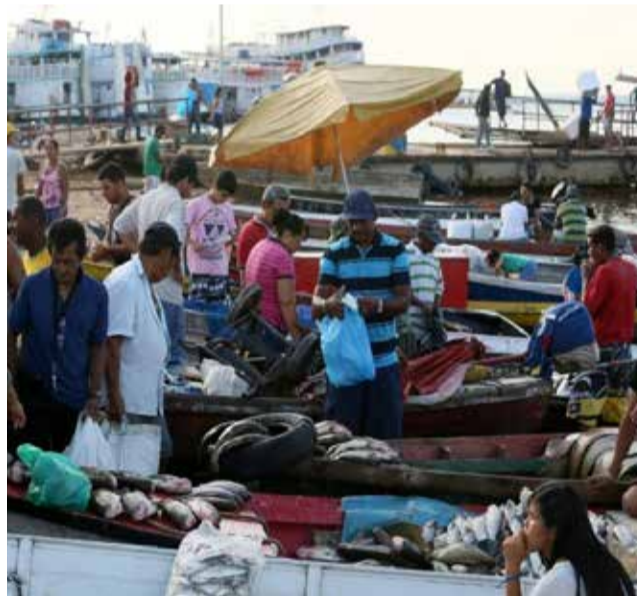
Maiores porto flutuante do mundo está em Manaus

Profissionais e amadores, os bem-intencionados e mal-informados e os bem-informados e mal-intencionados, mais um Xis-Tudo de crenças, desejos e interesses. Todos se dizem unidos na missão de salvar “o meio ambiente” em geral e a “floresta amazônica” em particular; cada vez mais, agora, há entre eles milionários e grandes empresas. Muito bem: toda essa gente, que está sempre pronta a exhibir sua carteirinha de fiscal do bem, não consegue enxergar que na Amazônia há uma população de 20 milhões de brasileiros.