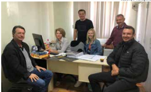
Licitação para as obras do Asfalto da Fronteira foi realizada no dia 20 de abril