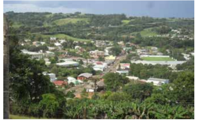
Cidade fica em meio a uma área verdejante, oferecendo boa qualidade de vida à população

bém, com a Associação Agroecológica Vida e Saúde de Tunápolis (Agrovisat) e a Associação dos Viticultores de Tunápolis (Avit), oportunizando aos sócios produtores o espaço para a venda direta ao consumidor. Para atingir objetivos, as entidades realizam semanalmente feiras na sua sede com produtos naturais e orgânicos e de fabricação caseira, provenientes da agricultura familiar.