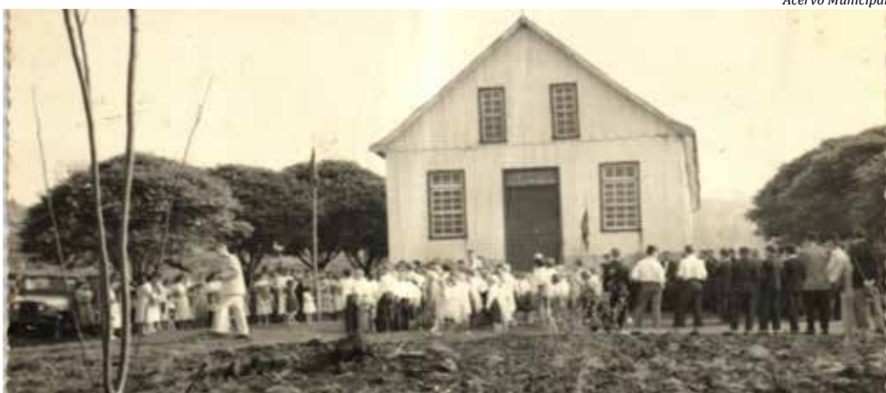
Missa festiva na inauguração da Igreja e Escola em 16 de maio de 1954