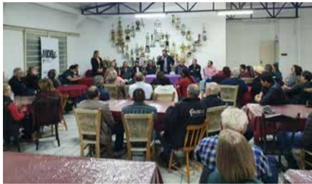
Reunião de SMO foi bastante concorrida

Anúncio de recursos e obras marcam o encontro do parlamentar nas cidades entre Itapiranga e Dionísio Cerqueira.