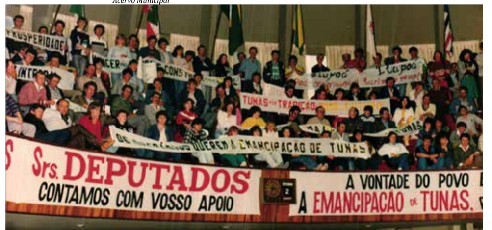
Início pró-emancipação do Distrito de Tunas e, 1º de setembro de 1987