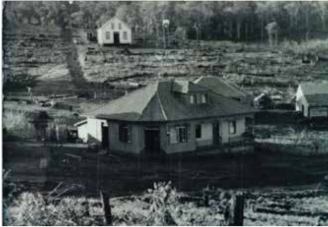
Vista parcial da Vila Tunas. Em primeiro plano a casa de Albino Frantz e aos fundos a Igreja recém construída em 1954

A lei municipal n.º 02/61 do município de Itapiranga criou o distrito de Tunas, ato aprovado pela Assembleia Legislativa em 05 de outubro de 1961,