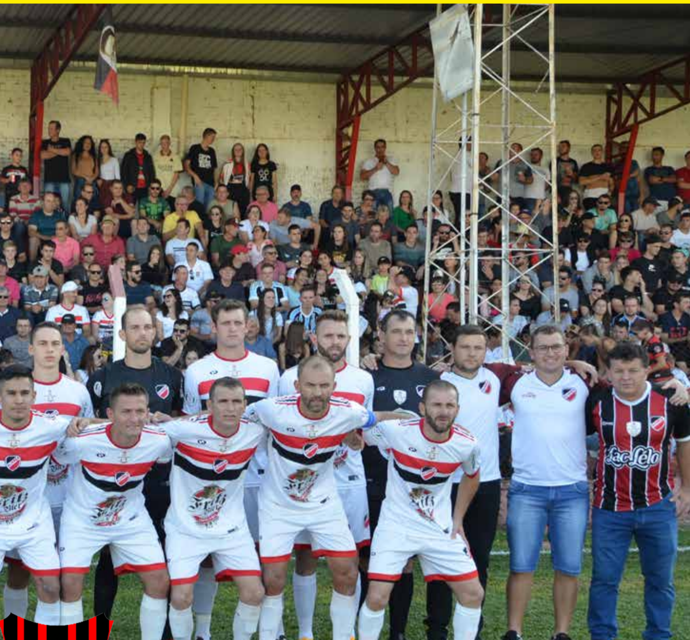
GUARANI – SÃO MIGUEL DOESTE – VICE-CAMPEÃO DA COLPRA D'LAMB SPORT 2022

Apoio da Prefeitura Municipal de São João do Oeste