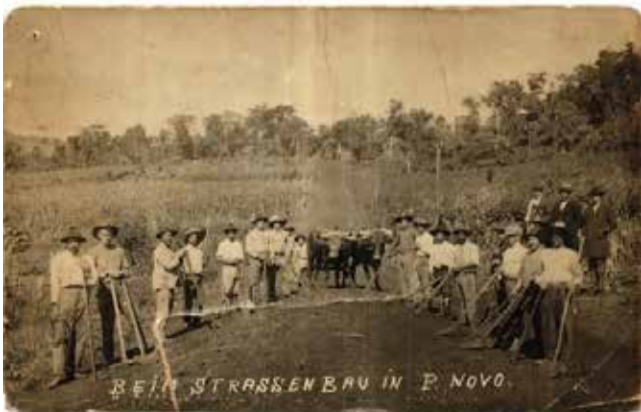
Construção pelos migrantes da estrada que liga Tunas a Porto Novo, hoje Itapiranga