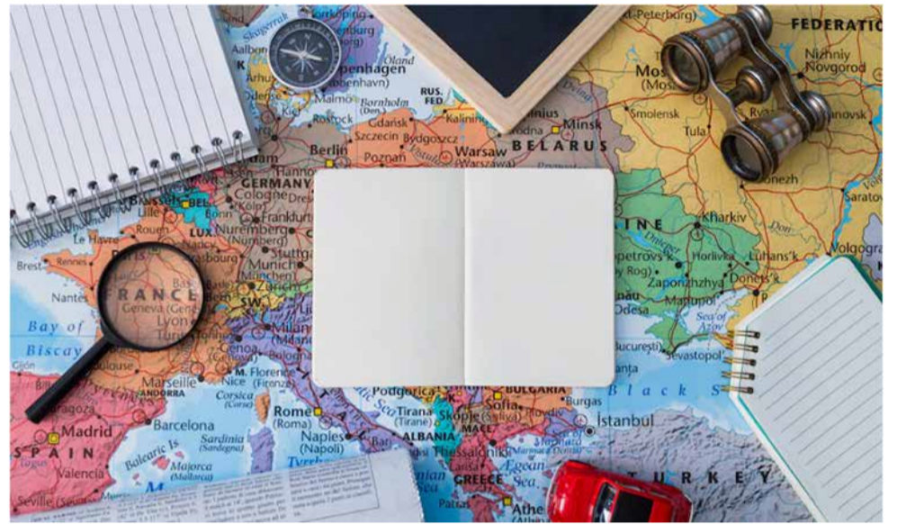
Inscrições estão abertas até dia 04 de maio

Após o término das inscrições, a Coordenação Geral de Relações Internacionais (CGRI) fará a homologação das inscrições que estiverem de acordo com os requisitos e apre-