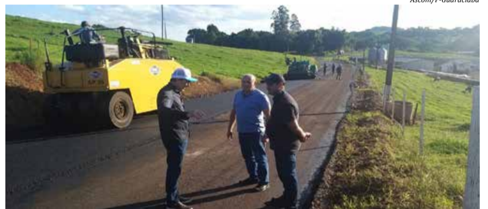
Prefeito Vandecir Dorigon e o vice Domingos Marcon estiveram acompanhando a obra nesse primeiro trecho

O prefeito Vandecir Dorigon e o vice Domingos Marcon estiveram acompanhando a obra nesse primeiro trecho. Conforme a empresa, esta semana esse primeiro quilômetro